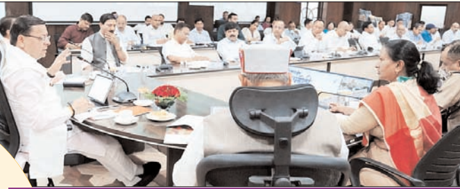
10 मई को केदारनाथ, गंगोत्री और यमुनोत्री धाम के कपाट खुलेंगे, जबकि 12 मई को श्री बद्रीनाथ धाम के कपाट खुलेंगे। अभी तक चारधाम यात्रा के लिये 15 लाख से अधिक श्रद्धालु ऑनलाइन रजिस्ट्रेशन करा चुके हैं।

सभी तैयारियों को लेकर साप्ताहिक समीक्षा बैठक की जाए। चारधाम यात्रा में यातायात प्रबंधन और कानून व्यवस्था को बेहतर बनाने के लिए डीजीपी को भी चारधाम यात्रा से पूर्व स्थलीय निरीक्षण के निर्देश मुख्यमंत्री ने दिये हैं। बुजुर्ग श्रद्धालुओं के लिए चारधाम यात्रा मार्गों पर प्लास्टिक और कूड़ा प्रबंधन के लिए बेहतर व्यवस्थाएं की जाएं।