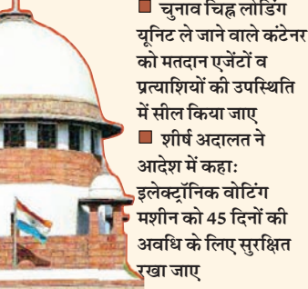
प्रणाली पर आंख मूंदकर अविश्वास करने से अनुचित संदेह पैदा होगा। शीर्ष

नई दिल्ली। उच्चतम न्यायालय ने इलेक्ट्रॉनिक वोटिंग मशीन (ईवीएम) के जरिये पड़े मतों के साथ वोट वरिफिकेशन पेपर ऑडिट ट्रेल (वीवीपैट) को पर्चियों की गिनती (मिलान) 100 फीसदी तक बढ़ाने या मतपत्रों को पुरानी व्यवस्था बहाल करने की मांग वाली सभी याचिकाएं शुरुआत को सर्वसम्मति से खारिज कर दी। न्यायमूर्ति संजीव खन्ना और न्यायमूर्ति दीपाकर दत्ता की पीठ ने एनजीओ 'एसोसिएशन फॉर डेमोक्रेटिक रिफॉर्म' और अन्य की ओर से दायर याचिकाओं पर अलग-अलग, लेकिन सहमति वाला फैसला सुनाया। ईवीएम-वीवीपैट