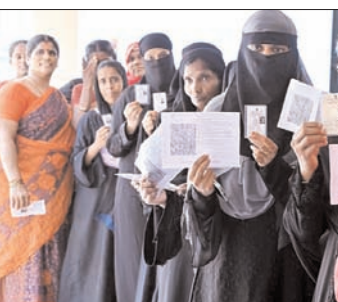
दूसरे चरण में मतदान प्रतियोगिता में आई जबरदस्त गिरावट

नई दिल्ली। 18वीं लोकसभा के चुनाव के लिए दूसरे चरण में शुरुआत 26 अप्रैल को 13 राज्यों और केंद्र शासित प्रदेशों की 88 सीटों पर करीब 64.64 प्रतिशत वोटिंग हुई। त्रिपुरा में सबसे ज्यादा करीब 77.93 प्रतिशत वोटिंग हुई।