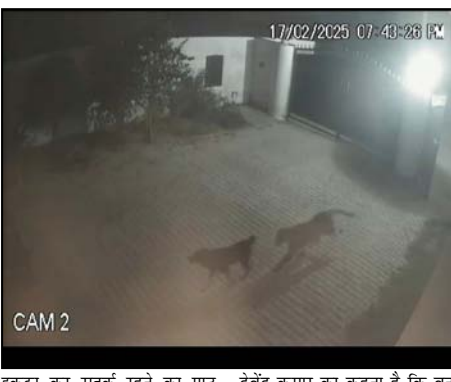
इकट्टा कर सतक रहने का पाठ पढ़ाकर चले थे लेकिन सोमवार की रात फिर से तेंदुआ चहल कदमी करते हुए कूत्ते को अपना निवाला बनाना चाहा जो कि सीसी टीवी कैमरे में केंद्र होगया गांव में तेंदुए की चहल कदमी से ग्रामीणों में भय का माहौल बना हुआ है लेकिन वन विभाग करीमपुर के जंगल से तेंदुआ पकड़ने में नाकाम साबित हो रहा है सूचना देने के बाद भी वन विभाग का कोई अधिकारी मौके पर नहीं पहुंचा उधर ग्राम प्रधान

शाह टाइम्स संवाददाता मसवासी/रामपुर। चौकी क्षेत्र के गांव करीमपुर के जंगल में तेंदुए की पकड़ने में वन विभाग नाकाम साबित हो गया है सोमवार की रात तेंदुआ की आहट फिर गांव में हुई जो की कैमरे में केंद्र ही गयी तेंदुए की आहट से गांव वालों में हड़कंप मचा हुआ है भी वन विभाग को टीम ने तेंदुए के पद चिन्ह तलाश लेकिन तेंदुए का कोई पता नहीं चल सका है।