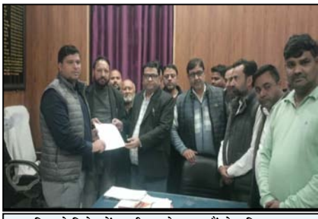
स्वार। बिल के विरोध में एसडीएम को ज्ञापन सौंपते अधिवक्तागण।

शाह टाइम्स संवाददाता स्वार/रामपुर। सरकार संसद में एडवोकेट अमेंडमेंट बिल 2025 लाने जा रही है एडवोकेट कानून में संशोधन को लेकर वकीलों ने नारा, जगो जताते हुए उप जिलाधिकारी कार्यालय पर प्रदर्शन किया है। बाद में दोनों बारां के वकीलों ने राष्ट्रपति को सम्बोधित ज्ञापन एस डी एम को सौंपा।