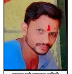
मृतक को फाइनल फोटो

शाह टाइम्स संवाददाता पटवाई/रामपुर। धाना क्षेत्र के असावतपुर गांव में राजमिस्त्री का काम कर रहे बूढ़े पुर निवासी धर्मेश 35 वर्ष की करंट लगने से मौत हो गई। जिससे आसपास के लोगों में कोहराम मच गया। मौके पर पुलिस ने शव का पंचनामा भर पोस्टमार्टम के लिए भेज दिया है।