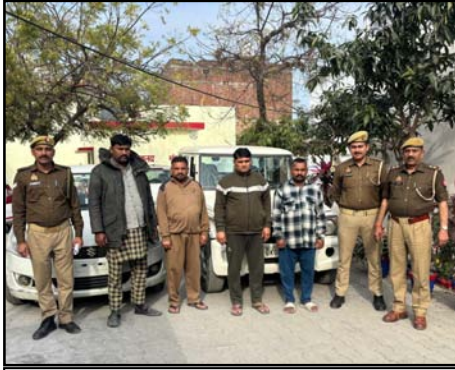
मसवामी। हमला करने के आरोप में पकड़े गये चार व्यक्ति।

शाह टाइम्स संवाददाता मसवामी/पट्टी कला क्षेत्र में एआरटीओ और खनन अधिकारी को कार में टक्कर मारने के आरोप में पुलिस ने मानपुर तिराहे से गिरफ्तार कर न्यायालय में पेश किया है।