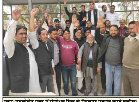
स्वार। एडवोकेट एक्ट में संशोधन बिल के खिलाफ प्रदर्शन करते वकील।

ने बैठक कर एडवोकेट अमेंडमेंट बिल 2025 को वकीलों की स्वतंत्रता निष्पक्षता एवं निर्भीक वकालत पर कुठाराघात बताया है। जिसके विरोध में बार काउंसिल ऑफ उत्तर प्रदेश के आह्वान पर वकीलों ने हाथों पर काली पट्टी बांधकर हड़ताल पर रहने का निर्णय लिया। बाद में वकीलों ने विधि मंत्रालय द्वारा एडवोकेट एक्ट 1961 में संशोधन के लिए तैयार ड्राफ्ट पर आपत्ति जताते हुए संशोधित धारा 35। और 49। (1) पर विरोध