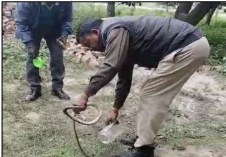
मजदूरों ने उन्हें बताया कि पहले तो मिट्टी हिलती देखी पास जाकर देखा तो सांपों के फुस्कारों की आवाज आ रही थी।