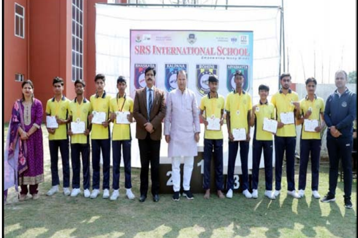
गजरोला। एसआरएस इंटरनेशनल स्कूल में खेल प्रतियोगिता में बच्चों को सम्मानित करते अतिथि।