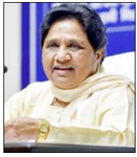
मायावती अध्यक्ष, बसपा

कांग्रेस के वरिष्ठ सांसद और लोकसभा में नेता प्रतिपक्ष राहुल गांधी को बसपा पर उंगुली उठाने से पहले अपने गिरेबान में झांक कर देख लेना चाहिए था, दिल्ली विधानसभा चुनाव में कांग्रेस भाजपा की भी टीम बन कर चुनाव मैदान पर उतरी, जिसके कारण भाजपा को दिल्ली की सत्ता में आने का मौका मिला, यह आम चर्चा है, जिसके कारण यहाँ बीजेपी सत्ता में आई है, वरना इस चुनाव में कांग्रेस का इतना बुरा हाल नहीं होता, यह पार्टी अपने ज्यादातर उम्मीदवारों की जमानत भी न बचा पाए, राहुल गांधी को किसी भी मामले में दूसरों पर व खासकर बीएसपी की प्रमुख पर उंगुली उठाने से पहले अपने गिरेबान में भी जरूर झांक कर देखा चाहिए, यह बेहतर होगा।