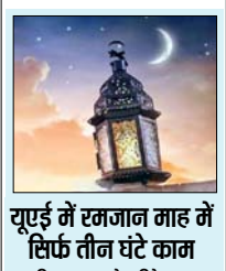
यूपई में रमजान माह में सिर्फ तीन घंटे काम विस्तृत खबर देस-विदेस पर

महाकुंभनगर। मुख्यमंत्री योगी आदित्यनाथ ने गुरुवार को प्रयागराज महाकुंभ में कार्यरत रहे स्वच्छता कर्मियों एवं स्वास्थ्य कर्मियों को बड़ी सौगात देते हुए प्रदेश सरकार की ओर से अतिरिक्त बोनस के रूप में 10 हजार रुपये की धनराशि प्रदान करने का ऐलान किया। मुख्यमंत्री ने सफाई कर्मियों और स्वास्थ्य कर्मियों को उपहार के साथ ही स्वच्छ कुम्भ कोष से बीमा प्रमाण पत्र प्रदान किया और साथ ही मंच से ऐलान किया कि जो स्वच्छता कर्मों और स्वास्थ्यकर्मों महाकुंभ को महा आयोजन में सहभागी बने, उन्हें प्रदेश सरकार की ओर से अतिरिक्त बोनस के रूप में 10 हजार रुपये की धनराशि प्रदान की जाएगी। उन्होंने यह भी ऐलान किया कि अग्रेल से प्रदेश सरकार एक कॉर्पोरेशन का गठन करने जा रही है, -शेष पृष्ठ पर