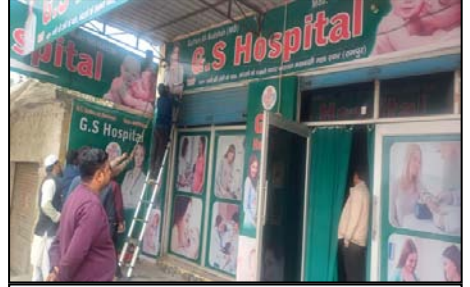
मसवासी अस्पताल में बिजली की जांच करते बिजली कर्मी।