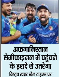
अफगानिस्तान सेमीफाइनल में पहुंचने के इरादे से उठेगा विस्तृत खबर खेल टाइम्स पर