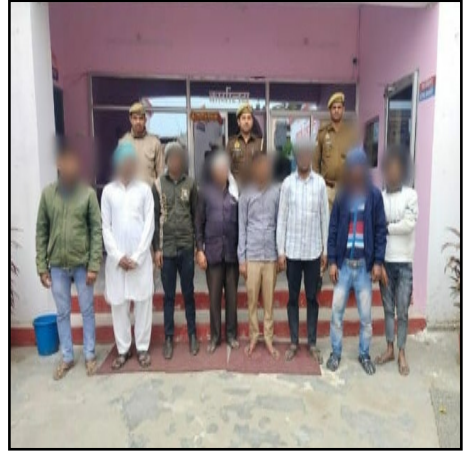
एसडीएम शाहाबाद कोर्ट में पेश किया गया।