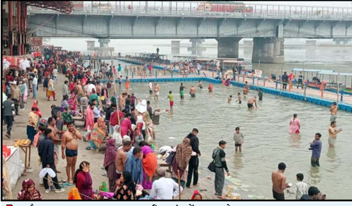
गजरोला। फाल्गुन अमावस्या पर ब्रजघाट स्थित गंगा में स्नान करते श्रद्धालु। शुभ माना जाता है और पितरों को भी शांति मिलती है, उधर गजरोला में अमावस्या स्नान को श्रद्धालुओं की भारी भीड़ उमड़ने से हाइवे स्थित ब्रजघाट गंगा पुल पर भी यातायात का दबाव झेलना पड़ा। फाल्गुन अमावस्या के अवसर पर ब्रजघाट क्षेत्र के गांव तिगरीधाम में गंगा स्नान करके पुण्य लाभ कमाया। यहां पर ग्रामीण आंचलिक क्षेत्रों के श्रद्धालुओं की संख्या ज्यादा देखने को मिली। दोनों ही स्थानों पर पुलिस की कड़ी सुरक्षा व्यवस्था रही।

शाह टाइम्स संवाददाता, गजरोला। फाल्गुन अमावस्या के अवसर पर तीर्थ नगरी ब्रजघाट व तिगरी में हजारों श्रद्धालुओं ने गंगा में आस्था की डुबकी लगाकर पुण्य लाभ अर्जित किया। फाल्गुनी अमावस्या के अवसर पर तीर्थ नगरी ब्रजघाट में श्रद्धालुओं का पहुंचना बुधवार की सायं से ही शुरू हो गया था। जो अमावस्या के दिन देर सायं तक चलता रहा। गुरुवार की तड़के ब्रह्म मुहूर्त के साथ श्रद्धालुओं ने गंगा मैया में आस्था की डुबकी लगाकर पुण्य लाभ अर्जित किया। श्रद्धालुओं ने अपने पितरों की आत्म शान्ति के लिये हवन यज्ञ कराया तथा पिण्ड दान किया। श्रद्धालुओं ने तीर्थ नगरी स्थित वेदांत मंदिर, राधा कृष्ण मंदिर, अमृत परिसर मंदिर आदि अपने अपने देवी देवताओं के मंदिरों में जाकर दर्शन कर पुण्य लाभ अर्जित किया। तिगरी स्थित गंगा तट पर भी श्रद्धालुओं ने फाल्गुनी अमावस्या पर गंगा स्नान किया। फाल्गुनी अमावस्या का महत्व शास्त्रों में बहुत ही महत्वपूर्ण बताया गया है। माना जाता है कि फाल्गुनी अमावस्या पर देवताओं का निवास गंगा तट पर होता है। इसीलिए इस दिन गंगा स्नान