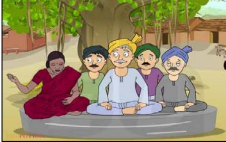
पर खर्च ब्यूरो को लेकर गांव में बवाल मचा हुआ है कई लोगों ने जिलाधिकारी समेत आला अधिकारियों को शपथ पत्र देकर शिकायत की गई थी को ग्राम प्रधान

शाह टाइम्स संवाददाता मसवासी/रामपुर। खोदकला ग्राम पंचायत में विकास कार्यों की शिकायत पर फिर जांच टीम। अब एक मार्च को गांव पहुंचेगी और ग्रामीणों के बयान दर्ज किए जाएंगे। गुरुवार को भी जांच के लिए टीम पहुंचनी थी लेकिन प्रधान के खिलाफ जांच टीम नहीं पहुंच सकी। जिससे तमाम शिकायत कर्ताओं को वापस होना पड़ा। खोदकला ग्राम पंचायत में सोलर लाइट की खरीद और खेल के मैदान