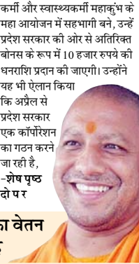
यूपी में सफाईकर्मियों का वेतन हुआ 16000 प्रति माह

महाकुंभनगर। मुख्यमंत्री योगी को मेला प्राधिकरण द्वारा बनाए गए तीन गिनीज बुक ऑफ वर्ल्ड रिकार्ड का प्रमाण पत्र गुरुवार को भेंट किया गया। मुख्यमंत्री को गिनीज बुक ऑफ वर्ल्ड रिकार्ड की ओर से मेला प्राधिकरण द्वारा स्थापित तीन वर्ल्ड रिकार्ड्स का प्रमाणपत्र प्रदान किया गया। इन तीन वर्ल्ड रिकार्ड्स में से पहला एक साथ सर्वाधिक लोगों (329) द्वारा एक ही समय में कई स्थलों पर नदी की सफाई, दूसरा एक साथ सर्वाधिक संख्या 19 हजार सफाईकर्मियों द्वारा सफाई अभियान चलाए जाने और तीसरा आठ घंटे तक सर्वाधिक 10 हजार 102 लोगों द्वारा हैंडप्रींट बनाने का वर्ल्ड रिकार्ड शामिल रहा।