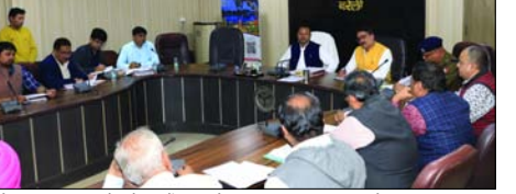
बैठक में व्यापारियों द्वारा अवगत कराया गया कि महादेव पुल से कोहाड़ापर के दोनों तरफ ई-रिक्शा की वजह से जाम की समस्या होती है, जिसपर जिलाधिकारी ने पुलिस अधीक्षक तथागायात को उचित कार्यवाही करते हुए जाम की समस्या