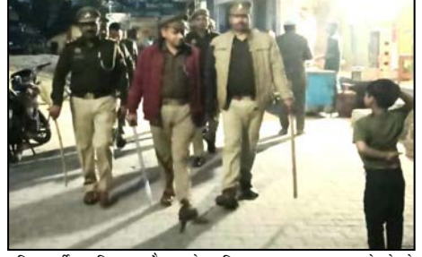
पुलिसकर्मी प्रभावित हुए और उससे बात कर पूछा कि स्कूल जाते हो तो बच्चे ने कहा जो स्कूल जाता हूँ पढ़ लिखकर क्या बनना चाहते हो तो उसने कहा आपकी तरह पुलिस बनना चाहता हूँ।