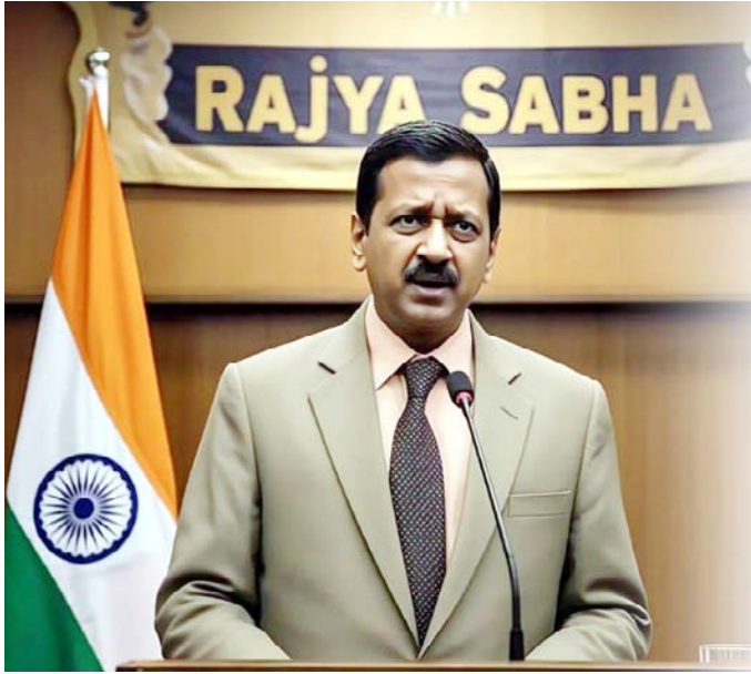
अरविंद केजरीवाल के अलावा मनीष सिंसोदिया