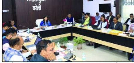
बैठक में दवा वितरण स्थलों पर उपलब्ध दवाओं का बोर्ड लगाने और दवा वितरण स्थल पर शोड की व्यवस्था कराए जाने तथा चिकित्सालयों में बायो मेट्रिक उपस्थिति सुनिश्चित करने के निर्देश दिए गए। बैठक में निराश्रित गैरबंश संरक्षण, गौशालाओं के निर्माण, भूसा, हरा चारा की उपलब्धता आदि की समीक्षा की गयी, और सम्बंधित अधिकारियों को गौशालाओं में गोवशो के लिए पर्याप्त व्यवस्था सुनिश्चित करने के निर्देश दिए गए। बैठक में मुख्यमंत्री युवा उद्यमी विकास अभियान योजना की समीक्षा की गयी, जिसपर अलग-अलग कराराया गया कि जनपद बरेली का

■ मुख्यमंत्री युवा उद्यमी विकास अभियान योजना में लक्ष्य के सापेक्ष शीघ्रता से प्रगति लाने के दिए गए निर्देश