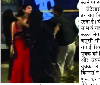
सेटेलाइट बस अड्डे के पास हरा रात किन्नरों का जमावड़ा रहता है। सैक्स गतिविधियों के साथ वे राह चलते लोगों को रो. ककर नेग के नाम पर जबनर वसुली भी करते हैं। मंगलवार रात ई रिक्शा पर जा रहे एक युवक को किन्नरों ने रोके लिया और उससे पैसे मांगने लगे। युवक ने इन्कार किया तो किन्नरों ने उसके साथ मारपीट शुरू कर दी। सूचना मिली तो सेटेलाइट पुलिस चौकी से पहुंची चौकी मोबाइल ने आसपास के लोगों की मदद से युवक को बचाया। पूरी घटना का वीडियो भी वायरल हुआ है। हालांकि किन्नरों के खिलाफ तहरीर देने से इन्कार कर दिया।

करोने पर उसे जमकर पीटा। सेटेलाइट बस अड्डे के पास हरा रात किन्नरों का जमावड़ा रहता है। सैक्स गतिविधियों के साथ वे राह चलते लोगों को रो. ककर नेग के नाम पर जबनर वसुली भी करते हैं। मंगलवार रात ई रिक्शा पर जा रहे एक युवक को किन्नरों ने रोके लिया और उससे पैसे मांगने लगे। युवक ने इन्कार किया तो किन्नरों ने उसके साथ मारपीट शुरू कर दी। सूचना मिली तो सेटेलाइट पुलिस चौकी से पहुंची चौकी मोबाइल ने आसपास के लोगों की मदद से युवक को बचाया। पूरी घटना का वीडियो भी वायरल हुआ है। हालांकि किन्नरों के खिलाफ तहरीर देने से इन्कार कर दिया।