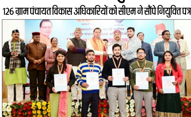
शाह टाइम्स ब्यूरो

126 ग्राम पंचायत विकास अधिकारियों को सीएम ने सौंपे नियुक्ति पत्र