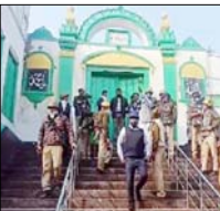
रिपोर्ट के आधार पर कोर्ट तय करेगा कैसे बिना ढांचे को नुकसान पहुंचाए रंगाई-पुताई हो

इलाहाबाद हाईकोर्ट में भारतीय पुरातत्व सर्वेक्षण (एएसआई) ने कहा है कि संरक्षित स्थल होने के कारण वह सम्भल स्थित जामा मस्जिद में रंगाई-पुताई की अनुमति नहीं दे सकता है। कोर्ट ने इस संबंध में अब एएसआई से रिपोर्ट मांगी है। वेसे कोर्ट ने कहा कि तीन सदस्यीय कमेटी की गिरफ्तारी में रंगाई-पुताई हो सकती है। इसके लिए कोर्ट ने एएसआई और वैज्ञानिक के अलावा प्रशासन के एक अधिकारी को तीन सदस्यीय कमेटी बनाने को कहा है। तीन सदस्यीय कमेटी मस्जिद परिसर का निरीक्षण करेगी और यह तय करेगी कि किसी स्ट्रक्चर को नुकसान पहुंचाए बिना रंगाई-पुताई कैसे की जाए। एएसआई तीन सदस्यीय कमेटी की रिपोर्टें शुक्रवार को प्रस्तुत करेगी। इस रिपोर्ट के आधार पर कोर्ट शुक्रवार को यह तय करेगा कि कैसे बिना ढांचे को नुकसान पहुंचाए रंगाई-पुताई होगी। वेसे मंदिर पक्ष और एएसआई की तरफ से जामा मस्जिद की प्रबंध समिति की याचिका का विरोध किया गया। प्रबंध समिति ने रमजान का महौना शुरू होने से पहले रंगाई-पुताई व मरम्मत की अनुमति मांगी थी। इसे एएसआई ने खारिज कर दिया था। इससे पहले जामा मस्जिद में रंगाई