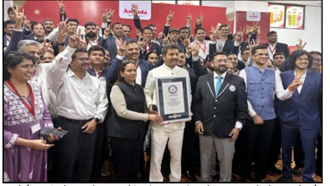
गिनीज वर्ल्ड रिकॉर्ड्स में अपना नाम दर्ज करा लिया है। आनन्दा ने 205.4 किलो का दुनिया का सबसे बड़ा पनीर स्लैब बनाकर यह ऐतिहासिक उपलब्धि हासिल की है। यह रिकॉर्ड न केवल आकार की दृष्टि से महत्वपूर्ण है, बल्कि यह गुणवत्ता, स्वच्छता और शुद्धता के उच्चतम मानकों पर भी धरा