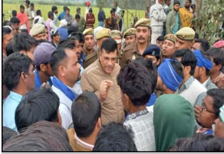
ढकिया। घटना स्थल पर मौजूद भीड़ को समझाते एसपी रामपुर।