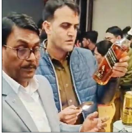
शाह टाइम्स ब्यूरो बुलंदशहर। गुरुवार को बुलंदशहर में आबकारी विभाग ने अवैध शराब परसेने के मामले में मोके से हरियाणा में बिक्री के लिए निर्धारित शराब की सीलबंद बतौले बरामद हुई है।