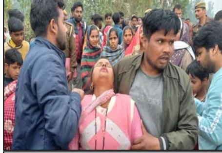
ढकिया। घटना स्थल पर विलाप करते मृतक के परिजन।