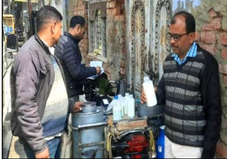
रामपुर। कचरी का सेम्पल भरकर सीज करती खाद्य विभाग की टीम