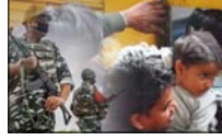
26 फरवरी तक काउंटर से प्लेटफॉर्म टिकट बंद, 60 स्टेशनों पर होल्डिंग एरिया बनाने की तैयारी

नई दिल्ली। नई दिल्ली रेलवे स्टेशन पर सेंट्रल रिजर्व पुलिस फोर्स (सीआरपीएफ) और दिल्ली पुलिस की तैनाती की गई है। महाकुंभ के बीच बढ़ती भीड़ को कंट्रोल करने के लिए केंद्र सरकार ने यह फैसला लिया है। इसके अलावा रेलवे ने 26 फरवरी तक शाम 4 बजे से रात 11 बजे तक काउंटर से प्लेटफॉर्म टिकट की बिक्री बंद कर दी है। सूत्रों के मुताबिक रेलवे ने भविष्य में पीक सीजन में भारद्वाज जैसी घटनाओं से बचने के लिए देश के 60 बड़े स्टेशनों पर होल्डिंग एरिया बनाने की योजना बनाई है। महाकुंभ के बाद 2027 में नासिक और हरिद्वार में