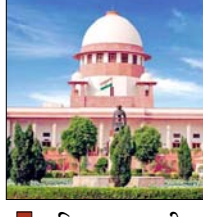
फिलहाल कुशीनगर मामले में आगे किसी भी तरह की तोड़फोड़ कार्रवाई पर रोक लगा दी है।

शाह टाइम्स ब्यूरो नई दिल्ली। सुप्रीम कोर्ट ने उत्तर प्रदेश सरकार को नोटिस जारी किया है। इस नोटिस में सुप्रीम कोर्ट ने पूछा है कि उत्तर प्रदेश सरकार ने कुशीनगर में मस्जिद में तोड़फोड़ करके उनके 13 नवम्बर 2024 के आदेश का उल्लंघन किया है। 13 नवम्बर 2024 को दिए आदेश में सुप्रीम कोर्ट ने बिना पूर्व नोटिस और दूसरे पक्ष को सूने बिना तोड़फोड़ कार्रवाई पर रोक लगा दी थी। सुप्रीम कोर्ट ने फिलहाल कुशीनगर मामले में आगे किसी भी तरह की तोड़फोड़ कार्रवाई पर रोक लगा दी है। जस्टिस बीआर गवई और जस्टिस एजी मसौद की पीठ ने उत्तर प्रदेश सरकार को कारण बताओ नोटिस जारी करते हुए पूछा कि क्यों न संबंधित अधिकारियों के खिलाफ अदालत की अवमानना करने के लिए कार्रवाई की जाए? सुप्रीम कोर्ट ने याचिका पर आदेश पारित करते हुए कुशीनगर मामले में आगे किसी भी तरह की तोड़फोड़ कार्रवाई पर रोक लगा दी है। गौरतलब है कि कुशीनगर जिले में प्रशासन ने मदन मस्जिद के