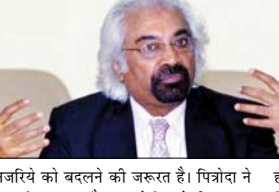
चीन भारत का दुश्मन नहीं: सैम पित्रोदा

शाह टाइम्स ब्यूरो नई दिल्ली। इंडियन ओवरसीज कांग्रेस के अध्यक्ष और राहुल गांधी के करीबी सचिव पित्रोदा ने कहा कि भारत को चीन को अपना दुश्मन मानना बंद कर देना चाहिए। चीन से खतरों का अक्सर बढ़ा-चढ़ाकर पेश किया जाता है। हालांकि कांग्रेस ने सैम पित्रोदा के बयान से किनारा कर लिया है। पार्टी महासचिव जयराम मेश्रान ने कहा कि सैम पित्रोदा के चीन पर व्यक्त किए गए विचार कांग्रेस के विचार नहीं हैं। एक इंटरव्यू में सैम पित्रोदा ने कहा कि चीन को दुश्मन मानने के बजाय उसे सम्मान देना चाहिए। यह किसी के लिए भी ठीक नहीं है। पित्रोदा ने मुझे समझ ही नहीं आता कि भारत को चीन से क्या खतरा है। हम सभी को साथ आकर काम करना चाहिए। भारत को चीन के प्रति अपने