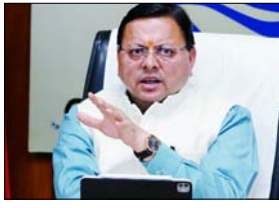
आबादी और वाहनों की वृद्धि के दृष्टिगत राज्य के अन्य शहरों के लिए भी सुनियोजित प्लान पर कार्य किया जाए

शाह टाइम्स ब्यूरो देहरादून। मुख्यमंत्री पुष्कर सिंह धामी ने सोमवार को सचिवालय में देहरादून एलिवेटेड कॉरिडोर का बेटक के दौरान अधिकारियों को निर्देश दिए कि रिस्पना और बिंदाल कॉरिडोर का कार्य जल्द शुरू किया जाए। देहरादून एलिवेटेड कॉरिडोर को एक्सप्रेसवे से जोड़ते हुए केंद्र से सहयोग का अनुरोध करने और स्टेड सेक्टर से शीघ्र कार्य शुरू करने के निर्देश मुख्यमंत्री ने अधिकारियों को दिए हैं। देहरादून में आबादी और वाहनों की संख्या में तेजी से हो रही वृद्धि, पर्यटकों की संख्या में हो रही वृद्धि और दिल्ली-देहरादून एक्सप्रेसवे के बनने के बाद यातायात में संभावित वृद्धि के दृष्टिगत मुख्यमंत्री ने देहरादून एलिवेटेड कॉरिडोर का कार्य जल्द शुरू करने के निर्देश दिए हैं। रिस्पना नदी के तल पर 11 किलोमीटर और बिंदाल नदी के तल पर