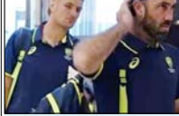
ऑटोड्राइव टीएम चैपिंग ट्रॉपी के लिए पाकिस्तान पहुंची विस्तृत खबर खेल टाइम्स पर