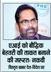
एआई को बौद्धिक बेहदरी की ताकत बनाने की जरूरत: नकवी

नई दिल्ली, मुजफ्फरनगर, देहरादून, हल्द्वारी, मुरादाबाद, बरेली, मेरठ व लखनऊ से प्रकाशित