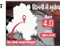
दिल्ली में मूकंप की तीव्रता चार मापी गई

भूकंप की तीव्रता चार मापी गई और भूकंप का केंद्र राष्ट्रीय राजधानी में जमीनी सतह से पांच किलोमीटर नीचे स्थित था। दिल्ली के अलावा फरीदाबाद, गुरुग्राम, रोहतक, गाजियाबाद, नोएडा और उसके आसपास के क्षेत्रों में भूकंप के झटके महसूस किए गए। भूकंप के तेज झटकों के कारण घरों के छत के पंखे तेजी से हिलने लगे और घरों में रखे बर्तन खड़कने लगे। भय के मारे लोग अपने घरों से बाहर निकल आए। एनसीएस के मुताबिक भूकंप की तीव्रता रिक्टर पैमाने पर 4.0 मापी गई। भूकंप का केंद्र 28.59 डिग्री उत्तर अक्षांश और 77.16 डिग्री पूर्वी देशांतर, जमीनी सतह से पांच किलोमीटर की गहराई पर स्थित था। कई साल के बाद भूकंप का केंद्र दिल्ली रहा। इसकी वजह से यहां लोगों को झटके काफ़ी देर तक महसूस हुए। दिल्ली पुलिस ने किसी