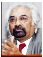
सैम पित्रोदा अध्यक्ष, इंडियन ओवरसीज कांग्रेस

भारत को चीन को अपना दुश्मन मानना बंद कर देना चाहिए, चीन से खतरे को अक्सर बढ़ा-चढ़ाकर पेश किया जाता है, चीन को दुश्मन मानने के बजाय उसे सम्मान देना चाहिए, मुझे समझ ही नहीं आता कि भारत को चीन से क्या खतरा है, हम सभी को साथ आकर काम करना चाहिए, भारत को चीन के प्रति अपने नजरिए को बदलने की जरूरत है, हमारा रवैया पहले दिन से ही टकराव का रहा है। यह दुश्मनी पैदा करता है। मुझे लगता है कि हमें इस पैटर्न को बदलने की जरूरत है। यह किसी के लिए भी ठीक नहीं है, अब सभी देशों को एक साथ आने का समय है, हमें सीखने, संवाद बढ़ाने, सहयोग करने और मिलकर काम करने की जरूरत है, हमें कमांड और कंट्रोल की मानसिकता से बाहर निकलना होगा। चीन चारों ओर है, चीन बढ़ रहा है, हमें इसे पहचानना और समझना होगा।