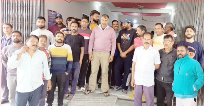
लोग सफाई में न लगाकर कार्यालय में लगा रखे हैं। इसके अलावा कुछ लोग पालिका आते ही नहीं उनके नाम से सिर्फ पैसा निकाला जा रहा है।

शाह टाइम्स संवाददाता नहटौर। नगर पालिका में स्थाई व संविदा और आउटसोर्सिंग कर्मचारियों की सूची सार्वजनिक नहीं करने पर सफाई कर्मचारियों ने पालिका के गेट पर बुधवार को नारेबाजी करते हुए सूची उपलब्ध कराने की मांग की। आरोप है कि कुछ लोगों के नाम आउटसोर्सिंग कर्मचारियों के रूप में दर्ज हैं। वह पालिका में आते ही नहीं उनके नाम से पैसा निकाला जा रहा है।