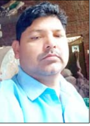
मृतक पिता-पुत्र के फाइल फोटो

शाह टाइम्स ब्यूरो मुरादाबाद। डिडीली थाना क्षेत्र में एक भीषण सड़क हादसा हुआ। नेशनल हाईवे पर गांव