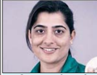
पाकिस्तान की हार के लिए चरणकर्ता जिम्मेदार: सना मीर विस्तृत खबर देय-दियेदा पर

कांग्रेस सांसद शशि थरूर ने पीयूष गोयल के साथ फोटो शेयर की नई दिल्ली। कांग्रेस सांसद शशि थरूर ने आजपा नेता और केंद्रीय मंत्री पीयूष गोयल के साथ की फोटो शेयर की। तस्वीर में उनके साथ ब्रिटेन के ट्रेड सेक्रेटरी जोनाथन रेनाल्ड्स भी नजर आ रहे हैं। शशि को ये पोस्ट तब सामने आई है, जब उनके और कांग्रेस पार्टी के रिश्तों में खटास की खबरें हैं। थरूर ने फोटो कैप्शन में लिखा कि ब्रिटेन के बिजनेस और ट्रेड स्टेट सेक्रेटरी जोनाथन रेनाल्ड्स के साथ उनके भारतीय समकक्ष वारिण्ज और उद्योग मंत्री पीयूष गोयल की मौजूदगी में बातचीत करके अच्छा लगा। लंबे समय से रुकी हुई पी ट्रेड एग्रीमेंट (एफटीए) वार्ता फिर से शुरू हो गई है, जो बहुत स्वागत योग्य है। दरअसल, 23 फरवरी को ही शशि ने कहा था कि मैं कांग्रेस में हूँ, लेकिन अगर पार्टी को मेरी जरूरत नहीं है, तो मेरे पास भी विकल्प मौजूद हैं। हालांकि थरूर ने पार्टी बदलने की अफवाहों का खंडन करते हुए कहा था कि भले ही विचारों में अंतर हो, लेकिन वह ऐसा नहीं मानते।