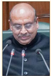
आतिशी सहित 'आप' के 12 विधायक दिनभर के लिए निलंबित

नई दिल्ली। दिल्ली की मुख्यमंत्री रेखा गुला ने मंगलवार को विधानसभा में नियंत्रक एवं महालेखा परीक्षक (केग) की रिपोर्ट सदन के पटल पर रखी, जिसमें दिल्ली की आम आदमी पार्टी सरकार के कार्यकाल की विवादास्पद आबकारी नीति के बारे में विभिन्न अनियमितताओं को रेखांकित करते हुए कठोर टिप्पणियां की गई हैं।