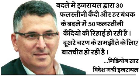
बदले में इजरायल द्वारा 30 फलस्तीनी कैदी और हर बंधक के बदले में 50 फलस्तीनी कैदियों की रिहाई हो रही है। दूसरे चरण के समझौते के लिए बातचीत हो रही है।