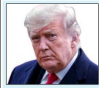
ट्रम्प ने चार भारतीय कंपनियों पर लगाया प्रतिबंध विस्तृत खबर देय-दियेदा पर

नई दिल्ली, मुजफ्फरनगर, देहरादून, हल्द्वानी, मुरादाबाद, बरेली, मेरठ व लखनऊ से प्रकाशित