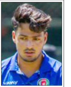
एमआई ने एएम गजनफर को दो करांच रूपसे में खरीदा था

मुंबई, वार्ता। अफगानिस्तान के ऑफ स्पिन गेंदबाज एएम गजनफर चोट के कारण इंडियन प्रीमियर लीग (आईपीएल) 2025 से बाहर हो गए हैं। मुंबई इंडियंस (एमआई) ने गजनफर को करांच रूपसे में खरीदा था। आईपीएल में अब उनकी जगह हमबतन ऑफ स्पिनर मुजीब-उर-रहमान को टीम में जगह दी है। मुजीब इससे पहले पंजाब किंग्स (पीबीकेएस) के लिए टीम और सनराइजर्स हैदराबाद के लिए आईपीएल एक सीजन में खेल चुके हैं और उनके नाम 19 आईपीएल मैचों में 19 विकेट हैं। वह आईपीएल में चार साल बाद खेलेंगे। आईपीएल 2018 पीबीकेएस को और से खेलेते हुए 11 मैचों में मात्र 6.99 की इकॉनमी से रन देते हुए 20.64 की औसत और 17.7 के स्ट्राइक रेट से 14 विकेट लिए थे। हालांकि 2021 में एसआरएच के लिए उन्हें पूरे सत्र में एक मैच में मौका मिला और उन्होंने