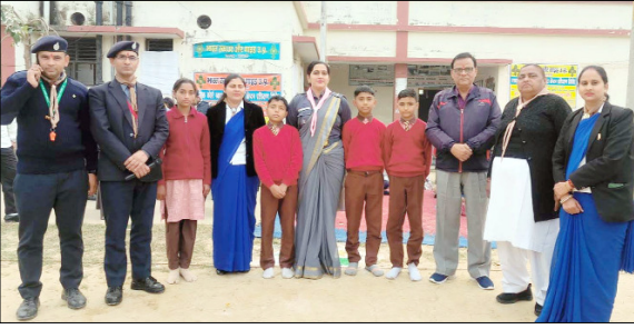
शामली। प्रशिक्षण शिविर में ग्रुप फोटो खिंचवाते हुए व बनाया गया सुंदर तबू।