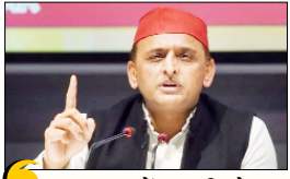
महा हादसों पर अखिलेश यादव ने बताया भाजपा की क्रोनोर्लॉजी खुद का प्रचार और चुनावी फायदे में लगी है सरकार

पोस्ट की शुरुआत में उन्होंने कहा कि भाजपा राज्य में महा-आयोजनों से संबंधित हाद, सों और भाजपाइयों की युटिपूर्ण नीतियों और उसके अंतर्निहित कारणों को क्रोनोर्लॉजी। इसके बाद अखिलेश ने एक-एक करके महाकुंभ के आयोजन पर सरकार को घेरा और कहा कि सरकार ने ये सब अपने प्रचार और चुनावी फायदे के लिए किया है। उन्होंने कहा कि सबसे पहले किसी भी महा-आयोजन को राजनीतिक दृष्टि से देखना और उसे अपने आत्म प्रचार व चुनावी