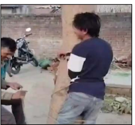
हसनपुर। चोरी में शक में पकड़े गये युवक को पेड़ से बांधकर पीटते लोग।