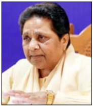
सुश्री मायावती बसपा अध्यक्ष

बसपा का उत्तराधिकारी वही बनेगा, जो पार्टी व मूवमेंट को आगे बढ़ाने में पूरे जी-जान से लगातार लगे रहे, बसपा के लिए देश में बाबा साहेब भीमराव अम्बेडकर के मानवतावादी आत्म-सम्मान व स्वाभिमान के कारवां को सत्ता तक पहुंचाने हेतु, मान्यवर श्री काशीराम जी द्वारा सब कुछ त्यागकर स्थापित की गई पार्टी व मूवमेंट, जिसमें स्वार्थ, रिश्ते-नाते आदि महत्वहीन अर्थात् बहुजन-हित सर्वोपरि है, इसी क्रम में श्री काशीराम को शिष्या व उत्तराधिकारी होने के नाते उनके पदचिह्नों पर चलते हुए मैं भी अपनी आस्थिरी सांस तक हर कुर्बानी देकर संघर्ष जारी रखूँगी, ताकि बहुजन समाज के लोग राजनीतिक गुलामी व सामाजिक लाचारी के जीवन से मुक्त होकर अपने पैरों पर खड़े हो सकें।