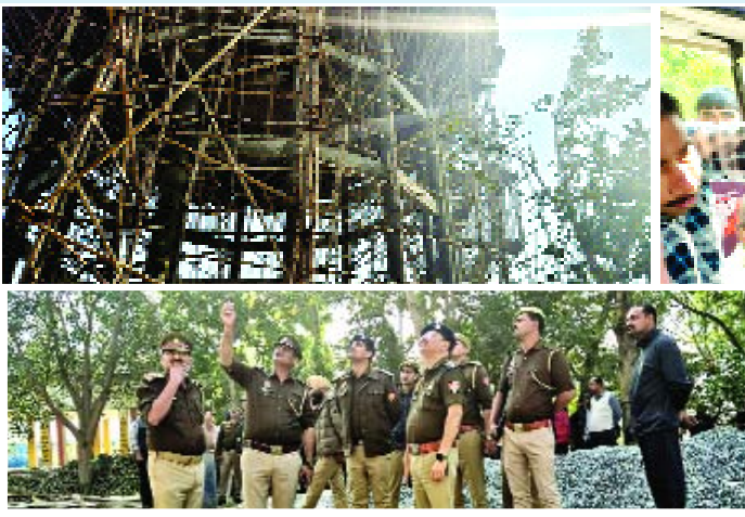
सामने आई है। मजदूरों के पास न तो सेफ्टी बेल्ट थी और न ही हेलमेट। सुरक्षा मानकों की अनेकही के कारण यह हादसा हुआ हादसे की गंभीरता को देखते हुए प्रशासन ने मामले की जांच के आदेश दे दिए हैं। टेकेदार के खिलाफ कार्रवाई की संभावना जताई जा रही है।