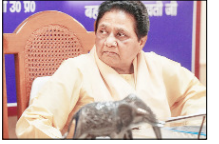
बसपा का उत्तराधिकारी वही, जो पार्टी को बढ़ाने में जी-जान से लगा रहे