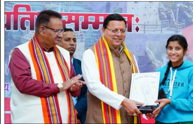
देहरादून: मुख्यमंत्री पुष्कर सिंह धामी मुख्य सेवक सदन में छात्रा को सम्मानित करते हुए।

प्रयागराज में महाकुंभ के लिए विशेष ट्रेनों में सवार होने के लिए स्टेशन पर आने वाले यात्रियों की भारी