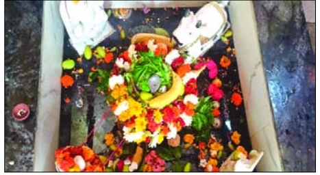
शाह टाइम्स संवाददाता गंगानगर। महाशिवरात्रि का

पर्व बुधवार को बहुत ही हर्षोल्लास एवं उत्साह के साथ मनाया गया। बुधवार की सुबह से ही शिवालयों में श्रद्धालुओं की लंबी कतारें देखी गईं जहां भक्ति में डूबे भक्त विजल जल का लोटा लिए जलाभिषेक के लिए अपनी बारी का इंतजार करते हुए नजर आए। इस अवसर पर हर हर महादेव के जयकारों से शिवालयों की गुंज दूर-दूर तक सुनाई दे रही थी और सारा वातावरण शिव की भक्ति में रंगा नजर आ रहा था। शिव भक्त