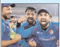
अफगानिस्तान सेमीफाइनल में पहुंचने के इरादे से उदतेगा विस्तृत खबर देख-टाइम्स पर

इलाहाबाद हाईकोर्ट में भारतीय पुरातत्व सर्वेक्षण (एएसआई) ने कहा है कि संरक्षित स्थल होने के कारण वह सम्भल स्थित जामा मस्जिद में रंगाई-पुताई की अनुमति नहीं दे सकता है। कोर्ट ने इस संबंध में अब एएसआई से रिपोर्ट मांगी है। वेसे कोर्ट ने कहा कि तीन सदस्यीय कमेटी की गिरफ्तारी में रंगाई-पुताई हो सकती है। इसके लिए कोर्ट ने एएसआई और वैज्ञानिक के अलावा प्रशासन के एक अधिकारी को तीन सदस्यीय कमेटी बनाने को कहा है। तीन सदस्यीय कमेटी मस्जिद परिसर का निरीक्षण करेगी और यह तय करेगी कि किसी स्ट्रक्चर को नुकसान पहुंचाए बिना रंगाई-पुताई कैसे की जाए। एएसआई तीन सदस्यीय कमेटी की रिपोर्ट शुरुवार को प्रस्तुत करेगी। इस रिपोर्ट के आधार पर कोर्ट शुरुवार को यह तय करेगा कि कैसे बिना ढांचे को नुकसान पहुंचाए रंगाई-पुताई होगी। वेसे मंदिर पक्ष और एएसआई की तरफ से जामा मस्जिद की प्रबंध समिति की याचिका का विरोध किया गया। प्रबंध समिति ने रमजान का महौना शुरू होने से पहले रंगाई-पुताई व मरम्मत की अनुमति मांगी थी। इसे एएसआई ने खारिज कर दिया था। इससे पहले जामा मस्जिद में रंगाई