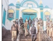
जामा मस्जिद का सर्वे करके पड़ोसी ASI की टीम सम्भल। उच्च न्यायालय के आदेश पर भारतीय पुरातत्व सर्वेक्षण (एएसआई) की टीम गुरुवार को जामा मस्जिद की पुताई और सजावट का सर्वे करने के लिए पड़ोसी टीम ने मस्जिद की वास्तविकता का आकलन किया। इसके बाद तैयार रिपोर्ट न्यायालय में पेश की जाएगी। मौलतकव है कि जामा मस्जिद में हाल ही में हुई रंगाई-पुताई और सजावट को लेकर विवाद खड़ा हुआ था। इसके बाद मामला उच्च न्यायालय पहुंचा। न्यायालय ने इस पर संज्ञान लेते हुए एएसआई को जांच के निर्देश दिए थे। एएसआई को टीम ने मस्जिद के हर हिस्से को बारीकी से जांच की। अब इसकी रिपोर्ट उच्च न्यायालय में पेश की जाएगी।

इलाहाबाद हाईकोर्ट में भारतीय पुरातत्व सर्वेक्षण (एएसआई) ने कहा है कि संरक्षित स्थल होने के कारण वह सम्भल स्थित जामा मस्जिद में रंगाई-पुताई की अनुमति नहीं दे सकता है। कोर्ट ने इस संबंध में अब एएसआई से रिपोर्ट मांगी है। वेसे कोर्ट ने कहा कि तीन सदस्यीय कमेटी की गिरफ्तारी में रंगाई-पुताई हो सकती है। इसके लिए कोर्ट ने एएसआई और वैज्ञानिक के अलावा प्रशासन के एक अधिकारी को तीन सदस्यीय कमेटी बनाने को कहा है। तीन सदस्यीय कमेटी मस्जिद परिसर का निरीक्षण करेगी और यह तय करेगी कि किसी स्ट्रक्चर को नुकसान पहुंचाए बिना रंगाई-पुताई कैसे की जाए। एएसआई तीन सदस्यीय कमेटी की रिपोर्ट शुरुवार को प्रस्तुत करेगी। इस रिपोर्ट के आधार पर कोर्ट शुरुवार को यह तय करेगा कि कैसे बिना ढांचे को नुकसान पहुंचाए रंगाई-पुताई होगी। वेसे मंदिर पक्ष और एएसआई की तरफ से जामा मस्जिद की प्रबंध समिति की याचिका का विरोध किया गया। प्रबंध समिति ने रमजान का महौना शुरू होने से पहले रंगाई-पुताई व मरम्मत की अनुमति मांगी थी। इसे एएसआई ने खारिज कर दिया था। इससे पहले जामा मस्जिद में रंगाई