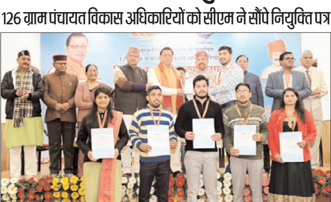
शाह टाइम्स ब्यूरो

126 ग्राम पंचायत विकास अधिकारियों को सीएम ने सौंपे नियुक्ति पत्र