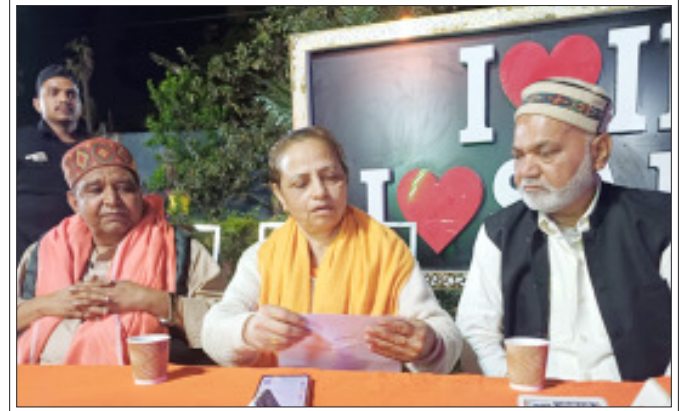
सम्भल-कुरेशी कोल्ड स्टोरेज में पत्रकारों से वार्ता करती राष्ट्रीय सदभावना मंच की संयोजिका।