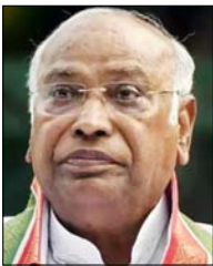
मल्लिकार्जुन खड्गे कांग्रेस अध्यक्ष

प्रधानमंत्री मोदी का विकसित भारत दृष्टिकोण आम लोगों की जेबें खाली कर रहा है और चुनिंदा अरबपतियों की तिजो. रियां भर रहा है, भारत एक वैश्विक कर युद्ध और व्यापार बाधाओं का सामना कर रहा है, सौ करोड़ भारतीयों के पास कोई अतिरिक्त आय नहीं है, केंद्रीय बजट में की गई घोषणाएं निराशाजनक साबित हुई हैं, हमारे सकल घरेलू उत्पाद (जीडीपी) का 60 फीसदी उपभोग पर निर्भर है। लेकिन भारत के केवल 10 फीसदी लोग आर्थिक विकास और उपभोग को बढ़ावा देते हैं और 90 फीसदी लोग बुनियादी दैनिक जरूरतों को पूरा करने में असमर्थ हैं, भारत को 50 फीसदी मध्य वर्गीय करदाताओं ने पिछले दशक में वेतन में वृद्धि नहीं देखी है। ग्रामीण मजदूरी नकारात्मक वृद्धि का सामना कर रहा है।