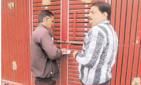
कार्रवाई की मांग को लेकर शिकायत की थी।

शाह टाइम्स संवाददाता नहरौली। नगर क्षेत्र में गुरुवार को एसीएमओ नोडल अधिकारी के नेतृत्व में स्वास्थ्य विभाग की टीम ने पांच अपंजीकृत अस्पतालों पर छापेमारी कर कार्रवाई करते हुए उनको ओटी सील कर दिया। स्वास्थ्य विभाग की कार्रवाई को लेकर हड़कंप मचा गया। कई अस्पताल संचालक अपना अस्पताल बंद करके भूमिगत हो गए।