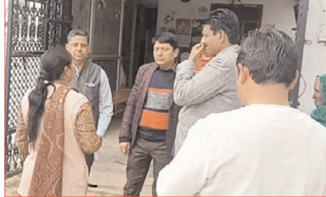
कार्रवाई के चलते अपंजीकृत अस्पताल संचालकों में हड़कंप मच गया और कई संचालक अपने अस्पतालों को बंद करके भूमिगत हो गए।