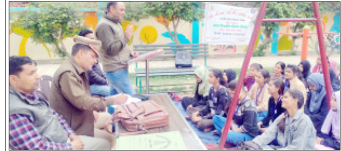
सम्भल-हल्लू सराय में रासेयो स्वयं सेवक व सेविकाओं को सन्धोधित करते उपनिरीक्षक।