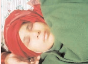
मौके पर मौजूद लोगों ने घटना में घायल सभी लोगों को सीएचसी अफजलगढ़ में भर्ती कराया गया। जहां प्राथमिक उपचार के बाद उन्हें घर भेज दिया गया।