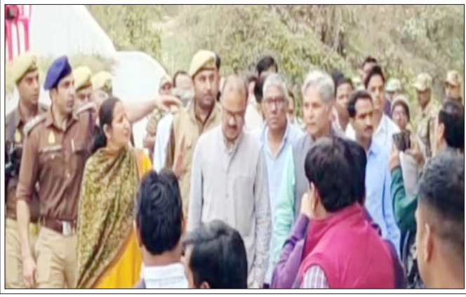
सम्भल-उच्च न्यायालय के आदेश पर जामा मस्जिद में रंगाई-पुताई का निरीक्षण करने जाती एएसआई की टीम।