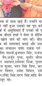
कौन से युवाओं को नशा-जुआ युवाओं व समाज के लिए बड़ा खतरा: एमपी देहात। नशा-जुआ युवाओं व समाज के लिए बड़ा खतरा: एमपी देहात।

शाह टाइम्स संवाददाता रुड़की। आवास विकास विधायकों ने नशा-जुआ युवाओं व समाज के लिए बड़ा खतरा: एमपी देहात। नशा-जुआ युवाओं व समाज के लिए बड़ा खतरा: एमपी देहात।