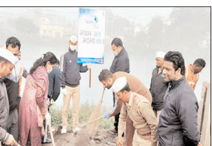
अभियान में अपने पहले दो चरणों में अभ्युत्थित सफलता प्राप्त की इसी प्रयास के साथ इस वर्ष तृतीय चरण की ओर आगे बढ़ाया जा रहा है।