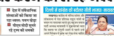
देश में संवैधानिक संस्थाओं को किया जा रहा खस्त: पवन खेड़ा