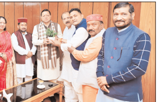
सौलत, मुहम्मद मंडल विकास निगम और वी प्रिन्स अरवि खन रोडवेज में विकास सत्र में शामिल हुए।