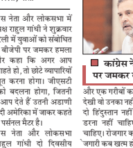
कांग्रेस नेता ने बीजेपी पर जमकर हमला हमला

इससे पहले राहुल गांधी ने शुक्रवार को पार्टी कार्यकर्ताओं से मुलाकात की। राहुल गांधी से पार्टी कार्यकर्ताओं को मुलाकात उनके संसदीय आवास पुरूपम में हुई।