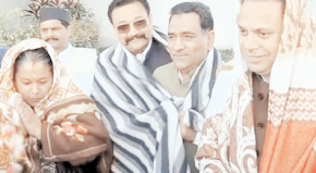
सौलत, मुहम्मद मंडल विकास निगम और वी प्रिन्स अरवि खन रोडवेज में विकास सत्र में शामिल हुए।