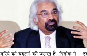
सैम पित्रोदा ने कहा कि चीन को अपना दुश्मन मानना बंद कर देना चाहिए

चीन भारत का दुश्मन नहीं: सैम पित्रोदा काहम करके साथ मिलकर काम करना चाहिए, कांग्रेस ने बयान से किया किनारा शाह टाइम्स ब्यूरो नई दिल्ली। इंडियन ओवरसीज कांग्रेस के अध्यक्ष और राहुल गांधी के करीबी सैम पित्रोदा ने कहा कि भारत को चीन को अपना दुश्मन मानना बंद कर देना चाहिए। चीन से खतरे को अस्सर बढ़ा-चढ़ाकर पेश किया जाता है। हालांकि कांग्रेस ने सैम पित्रोदा के बयान से किनारा कर लिया है। पार्टी महासचिव जयप्रकाश मेशरा ने कहा कि सैम पित्रोदा के चीन पर व्यक्त किए गए विचार कांग्रेस के विचार नहीं हैं। एक इंटरव्यू में सैम पित्रोदा ने कहा कि चीन को दुश्मन मानने के बजाय उसे सम्मान देना चाहिए। मुझे समझ ही नहीं आता कि भारत को चीन से क्या खतरा है। हम सभी को साथ आकर काम करना चाहिए। भारत को चीन के प्रति अपने नजरिये को बदलने की जरूरत है। पित्रोदा ने कहा कि हमारा रवैया पहले दिन से ही ठककराव का रहा है। यह दुश्मनी पैदा करता है। मुझे लगता है कि हमें इस पैटर्न को बदलने की जरूरत है। यह किसी के लिए भी ठीक नहीं है। पित्रोदा ने कहा कि अब सभी देशों को एक साथ आना ही समझ है। हमें सोचना, संवाद बढ़ाने, सहयोग करने और मिलकर काम करने की जरूरत है, हमें कमांड और कंट्रोल की मानसिकता से बाहर निकलना होगा। चीन चारों ओर है, चीन बढ़ रहा है, हमें इसे पहचानना और समझना होगा। दुनिया के सभी देश आगे बढ़ रहे हैं। कुछ तेजी से, कुछ धीमे। जो बहुत गरीब हैं, उन्हें तेजी से बढ़ना होगा और जो संपन्न हैं, उनकी वृद्धि धीमी होगी, जो विकास है, उनकी आबादी बुजुर्ग होगी, जबकि विकासशील देशों की आबादी युवा होगी।