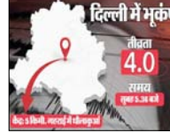
दिल्ली में भूकंप की तीव्रता चार मापी गई

रिक्टर पैमाने पर भूकंप की तीव्रता चार मापी गई मोदी का दिल्लीवासियों को शांत रहने का आग्रह नई दिल्ली। दिल्ली-एनसीआर में सोमवार सुबह भूकंप के तेज झटके महसूस किए गए। रिक्टर पैमाने पर भूकंप की तीव्रता चार मापी गई। राष्ट्रीय भूकंप विज्ञान केंद्र (एनसीएस) के अनुसार दिल्ली-एनसीआर में सोमवार सुबह पांच बजकर 36 मिनट पर भूकंप के तेज झटके महसूस किए गए। भूकंप की तीव्रता चार मापी गई और भूकंप का केंद्र राष्ट्रीय राजधानी में जमीनी सतह से पांच किलोमीटर नीचे स्थित था। दिल्ली के अलावा फरीदाबाद, गुरुग्राम, रोहतक, गाजियाबाद, नोएडा और उसके आसपास के क्षेत्रों में भूकंप के झटके महसूस किए गए। भूकंप के तेज झटकों के कारण घरों के छत के पंखे तेजी से हिलने लगे और घरों में रखे बर्तन खड़कने लगे। भय के मारे लोग अपने घरों से बाहर निकल आए। एनसीएस के मुताबिक भूकंप की तीव्रता रिक्टर पैमाने पर 4.0 मापी गई। भूकंप का केंद्र 28.59 डिग्री उत्तर अक्षांश और 77.16 डिग्री पूर्वी देशांतर, जमीनी सतह से पांच किलोमीटर की गहराई पर स्थित था। कोई साल के बाद भूकंप का केंद्र दिल्ली रहा। इसकी वजह से यहां लोगों को झटके काफ़ी देर तक महसूस हुए। दिल्ली पुलिस ने किसी भी तरह की त्रासना से सावधानी बरतने का आग्रह किया।