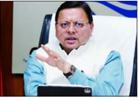
आबादी और वाहनों की वृद्धि के दृष्टिगत राज्य के अन्य शहरों के लिए भी सुनियोजित प्लान पर कार्य किया जाए

मुख्यमंत्री ने दिए निर्माण कार्यों में तेजी लाने के निर्देश शाह टाइम्स ब्यूरो देहरादून। मुख्यमंत्री पुष्कर सिंह धामी ने सोमवार को सचिवालय में देहरादून एलिवेटेड कॉरिडोर की बैठक के दौरान अधिकारियों को निर्देश दिए कि रिस्पना और बिंदाल कॉरिडोर का कार्य जल्द शुरू किया जाए। देहरादून एलिवेटेड कॉरिडोर को एक्सप्रेसवे से जोड़ते हुए केंद्र से सहयोग का अनुरोध करने और स्टेट सेक्टर से शोध कार्य शुरू करने के निर्देश मुख्यमंत्री ने अधिकारियों को दिए हैं। देहरादून में आबादी और वाहनों की संख्या में तेजी से हो रही वृद्धि, पर्यटकों की संख्या में हो रही वृद्धि और दिल्ली-देहरादून एक्सप्रेसवे के बनने के बाद यातायात में संभावित वृद्धि के दृष्टिगत मुख्यमंत्री ने देहरादून एलिवेटेड कॉरिडोर का कार्य जल्द शुरू करने के निर्देश दिए हैं। रिस्पना नदी के तल पर 11 किलोमीटर और बिंदाल नदी के तल पर