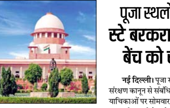
फिलहाल कुशीनगर मामले में आगे किसी भी तरह की तोड़फोड़ कार्रवाई पर रोक लगा दी गई

कोर्ट ने 13 नवम्बर 2024 के आदेश को उल्लंघन को लेकर योगी सरकार को भेजा नोटिस शाह टाइम्स ब्यूरो नई दिल्ली। सुप्रीम कोर्ट ने उत्तर प्रदेश सरकार को नोटिस जारी किया है। इस नोटिस में सुप्रीम कोर्ट ने पूछा है कि उत्तर प्रदेश सरकार ने कुशीनगर मस्जिद में तोड़फोड़ करके उनके 13 नवम्बर 2024 के आदेश का उल्लंघन किया है। 13 नवम्बर 2024 को दिए आदेश में सुप्रीम कोर्ट ने बिना पूर्व नोटिस और दूसरे पक्ष को सुने बिना तोड़फोड़ कार्रवाई पर रोक लगा दी थी। सुप्रीम कोर्ट ने फिलहाल कुशीनगर मामले में आगे किसी भी तरह की तोड़फोड़ कार्रवाई पर रोक लगा दी है। जस्टिस बीआर गवई और जस्टिस एजी मसोद की पीठ ने उत्तर प्रदेश सरकार को कारण बताओ नोटिस जारी करते हुए पूछा कि क्यों न संबंधित अधिकारियों को खिलाफ अदालत की अवमानना करने के लिए कार्रवाई की जाए? सुप्रीम कोर्ट ने याचिका पर आदेश पारित करते हुए कुशीनगर मामले में आगे किसी भी तरह की तोड़फोड़ कार्रवाई पर रोक लगा दी है। गौरतलब है कि कुशीनगर जिले में प्रशासन ने मदन मस्जिद के