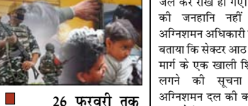
26 फरवरी तक काउंटर से प्लेटफार्म टिकट बंद, 60 स्टेशनों पर होल्डिंग एरिया बनाने की तैयारी

नई दिल्ली। नई दिल्ली रेलवे स्टेशन पर सेंट्रल रिजर्व पुलिस फोर्स (सीआरपीएफ) और दिल्ली पुलिस की तैनाती की गई है। महाकुंभ के बीच बढ़ती भीड़ को कंट्रोल करने के लिए केंद्र सरकार ने यह फैसला लिया है। इसके अलावा रेलवे ने 26 फरवरी तक शाम 4 बजे से रात 11 बजे तक काउंटर से प्लेटफार्म टिकट की बिक्री बंद कर दी है। सूत्रों के मुताबिक रेलवे ने भविष्य में पीक सीजन में भागड़ जैसी घटनाओं से बचने के लिए देश के 60 बड़े स्टेशनों पर होल्डिंग एरिया बनाने की योजना बनाई है। महाकुंभ के बाद 2027 में नासिक और हरिद्वार में