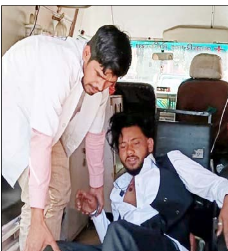
मुजफ्फरनगर: एंबुलेंस में घायल को ले जाते स्वास्थ्यकर्मी।

करे कि वाहन पार्किंग कहाँ होगी। एसपी यातायात अतुल चौबे ने पत्र में कहा कि काफी समय से बैंकवट हॉल, होटल, रेस्टोरेंट व कोचिंग सेंटरों पर पार्किंग की व्यवस्था नहीं है जिससे यहाँ आने वाले लोग वाहनों को ठीक ढंग से नहीं लगाते जिससे जाम की स्थिति लगातार बढ़ रही है। इतना ही नहीं जनपद में दुर्घटनाएँ भी बढ़ रही हैं। उन्होंने कहा कि यदि वाहन गलत खड़े मिले तो संचालकों पर कार्यवाही होगी। उन्होंने कहा कि सभी संस्थान के संचालक अपनी जिम्मेदारी सुनिश्चित करें और संस्थानों के पास पार्किंग की व्यवस्था होनी चाहिए।