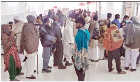
शामली। अस्पताल में खड़े मरीज।

शाह टाइम्स संवाददाता शामली। मौसम में परिवर्तन होने से बीमारियों भी फैलने लगी हैं। मंगलवार को जिला संयुक्त चिकित्सालय में मरीजों की संख्या बढ़ गई और चिकित्सकों के कक्षाओं के बाहर मरीजों की लंबी लंबी लाईनें लगी रही। मरीजों को दवा लेने के लिए कई घंटे प्रतीक्षा करनी पड़ी। पिछले कुछ दिनों से मौसम में लगातार परिवर्तन हो रहा है। सुबह शाम की ठंड होने और दिन में गर्मी का अहसास होने से इसका असर लोगों के स्वास्थ्य पर पड़ने लगा है। जिस कारण अस्पतालों में मरीजों की संख्या भी बढ़ गई है। मंगलवार को जिला संयुक्त चिकित्सालय में मरीजों की लंबी लंबी लाईनें लगी रही। चिकित्सकों के कक्षाओं के बाहर मरीजों की भीड़ रही, जिसमें खासी, नजला