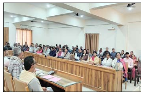
शाहली। बैठक में मौजूद अधीनस्थ अधिकारी।

जी द्वारा बोर्ड परीक्षाओं को लेकर जिलाधिकारी को अवगत कराया गया कि हाईस्कूल इंटरमीडिएट की लिखित परीक्षाएं जनपद में निर्धारित 35 परीक्षा केंद्रों पर दो पालियों में प्रथम पाली 8:30 से 11:45 व द्वितीय पाली 2:00 बजे से 5:15 बजे तक दिनांक 24-02-2025 से 12-03-2025 के मध्य संपन्न होगी जिसमें हाईस्कूल को 12265 छात्रछात्राएं तथा इंटरमीडिएट को 12123 छात्र छात्राएं दोनों परीक्षा में