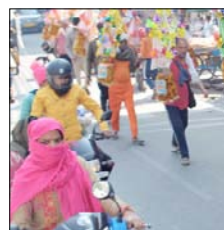
शामली। कांठल लेकर जाते शिवभक्त।

मंगलवार को हरियाणा के जौंद निवासी 25 शिवभक्तों की टोली शामली से होकर गुजरी, जो हरिद्वार से पवित्र गंगजल लेकर अपने शिवालयों की ओर बढ़ते जा रहे हैं।