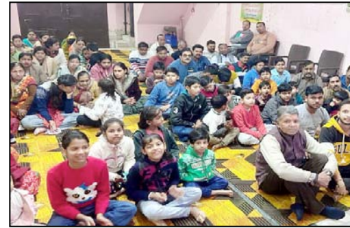
शाह टाइम्स संवाददाता रामपुर मनिहारपुर। जैन जगत के सर्वश्रेष्ठ मुनि संत शिरोमणि आचार्य श्री 108 विद्यासागर महामु. निराज का प्रथम समाधि दिवस आयोजित विनयांजलि सभा में नमो कार महामंत्र पाठ के साथ मनाया गया। कस्बे में स्थित त्यागी भवन में जैन समाज की ओर से विनयांजलि सभा का आयोजन किया गया जिसमें बतौर आचार्य श्री जैन समाज के सर्वोच्च जैन आचार्य श्री 108 विद्यासागर जी महाराज का जन्म आज से 79 वर्ष पूर्व कर्नाटक राज्य के

सरलगा ग्राम में शरद पूर्णिमा के दिन बालक विद्याधर के रूप में हुआ था। उन्होंने अपने जीवन में ऐसी साधना की जो वर्तमान समय में कर पाना असम्भव है। उन्होंने देश व समाज के कल्याण के लिए हथकरघा, पूर्ण आयु, प्रतिभा स्थली, पूरी मैत्री, गोशाला आदि अनेकों योजनाएं चलाई जो आज भी अनेकों लोगों की आजीविका का साधन बनी हुई है। प्रातः मंदिर में श्री जी का अभिषेक कर पूजन प्रक्षाल और शांतिधारा की गई। इसके बाद आचार्य श्री विद्यासागर जी महाराज की पूजा की गई। शाम को जैन त्यागी आचार्य श्री जी की आरती कर महामंत्र का पाठ किया गया। आचार्य श्री जन जन के