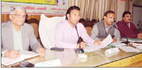
शामली बैठक में निर्देश देते डीएम।