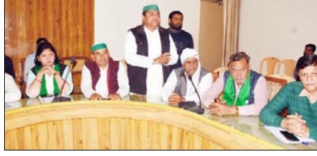
शामली। अपनी मांग रखते भाकियू कार्यकर्ता।

अवसर पर जिलाधिकारी ने पूर्व किसान दिवस में प्राप्त समस्या निस्तारण की समीक्षा की और शिकायतों में निस्तारण नहीं हुआ उनमें निस्तारण के निर्देश दिए। किसान दिवस में किसानों द्वारा मुख्य रूप से विद्युत विभाग, जल निगम, गन्ना भुगतान, निराश्रित पशु, शहर में नाले की सफाई, भूमि, रास्ते संबंधी, शुगर मिल शामली से छाई निकले, पॉलिथीन पर कार्रवाई, बंधेव ओरो गौहरनी जंक्शन पर सुरक्षा व्यवस्था,