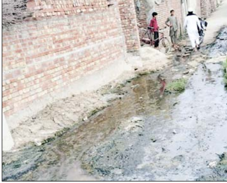
चौसाना। गंदगी से अटी पड़ी गली।

शाह टाइम्स संवाददाता चौसाना। चौसाना गांव की गलियां गंदगी और कीचड़ से भरी पड़ी हैं, जिससे ग्रामीणों का जीवन दुःख हो गया है। जगह-जगह बहते गंदे पानी और सड़कों पर जमी कीचड़ ने गांव के लोगों को नरकीय हालात में रहने पर मजबूर कर दिया है। यह हाल गांव के बिजलीघर के पीछे स्थित साबिर के घर के पास का है, लेकिन केवल यही जगह नहीं, बल्कि चौसाना की लगभग सभी गलियां इसी बदहाली की शिकार हैं।