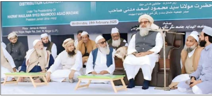
भविष्य समाज है। इस अवसर पर 45 छात्राओं के आलिमा बनने के साथ हाई स्कूल करने पर उन्हें प्रमाण पत्र, ट्राफी व किताबें देकर सम्मानित किया गया। इससे पूर्व जमीयत उलेमा ए हिन्द