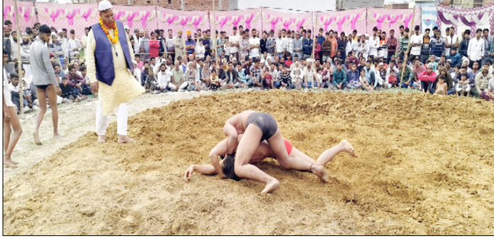
झिंझाना। दंगल में कुस्ती लड़ते पहलवान।