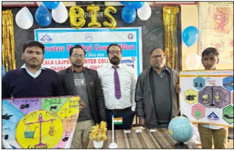
थानाभवना। स्लोगन प्रति. में विजयी प्रतिभागी।

शाह टाइम्स संवाददाता थानाभवना। लाला लाजपत राय इंटर कॉलेज थाना भवना में भारत मानक ब्यूरो द्वारा एक पोस्टर बनाने एवम स्लोगन प्रतियोगिता का आयोजन किया गया जिसमें कक्षा 9 से कक्षा 12 तक के विज्ञान वर्ग के लगभग 35 छात्रों ने जो की भारत मानक ब्यूरो में सम्मिलित हैं भाग लिया।