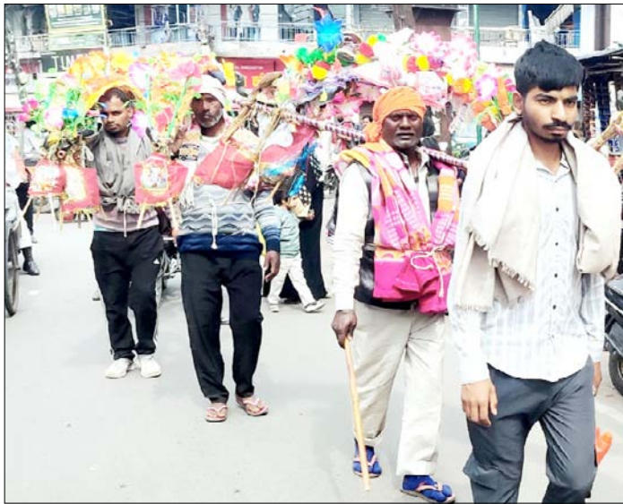
मुजफ्फरनगर: बम-बम भोले जयघोष के साथ गुजरते शिवभक्त।

अवस्था में एक व्यक्ति जिसकी उम्र 55 वर्ष है, मिला था। घायल को जिला अस्पताल में भर्ती कराया गया था। पुलिस का कहना है कि अज्ञात वाहन की चपेट में आने से व्यक्ति घायल हुआ था और तभी से वह अस्पताल में भर्ती था। पुलिस उसकी पहचान कराने में लगी रही, लेकिन उसके पास से कोई भी ऐसी चीज नहीं मिली जिससे परिजनो को सूचना दी जा सके। शनिवार को घायल ने इलाज के दौरान दम तोड़ दिया। पुलिस ने शव का पोस्टमार्टम करा दिया है। पुलिस का कहना है कि मृतक की टांग टूटी हुई थी और शरीर पर भी निशान थे।