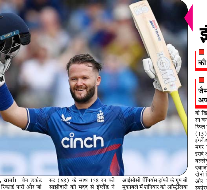
लाहौर, वार्ता। बेन डकेट (165) की रिकॉर्ड पारी और जो

क्रिकेट परिषद (आईसीसी) द्वारा आयोजित टूर्नामेंट में मैच से पहले दो प्रतिस्पर्धी टीमों के राष्ट्रगान बजाए जाते हैं। ऐसा टॉस के बाद होता है और फिर दोनों टीमों के खिलाड़ी एक दूसरे से हाथ मिलाते हैं। यह इस चैंपियंस ट्रॉफी में पहला विवाद नहीं है। इससे पहले भी आईसीसी सवालों के घेरे में आ चुका है। टूर्नामेंट शुरू होने से पहले इस बात पर सवाल उठे थे कि कराची के नेशनल स्टेडियम में भारतीय ध्वज को क्यों नहीं फहराया गया, जबकि अन्य सभी प्रतिस्पर्धी टीमों के झंडे लगे हुए थे। पाकिस्तान क्रिकेट बोर्ड (पीसीबी) से इस मुद्दे पर सवाल किए गए थे जिसके बाद स्पष्टीकरण दिया गया था कि भारतीय टीम यहां नहीं आएगी, इसलिए झंडा नहीं लगाया गया। हालांकि, बाद में पीसीबी ने भारतीय ध्वज को शामिल किया। वहीं, पाकिस्तान क्रिकेट बोर्ड (पीसीबी) ने चैंपियंस ट्रॉफी में भारत और बांग्लादेश के बीच गुरुवार को दुबई में खेले गए मैच को सौधे प्रसारण के दौरान दिखाए गए टूर्नामेंट के लोगो में देश का नाम न होने पर खेल की संचालन संस्था अंतर्राष्ट्रीय क्रिकेट परिषद (आईसीसी) के सामने अपनी नाराजगी व्यक्त की है।