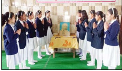
शाहली। सरस्वती शिक्षा विद्या मंदिर में दयानंद सरस्वती का स्मरण करती छात्राएं।

लेकर थाना अध्यक्ष को अवगत कराया गया है। इस मामले में भी थाना अध्यक्ष को अज्ञात में तहरीर दी गई है और जल्द उनकी गिरफ्तारी कर कार्यवाही करने की मांग की है। वही देखा जाए तो प्रतीक्षालय में लगी भीमराव अंबेडकर की तस्वीर को हटाए जाने की घटना और मानकपुर में लगे बोर्ड को लेकर हुआ विवाद, दोनों ही घटनाएं एक-दूसरे से महज 300 मीटर की दूरी पर घटित हुई हैं, जिसकी गहराई से जांच होना अति आवश्यक है। और वही प्रतीक्षालय के पास में ही एक खम्बे पर सांसद चंद्रशेखर का भी बैनर लगा हुआ था उसको भी वहां से हटाया गया है। सप्ताह के भीतर गद्दीपुख्ता थाना क्षेत्र में हुए ए मामले गद्दीपुख्ता थाना क्षेत्र में एक