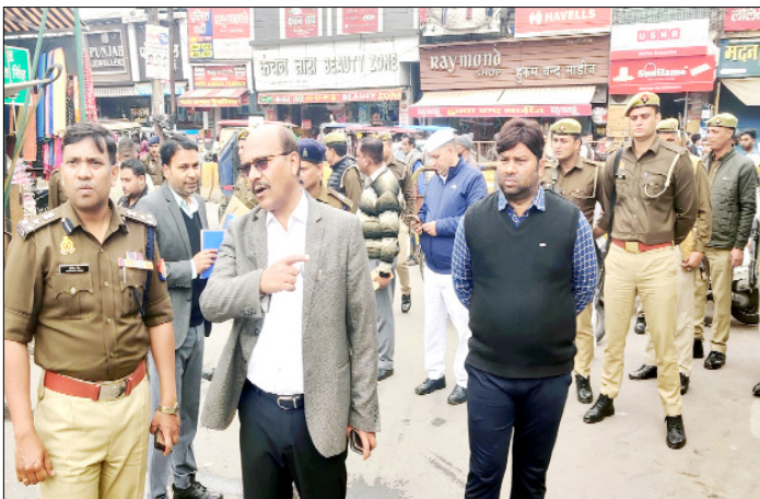
मुजफ्फरनगर: महाशिवरात्रि की तैयारियों का जायजा लेने निकले डीएम व एसएसपी।