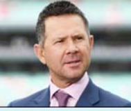
दुनिया के नंबर-1 बल्लेबाज बनने के हकदार है गिल: पोटिंग विस्तृत खबर देख टाइम्स पर