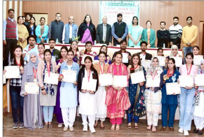
मुजफ्फरनगर: डीएवी डिग्री कॉलेज में पुरस्कृत छात्र-छात्राएं व मंचासीन अतिथिगण।