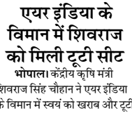
एयर इंडिया के विमान में शिवराज को मिली टूटी सीट भोपाल। केंद्रीय कृषि मंत्री शिवराज सिंह चौहान ने एयर इंडिया के विमान में स्वयं को खराब और टूटी सीट मिलने का खुलासा करते हुए सवाल किया कि क्या ये यात्रियों के साथ घुबला नहीं है और एयर इंडिया प्रबंधन इसे सुधारने की दिशा में कदम बढ़ाएगा या जल्दी पहचानने की यात्रियों को मजबूरी का फायदा उठाता रहेगा। श्री चौहान ने इस संबंध में एक्स पर पोस्ट करते हुए कहा कि शनिवार को उन्हें भोपाल से दिल्ली आना था। इसके लिए उन्होंने एयर इंडिया की फ्लाइट क्रमांक एआई 436 में टिकट करवाया था, जिसमें उन्हें सीट क्रमांक 8 सीट आवंटित हुई। बैठने पर पता चला कि ये सीट टूटी और अंदर धंसी हुई थी, जिस पर बैठा तकलीफदायक था। उन्होंने कहा कि खराब उड़ानों के विमानों की जांच करवाने की मांग की।