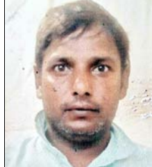
मृतक का फाइल फोटो व रोते बिलखते परिजन।