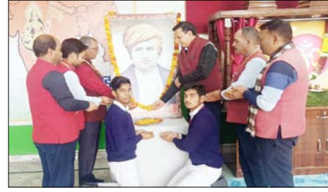
शाहली। सरस्वती शिक्षा मंदिर इंटर कॉलेज में दयानंद सरस्वती का स्मरण करते छात्र व अध्यापकगण।