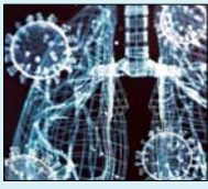
चीन ने कोरोना जैसा नया वायरस खोजा विस्तृत खबर देख-विदेश पर

विस्तृत खबरों के लिए QR कोड स्कैन करें। मुफ्त पढ़ें E-paper