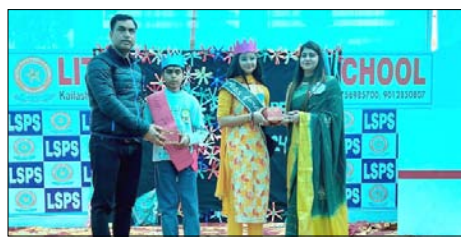
थानाभवना। फेयरवेल पार्टी में सम्मानित छात्र-छात्राएं।