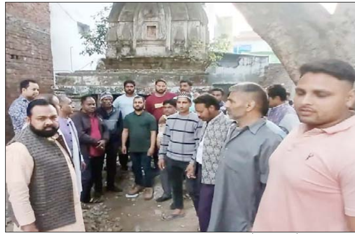
पदाधिकारी आपसी सहमति से ही निर्णय लेंगे। क्योंकि अब वहां समाज का कोई व्यक्ति नहीं रहता है। उन्होंने एसडीएम से बाहरी तत्वों से मंदिर के

शाह टाइम्स ब्यूरो देवबन्द। भागीरथी शिव मंदिर सेवा समिति ने उपजिलाधिकारी को दिए ज्ञापन में कहा है कि मोहल्ला बैरुन कोटला में सैनो समाज का निजि प्राचीन शिव मंदिर को लेकर कुछ बाहरी तत्व नगर का माहौल खराब करने के लिए विभिन्न प्रकार का हस्तक्षेप कर रहे हैं। जिन्हें रोका जाना आवश्यक है। उपजिलाधिकारी को दिए ज्ञापन में समाज के लोगों ने बताया कि मोहल्ला बैरुन कोटला में समाज के लोगों का मंदिर था। उक्त मोहल्ले से समाज के लोगों को चले जाने के बाद मंदिर से 15-20 वर्ष पूर्व सभी मूर्तियां हटाकर इंदिरा विहार कॉलोनी स्थित मंदिर स्थापित कर वहां मूर्तियां को विधिविधान के साथ स्थापित कर दिया था। जिसके चलते देखभाल न होने से अब बैरुन कोटला स्थित प्राचीन खाली मंदिर खंडहर के रूप में बदल गया है। ज्ञापन में बताया कि मंदिर परिसर को भूमि के संबंध में भागीरथी शिव मंदिर सेवा समिति के