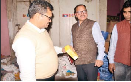
शामली। दुकान पर छापामारी करती टीम।

खाद्य सुरक्षा टीम ने सरवरपीर कालोनी में दुकानदार के यहां मारा छापा