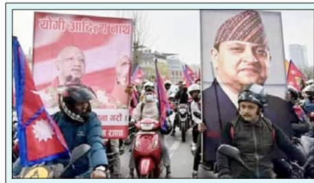
दूसरी तरफ जब राजा ज्ञानेंद्र शाह नेपाल पहुंचे, तो उनके समर्थकों के हाथ में उत्तर प्रदेश के मुख्यमंत्री योगी आदित्यनाथ की भी फोटो देखा गया। यह अपने आप में चौंकाने वाली बात है।

बंधकों की रिहाई की मांग को लेकर इजरायल का बड़ा एक्शन