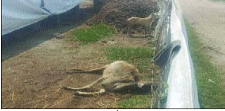
आतिफ निसार जैनु, शाह टाइम्स

सहस्रवान। बैरपुर मानपुर गांव की गौशाला की बद्दहाल स्थिति का वीडियो वायरल होने के बाद हड़कंप मच गया। ग्रामीणों ने बताया कि भूख और प्यास से गौशाला में गोवंश दम तोड़ रहे हैं। हालात इतने खराब हैं कि मृत गोवंश के शव गौशाला के पास सड़ रहे हैं, जिन्हें आवारा कुत्ते नोंच कर खा रहे हैं। ग्रामीणों का कहना है, की गौशाला में चारे और पानी की कोई व्यवस्था नहीं है। भूख से तड़प कर गोवंश एक-एक कर दम तोड़ रहे हैं। प्रशासन की लापरवाही का आलम यह है, कि मृत गोवंश को ना तो दफनाया जा रहा है, और ना ही हटाया जा रहा है। गौशाला के पास शव पड़े रहने से बदबू और गंदगी का आलम है। कुत्ते ने बड़ाई देरशात... ग्रामीणों ने बताया कि आवारा