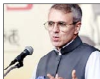
112 लाख का बजट पेश, गरीबों को मुफ्त बिजली मिलेगी

जम्मू-कश्मीर के मुख्यमंत्री उमर अब्दुल्ला ने शुक्रवार को यहां विधानसभा में केन्द्र शासित क्षेत्र का 2025-26 का 1.12 लाख करोड़ रुपये से अधिक का बजट पेश किया। श्री अब्दुल्ला के पास वित्त विभाग का भी दायित्व है। उन्होंने अपने बजट भाषण में कहा कि अगले वित्त वर्ष के बजट में कुल 1,12,310 करोड़ रुपये के व्यय का प्रावधान किया गया है।