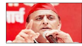
सपा मुखिया ने योगी सरकार से पूछा सवाल

लखनऊ: महाकुंभ के दौरान एक नाविक के 30 करोड़ की आमदनी होने के बयान पर निशाना साधते हुए समाजवादी पार्टी अध्यक्ष अखिलेश यादव ने शुक्रवार को कहा कि अगर सच में एक परिवार ने महाकुंभ में अकेले 30 करोड़ कमाए हैं, तो सरकार ये भी बताए कि जीएसटी कितना मिला।