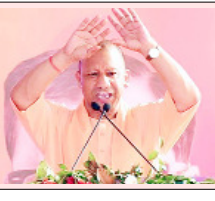
आधुनिकीकरण वाले शहरों में अयोध्या अलीगढ़, सहारनपुर मेरठ, मुगदाबाद, बरेली और फिरोजाबाद जिले भी शामिल

लखनऊ: योगी सरकार ने प्रदेश के विकास को नई दिशा देने के लिए जीआईएस (ज्योग्राफिकल इंफॉर्मेशन सिस्टम) बेस्ड महायोजना का खाका तैयार किया है। इसके तहत प्रदेश के 59 शहरों का उन्नत तकनीक और हाईटेक सुविधाओं से विकास किया जाएगा। सरकार के फंसले से प्रदेश के विभिन्न शहरों को शहरीकरण की सही दिशा मिलेगी और शहरों के बुनियादी ढांचे को और अधिक मजबूत किया जाएगा।