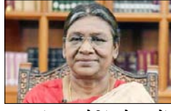
इंडक्शन ट्रेनिंग प्रोग्राम में मुर्मू ने किया आह्वान

राष्ट्रपति द्रौपदी मुर्मू ने अधिकारियों से गरीबों और वंचितों को ध्यान में रखकर नीति और कार्यक्रम लागू करने को कहा है। श्रीमती मुर्मू ने शुक्रवार को यहां लाल बहादूर शास्त्री राष्ट्रीय प्रशासन अकादमी में 12वें इंडक्शन ट्रेनिंग प्रोग्राम में भाग लेने वाले राज्य सिविल सेवा अधिकारियों से राष्ट्रपति भवन में मुलाकात की।