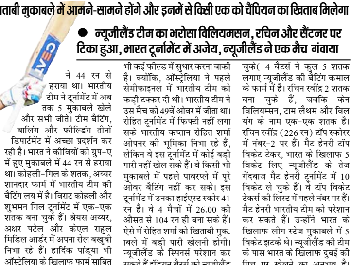
विराट को भारत-न्यूजीलैंड खिताबी मुकाबले में आमने-सामने होंगे और इनमें से किसी एक को चैंपियन का खिताब मिलेगा