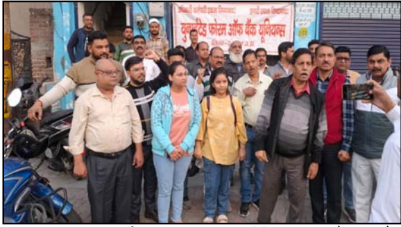
शाह टाइम्स ब्यूरो रामपुर। यूनाइटेड फॉर्म ऑफ बैंक के राष्ट्रीय आवाहन पर अपने आंदोलन में कार्यक्रम के अंतर्गत आज बैंक ऑफ इंडिया रामपुर पर जितने की समस्त शाखाओं के अधिकारी व