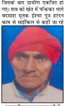
मृतक ईश्वर का फाइल फोटो

शाह टाइम्स संवाददाता बागपत। एक मजदूर की चाकू से गोदकर हत्या कर दी गई। हत्या से इलाके में सनसनी फैल गई। दो बाइक सवार बदमाशों ने मजदूर से पहले लूटपाट की फिर चाकू से गोदकर मार दिया। बदमाश शव को जंगल के खेत में फेंककर फरार हो गए। रास्ते से गुजर रहे राहगीरों शव को देखा जिसके बाद पुलिस को सूचना दी। सूचना पर पहुंची पुलिस जांच में जुट गई है। मृतक के बेटे ने आरोपियों पर कार्रवाई की मांग की है। पूरा मामला बसौदा गांव का है। बदमाशों ने मजदूर को मारकर शव को जंगल में फेंक दिया