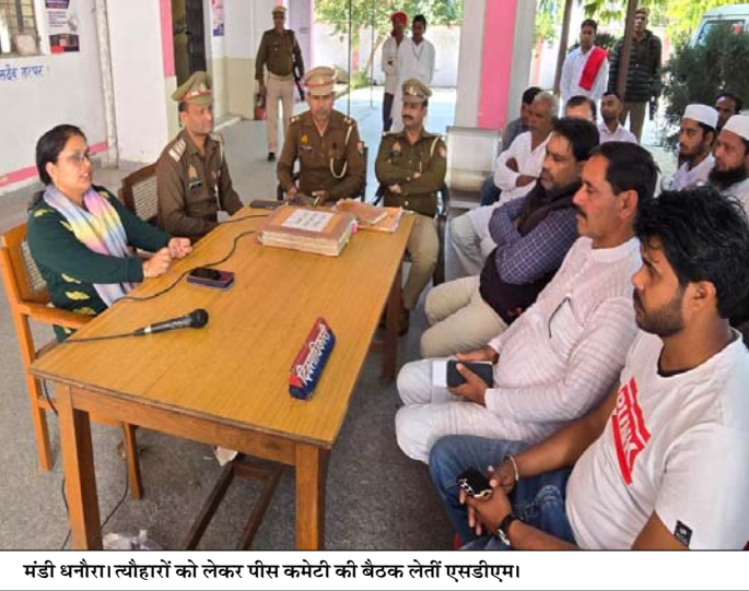
मंडी धनौरी। त्योहारों को लेकर पीस कमेटी की बैठक लेती एसडीएम।