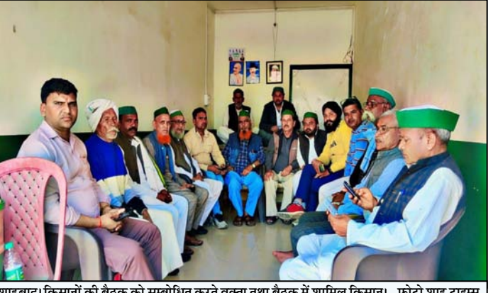
शाहबाद। किसानों की बैठक को सम्बोधित करते वक्ता तथा बैठक में शामिल किसान।

शाह टाइम्स संवाददाता शाहबाद/रामपुर। शनिवार को भारतीय किसान यूनियन टिकैत के क्षेत्रीय कार्यालय शाहबाद पर एक पंचायत का आयोजन किया गया। जिसमें बताया गया कि 9 तारीख को मासिक पंचायत होती है उस दिन रविवार की छुट्टी है इसलिए मासिक पंचायत 9 को न होकर 10 तारीख में होनी तय हुई है। सभी कार्यकर्ता व पदाधिकारी से अपील कि गई कि पंचायत में ज्यादा से ज्यादा संख्या में 10 मार्च को पीडब्ल्यूडी गेस्ट हाउस शाहबाद में आए। पंचायत में किसानों की विभिन्न समस्याओं पर लिखित शिकायतों जापन उपजिलाधिकारी को दिया जाएगा। और जो राष्ट्रीय प्रवक्ता चौधरी राकेश टिकैत के रामपुर में 24 मार्च को आगमन हो रहा है सभी पदाधिकारी को महा पंचायत की