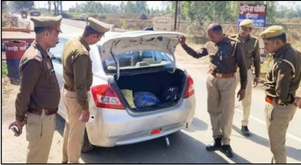
चालान के दौरान हेल्मेट लगाया जरूरी है। दुर्घटनाओं पर अंकुश लगाया जा सकता है। उन्होंने कहा कि जागरूकता से ही सड़क इसलिए सभी इस पर ध्यान दें।