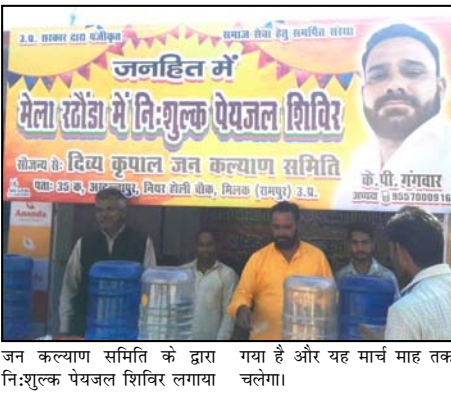
जल कल्याण समिति के द्वारा निःशुल्क पेयजल शिविर लगाया गया है और यह मार्च माह तक चलेगा।