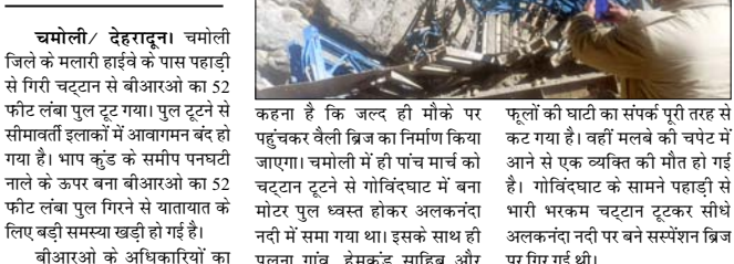
शाह टाइम्स संवाददाता

सीमावर्ती इलाकों में आवागमन हुआ बंद, वैली ब्रिज का निर्माण होगा