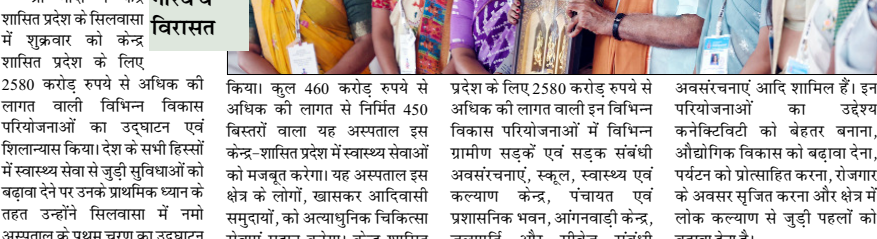
श्री मोदी ने केंद्र शासित प्रदेश के सिलवासा में शुक्रवार को केंद्र शासित प्रदेश के लिए 2580 करोड़ रुपये से अधिक की लागत वाले विभिन्न विकास परियोजनाओं का उद्घाटन एवं शिलान्यास किया। देश के सभी हिस्सों में स्वास्थ्य सेवा से जुड़ी सुविधाओं को बढ़ावा देने पर उनके प्राथमिक ध्यान के तहत उन्होंने सिलवासा में नमो अस्पताल के प्रथम चरण का उद्घाटन किया। कुल 460 करोड़ रुपये से अधिक की लागत से निर्मित 450 बिस्तरों वाला यह अस्पताल इस केंद्र-शासित प्रदेश में स्वास्थ्य सेवाओं को मजबूत करेगा। यह अस्पताल इस क्षेत्र के लोगों, खासकर आदिवासी समुदायों, को अत्याधुनिक चिकित्सा सेवाएं प्रदान करेगा। केंद्र शासित प्रदेश के लिए 2580 करोड़ रुपये से अधिक की लागत वाले इन विभिन्न विकास परियोजनाओं में विभिन्न ग्रामीण सड़कों एवं सड़क संबंधी अवसंरचनाएं, स्कूल, स्वास्थ्य एवं कल्याण केंद्र, पंचायत एवं प्रशासनिक भवन, आंगनवाड़ी केंद्र, जलापूर्ति और सीवेज संबंधी अवसंरचनाएं आदि शामिल हैं। इन परियोजनाओं का उद्देश्य कनेक्टिविटी को बेहतर बनाना, औद्योगिक विकास को बढ़ावा देना, पर्यटन को प्रोत्साहित करना, रोजगार के अवसर सृजित करना और क्षेत्र में लोक कल्याण से जुड़ी पहलों को बढ़ावा देना है।

सिलवासा। पीएम मोदी ने यहां केंद्र शासित प्रदेश दारदा एवं नगर हवेली और दमन एवं दीव के लिए 2580 करोड़ रुपये का विकास परियोजनाओं का उद्घाटन किया।