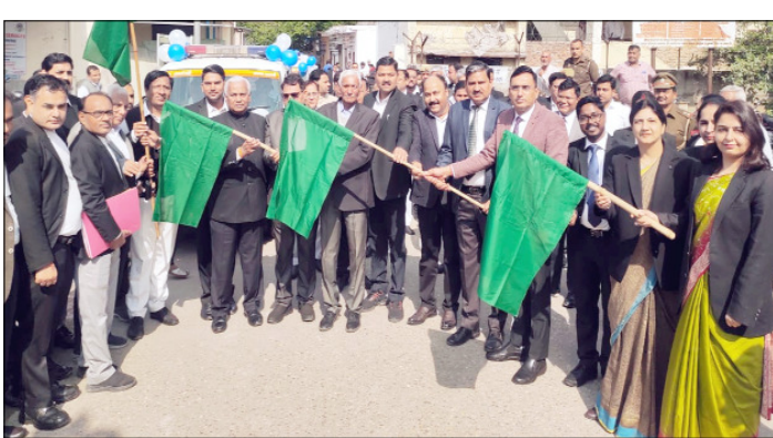
कि आगामी 8 मार्च को न्यायालय परिसर में राष्ट्रीय लोक अदालत का आयोजन किया जाना है, जिसके सफल आयोजन हेतु जागरूकता रैली निकाली गई है। जिससे राष्ट्रीय लोक अदालत में सम्मिलित होकर वादकारी

शाह टाइम्स संवाददाता कैरना। आगामी 8 मार्च को आयोजित होने वाली राष्ट्रीय लोक अदालत के प्रचार-प्रसार वाहनों व जागरूकता रैली को जनपद न्यायाधीश ने हरी झंडी दिखाकर रवाना किया। यह जागरूकता रैली पूरे जनपद में जाकर लोगों को लोक अदालत के आयोजन के प्रति जागरूक करेगी, जिससे ज्यादा से ज्यादा मामलों का निपटारा किया जा सके।