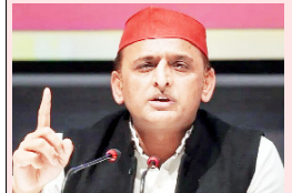
सरकार ने बिना जांच-पड़ताल के फर्जी कंपनियों से किया एमओयू जमीन पर दिखाई नहीं देता निवेश

भाजपा सरकार ने इन्वेस्टर समिट के नाम पर लाखों करोड़ निवेश का दावा किया, लेकिन जमीन पर कहीं निवेश नहीं दिखाई देता है। सरकार का झूठ का गुब्बारा अब हर दिन नए-नए रूप में दिखाई दे रहा है। सरकार बिना जांच पड़ताल के रिपोर्ट बनाकर जनता को धोखा मिला गया उसे बूलाकर एमओयू कर लिया। अब एमओयू को लेकर जो जानका. रिया आ रही है वह बेहद गंभीर है। सरकार की नीयत में उजागर करती है। प्रदेश के 75 जिलों में डाटा सेंट बनाने का जिम्मा लेने वाली ब्यू नाऊ मार्केटिंग सर्विसेज लिमिटेड और ब्यू नाऊ इंफ्राटेक सर्विसेज लिमिटेड को 11 करोड़ रुपये का एमओयू मिले। एमओयू की आड़ में मास्टर प्लान