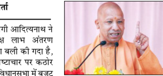
बेईमानी व भ्रष्टाचार पर कर रही है कठोर प्रहार

मुख्यमंत्री योगी आदित्यनाथ ने कहा कि प्रत्यक्ष लाभ अंतरण (डीबीटी) बजरंग बली की गदा है, जो बेईमानी व भ्रष्टाचार पर कठोर प्रहार कर रही है। विधानसभा में बजट पर चर्चा के दौरान उन्होंने कहा कि डीबीटी ने भ्रष्टाचार की कमर पर सबसे कठोर प्रहार किया है।