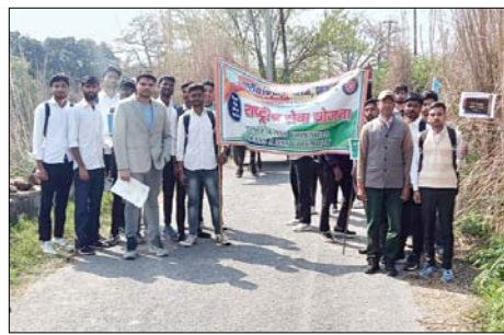
शिविर में शामिल छात्र।

शाह टाइम्स संवाददाता शामली। शहर के आरके पीजी कालेज की राष्ट्रीय सेवा योजना प्रथम एवं द्वितीय इकाई द्वारा एक दिवसीय शिविर का आयोजन किया गया। इस शिविर के लिए मुंडेटकला गांव को चयनित किया गया। जहां स्वयंसेवकों ने समाजहित में गति विधियों का संचालन किया।