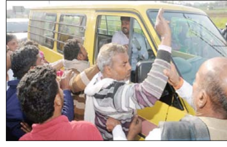
शामली। वाहन चालकों से अभद्रता करते परिजन।