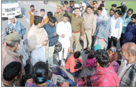
शामली। जाम लगाते मृतक के परिजन।

शाह टाइम्स संवाददाता शामली। देर रात्रि मजदूरी कर अपने घर लौट रहे एक श्रमिक को अज्ञात वाहन ने टक्कर मारकर बुरी तरह घायल कर दिया। श्रमिक की चीख पुकार सुनकर आसपास मौजूद लोगों ने पुलिस की मदद से घायल को निजी अस्पताल में भर्ती कराया, जहां उसकी दशा गंभीर होने के चलते मेरठ रेफर कर दिया गया, लेकिन श्रमिक को उपचार के दौरान मौत हो गई। गुस्साएँ परिजनों ने मुजफ्फरनगर हाईवे पर श्रमिक का शव रखकर जाम लगा दिया और आरोपी की गिरफ्तारी तथा आर्थिक सहायता की मांग की।