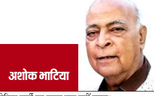
अशोक माटिया लेकिन पार्टी का खाता तक नहीं खुला।

उत्तर प्रदेश की नगीना सीट से सांसद चंद्रशेखर आजाद दलित युवाओं में खासे लोकप्रिय हैं। साथ ही वह पार्टी के नाम के साथ ही इस बात पर दावा पेश करते नजर आ रहे हैं कि वह ही काशीराम की राजनीतिक विरासत के उत्तराधिकारी हैं। अब कहा जा रहा है कि आनंद को पद से हटाए जाने के जरिए मायावती यह दिखाने की कोशिश में भी हैं कि वह काशीराम की विरासत की असली उत्तराधिकारी हैं। बताया तो यह भी जा रहा है कि बहुजन समाज पार्टी का किला लगातार ढहता जा रहा है। लोकसभा चुनाव 2024 में बहुजन समाज पार्टी 10 सीटों से शून्य पर आ गई। इसके बाद उत्तर प्रदेश की नौ विधानसभा सीटों पर उपचुनाव हुआ, इसमें भी पार्टी का खाता तक नहीं खुला। हरियाणा, झारखंड, महाराष्ट्र, जम्मू-कश्मीर विधानसभा चुनाव में भी बसपा की हालत खराब ही रही। दिल्ली विधानसभा चुनाव में पार्टी कुछ खास नहीं कर पाई। पार्टी के खराब प्रदर्शन के पीछे राजनीतिक विरलेषक सबसे बड़ा कारण पार्टी से नेताओं की विदाई मान रहे हैं। उनका मानना है कि अब पार्टी के पास पहले जैसे कद्दावर नेता बचे नहीं हैं। यही वजह है कि पार्टी को इसका लगातार नुकसान उठाना पड़ रहा है। साथ ही बसपा के खराब प्रदर्शन से पार्टी के अस्तित्व पर संकट खड़ा हो गया है।