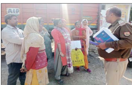
शामली। पुलिस से कार्रवाई की मांग करते परिजन।

शाह टाइम्स संवाददाता शामली। क्षेत्र के गांव खेड़ीकरमू निवासी परिजनों ने कोतवाली पुलिस के उपनिरीक्षक पर अपने भाई की संदिग्ध परिस्थितियों में हुई मौत के मामले में कार्यवाही न किए जाने का आरोप लगाते हुए हंगामा किया। पुलिस का कहना है कि मौत की सत्यता जानने के लिए लिया गया बिसरा जांच के लिए भेज दिया गया।