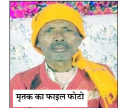
मृतक का फाइल फोटो

वाहन चालकों से की गई बदसलुकी शामली। क्षेत्र के गांव समसपुर निवासी श्रमिक की सड़क हादसे में मौत से गुस्साएँ परिजनों ने जाम लगाने के दौरान कई वाहन चालकों से बदसलुकी भी की। ग्रामीणों द्वारा जाम लगाने के लिए वाहन चालकों को रोका और कई वाहनों में डंडे मारते हुए वाहनों को डेंडिया कर दिया। इस दौरान मौके पर पहुंची थाना आदर्शमंडी पुलिस ने हंगामा कर रहे ग्रामीणों को समझा बुझाकर शांत किया।