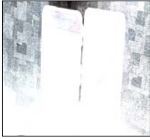
शानुसार चलाए जा रहे वांछित/हत्या में लिप्त अपराधियों की गिरफ्तारी से सम्बन्धित अभियान के अनुपालन में अपर पुलिस अधीक्षक शामली के निदेशन तथा क्षेत्राधिकारी कैरना के निकट पर्यवेक्षण में थाना कांथला पुलिस द्वारा त्वरित कार्यवाही करते हुए ग्राम गढ़ीश्याम के जंगल के रास्ते में हुई युवक की हत्या में वांछित 3 हत्याभियुक्तों को जिडाना रजवाहा पटरी ईट बट्टे के पास गिरफ्तार करने में महत्वपूर्ण सफलता प्राप्त हुई है।

शाह टाइम्स संवाददाता शामली। थाना कांथला पुलिस द्वारा ग्राम गढ़ीश्याम के जंगल के रास्ते में हुई युवक की हत्या में वांछित 3 हत्याभियुक्त गिरफ्तार, घटना में प्रयुक्त आलाकल अवैध हथियार, कारतूस व मोटर साईकिल बरामद किए हैं।