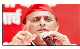
सपा मुखिया ने योगी सरकार से पूछा सवाल

लखनऊ। महाकुंभ के दौरान एक नाविक के 30 करोड़ की आमदनी होने के बयान पर निशाना साधते हुए समाजवादी पार्टी अध्यक्ष अखिलेश यादव ने शुक्रवार को कहा कि अगर सपा में एक परिवार ने महाकुंभ में अकेले 30 करोड़ कमाए हैं, तो सरकार ये भी बताए कि जीएसटी कितना मिला। यादव ने जारी बयान में कहा कि पवित्र महाकुंभ में यह तो सत्ता संरक्षण में अद्भुतताओं के साथ लूट की एक कहानी है। भाजपा सरकार के संरक्षण में न जाने कितने ठगों और लुटेरों ने अद्भुतताओं की आस्था का दोहन किया। इसकी कल्पना नहीं की जा सकती है। सरकार के ब्रांड एम्बेसडर नाविक को लेकर खबरों के माध्यम से जो कहानियां आ रही हैं। वह हैरान करने वाली हैं। इसी कहानी से भाजपा सरकार की नीति और नियत का पता