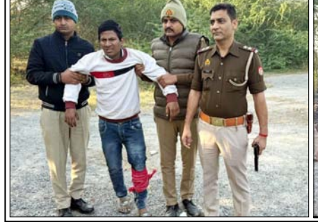
शाह टाइम्स ब्यूरो नोएडा। थाना सेक्टर-126 नोएडा पुलिस को सूचना मिली की मोबाइल स्नैच करने वाले 03 बदमाश चोरी की 02 बाइक से कालिंदी कुंज की तरफ से नोएडा में वारदात की अंजाम देने आ रहे हैं। सूचना पर थाना सेक्टर-126 पुलिस द्वारा कालिंदी कुंज हाईवे पर बैरियर लगाकर चेकिंग शुरू की।

गया कि हम लोग मिलकर चोरी की बाइक से राह चलते लोगों से चेन और मोबाइल स्नैच करते हैं। हमारे द्वारा मोबाइल स्नैचिंग की कई घटनाएं की गई हैं। इन लोगों में दिल्ली एनसीआर में कई स्थानों पर घटनाएं की हैं।