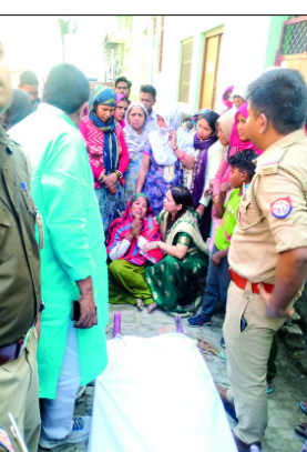
फोटो वायरल करने की धमकी देकर ब्लैकमेल करता था। मां के नंबर पर कॉल करके रिकॉर्डिंग की हुई थी। बेटी को बदनाम करने की धमकी देता था। बेटी ने युवक की ब्लैकमेलिंग से तंग आकर

शाह टाइम्स संवाददाता कंकरखेड़ा। दसवीं की छात्रा ने ब्लैकमेलिंग से तंग आकर गुरुवार को फांसी लगाकर जान दे दी। परिजनों ने घटना सूचना पर पहुंचे अधिकारियों का घेराव कर हंगामा किया था। पुलिस ने मौके पर पहुंच कर बदनामी का डर दिखा कर पोस्टमार्टम करने से इंकार करते हुए घटना को दबाने के लिए परिजनों को उल्टा डराना धमकाना शुरू कर दिया था। छात्रा की मौत की जानकारी उत्तर प्रदेश महिला आयोग की सदस्य को लगी तो सदस्य ने मौके पर पहुंच जानकारी की पुलिस ने शव को पोस्टमार्टम को भेजा। कंकरखेड़ा थाना क्षेत्र के गांव जौंटी सरधना रोड दंपती के चार बच्चे हैं। उनकी सबसे बड़ी पुत्री कक्षा दस की पढ़ाई कर रही थी।