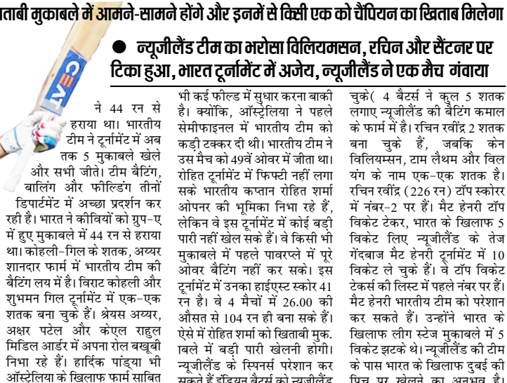
विराट को भारत-न्यूजीलैंड खिताबी मुकाबले में आमने-सामने होंगे और इनमें से किसी एक को चैंपियन का खिताब मिलेगा