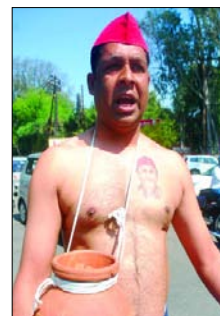
सपा कार्यकर्ता डीएम ऑफिस पर

दलितों पर हो रहे उत्पीड़न का किया विरोध टेटू देखकर युवक ने की कार्यकर्ता से मारपीट