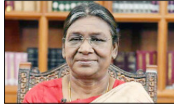
इंडक्शन ट्रेनिंग प्रोग्राम में मुर्मू ने किया आह्वान

नई दिल्ली, वार्ता राष्ट्रपति द्रौपदी मुर्मू ने अधिकारियों से गरीबों और वरिष्ठों को ध्यान में रखकर नीति और कार्यक्रम लागू करने को कहा है। श्रीमती मुर्मू ने शुक्रवार को यहां लाल बहादुर शास्त्री राष्ट्रीय प्रशासन अकादमी में 126वें इंडक्शन ट्रेनिंग प्रोग्राम में भाग लेने वाले राज्य सिविल सेवा अधिकारियों से राष्ट्रपति भवन में मुलाकात की।