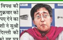
आतिशी ने महिलाओं को 2500 रुपये देने के लिए सीएम रेखा गुप्ता को लिखा पत्र

नई दिल्ली। दिल्ली विधानसभा में विपक्ष की नेता आतिशी ने मुख्यमंत्री रेखा गुप्ता को शुक्रवार को एक पत्र लिखकर महिलाओं को 2500 रुपये देने का वादा पूरा करने की मांग की। सुश्री आतिशी ने सुश्री गुप्ता को एक पत्र लिखकर कहा कि दिल्ली की लाखों माताओं-बहनों को ओर से आपको यह पत्र लिख रही हूँ और आपको यह दिलाना चाहती हूँ कि 31 जनवरी को प्रधानमंत्री नरेंद्र मोदी ने झारखंड में आयोजित रेली में दिल्ली की माताओं-बहनों से वादा किया था कि दिल्ली में भारतीय जनता पार्टी की सरकार बनते ही पहली कैबिनेट बैठक में 2500 रुपये प्रतिमाह देने की योजना परित होगी और महिला दिवस पर महिलाओं के खातों में पैसे आने शुरू हो जाएंगे। उन्होंने सभी महिलाओं को सलाह दी थी कि वे अपने बैंक खाते से अपने मोबाइल नम्बर को जोड़ लें, ताकि जब उनके अकाउंट में पैसे आएं तो उनके को पत्र इसकी जानकारी मिल सके। सुश्री आतिशी ने कहा है कि अब महिला दिवस में सिर्फ एक दिन बचा है। पूरी दिल्ली की महिलाएं इस दिन का बेसब्री से इंतजार कर रही हैं। वे उम्मीद लगाए बैठी हैं कि आठ मार्च से उनके अकाउंट में पहली किस्त आनी शुरू हो जाएगी, जैसा कि भाजपा ने वादा किया था। उन्होंने कहा है कि मुख्यमंत्री जी, दिल्ली की महिलाओं को उनका हक दिलाने के लिए तुरंत उनके खातों में पैसे ट्रांसफर किए जाएं।