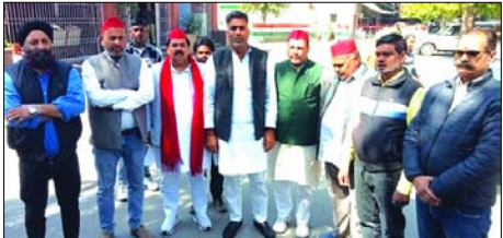
कलक्ट्रेट पर मुकदमों का विरोध करते सपा नेता।

प्रदर्शन के दौरान हुआ था 50 सपाइयों पर मुकदमा