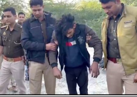
चोरी की बाइक से करते थे लूटपाट: बदमाशों से बरामद की गई बाइक चोरी की है। इसी बाइक से 25 फरवरी 2025 को सेक्टर-19 नोएडा स्थित बारात घर के पास से एक व्यक्ति से वन प्लस कंपनी का मोबाइल फोन छीना था। इसी मोबाइल के

गया कि हम लोग मिलकर चोरी की बाइक से राह चलते लोगों से चेन और मोबाइल स्नैच करते हैं। हमारे द्वारा मोबाइल स्नैचिंग की कई घटनाएं की गई हैं। इन लोगों में दिल्ली एनसीआर में कई स्थानों पर घटनाएं की हैं।