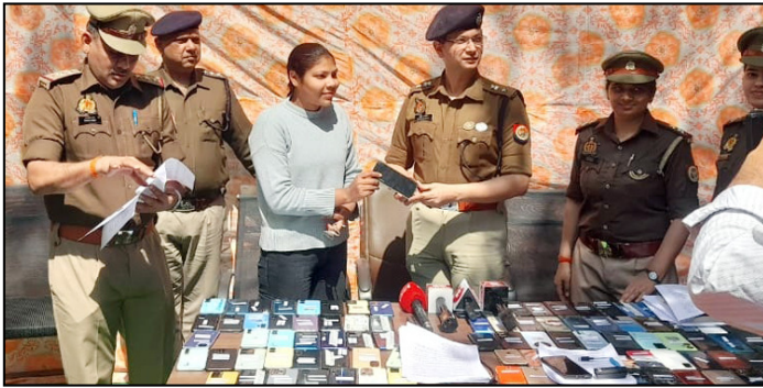
शिकायतों को निकलवाया गया। उनके फोन के ईएमआई नंबर को ट्रैक किया गया। जिसमें से करीब 100 लोगों के