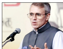
112 लाख का बजट पेश, गरीबों को मुफ्त बिजली मिलेगी

जम्मू-कश्मीर के मुख्यमंत्री उमर अब्दुल्ला ने शुक्रवार को यहां विधानसभा में केन्द्र शासित क्षेत्र का 2025-26 का 1.12 लाख करोड़ रुपये से अधिक का बजट पेश किया। श्री अब्दुल्ला के पास वित्त विभाग का भी दायित्व है। उन्होंने अपने बजट भाषण में कहा कि अगले वित्त वर्ष के बजट में कुल 1,12,310 करोड़ रुपये के व्यय का प्रावधान किया गया है।