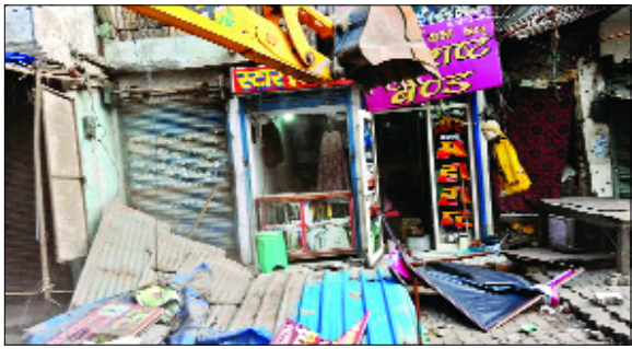
गया मौके पर व्यापारियों द्वारा भी सहयोग किया गया। आवागमन सरल बनाया गया