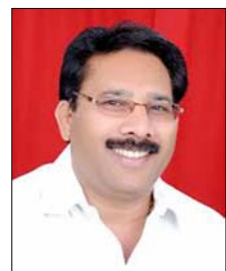
तरीके से दलितों ने बिना पुलिस के खौफ रखे घटना को अंजाम दिया है उससे पुलिस को कार्यप्रणाली पर भी सवालिया निशान उठता है।