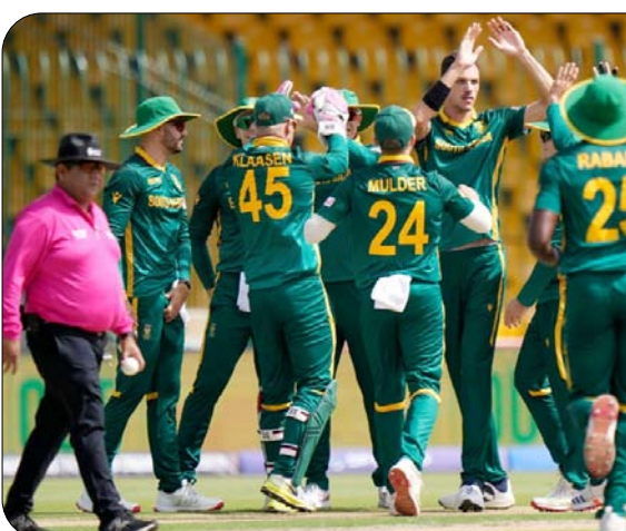
कराची, वार्ता। मार्को यानसन (39 रन पर तीन विकेट) और वियान मुल्डर (25 रन पर तीन विकेट) की यातक गेंदबाजी के बाद रासी वान

यानसन ने 39 रनों पर तीन विकेट और मुल्डर ने 25 रन देकर तीन विकेट हासिल किए