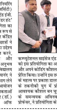
एसयू कोइर हंट प्रतियोगिता में भाग ले रहे छात्रों का समूह।