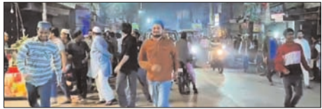
हुई थी। जिसमें महिलाओं की ज्यादा भीड़ होने से दुकान खचाखच भर गई, और वहां अफरा-तफरी का माहौल बन गया। कपड़ों की छीना झपटी होने से वहां कुछ लोगों ने महिलाओं को धक्के देकर बाहर किया, जिसके बाद वहां दो पक्ष आपस में भिड़ गए, उनमें मारपीट भी हो गई। इसी बीच किसी ने पुलिस को सूचना कर दी, जिससे पुलिस ने डंडे बरसाकर लोगों को

शाह टाइम्स संवाददाता बहेड़ी। दुकान में लगी सेल में ज्यादा भीड़ हो जाने पर अफरा-तफरी का माहौल हो गया। दुकान में मौजूद महिला ग्राहकों को दुकान से बाहर निकालने के लिए धक्का-मुक्का की गई। जिसके बाद वहां मारपीट हो गई। जिससे वहां अफरा-तफरी मच गई। इसका लोगों ने वीडियो बनाकर वायरल कर दिया, और सूचना पर पहुंची पुलिस ने डंडे बरसाकर खरीदारी करने आए लोगों को खदेड़ दिया। यहां इस समय ईद की खरीदारी चल रही है। नैनीताल रोड में मार्केट बेकरी वाली गली के पास महिलाओं के एक कपड़े की दुकान में सेल लगी