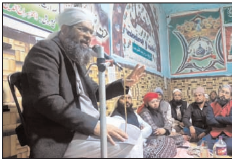
शाह टाइम्स ब्यूरो अमरोहा। शहर के मोहल्ला

खानकाह निजामिया में तरावीह में कुरआन मुकम्मल