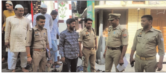
प्रशासन की चुनौती को कई गुना बढ़ा दिया है।

रमजान में जुमे की नमाज एक दिन होने के कारण मस्जिदों के आस पास समेत मिश्रित आबादी वाले इलाकों में विशेष सतर्कता बरतने पर खास जोर दे रहा है। इस बार चौदह मार्च को जब हर तरफ होली के रंगों के साथ ही गुलाल और अबीर की बौछार चल रही होगी तो उसी समय रमजान के मुबारक महीने में जुमे की नमाज भी अता की जाएगी। इस अर्द्धसंयोग ने पुलिस और प्रशासन को धड़कन अभी से बढ़ाते हुए बड़ी चुनौती खड़ी कर दी है। खुफिया विभाग के माध्यम से पिछले सालों के दौरान होली पर हुए विवादों का पूरा ब्यौरा तलब करने की कवायद शुरू कर दी गई है। सवे, दनशीलाता के साथ ही पुलिस और