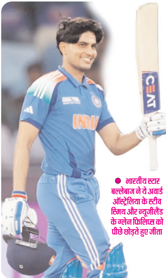
● भारतीय स्टार बल्लेबाज ने ये अवार्ड ऑस्ट्रेलिया के स्टीव स्मिथ और न्यूजीलैंड के वलें फिलिप्स को पीछे छोड़ते हुए जीता