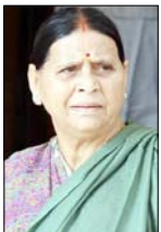
रावड़ी देवी पूर्व मुख्यमंत्री, बिहार

नीतीश कुमार सदन में भांग पीकर आते हैं और महिलाओं की बेइज्जती करते हैं। मुख्यमंत्री द्वारा बार-बार 2005 से पहले के बिहार को लेकर की जा रही आपत्तिजनक टिप्पणियों से राज्य की जनता आहत है। मैं राज्य सरकार और प्रधानमंत्री से पृथका चाहती हूँ कि क्या 2005 से पहले आपके घर को महिलाएं कपड़ा नहीं पहनती थीं, क्या वे नंगी रहती थीं, नीतीश कुमार बार-बार यह कहते हैं कि 2005 से पहले कुछ नहीं हुआ, लेकिन उन्हें नहल खोलकर देखनी चाहिए कि बिहार में महिलाओं, पिछड़ों और अति पिछड़ों के लिए क्या-क्या काम हुए हैं, अगर नीतीश कुमार को सब कुछ 2005 से ही दिखता है, तो क्या वे उसी साल ऊपर से टपक गए, क्या उनका राजनीतिक जीवन उससे पहले अस्तित्व में ही नहीं था, पत्रकार अपने माता-पिता से पूछें कि 2005 से पहले लोग क्या बिना कपड़ों के रहते थे, बाजार-हाट नहीं जाते थे, व्यापार नहीं होता था।