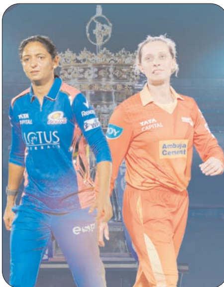
से 227 रन और 7-96 की इकॉनमी से 14 विकेट लेकर ऑलराउंडर की भूमिका पूरी तरह से निभाई है। अमेलिया केर मुंबई की प्रमुख स्पिनर रही हैं, जिन्होंने 8-03 की इकॉनमी से 14 विकेट लिए हैं।

एश्ले गार्डनर ने बेहतरीन प्रदर्शन किया है। उन्होंने आठ पारियों में 163 के स्ट्राइक रेट से 235 रन बनाए हैं। बेथ मूनी ने 128 के स्ट्राइक रेट से 230 रन बनाकर क्रीज पर अपनी मौजूदगी दर्ज कराई है। हरलीन देओल ने 124 के स्ट्राइक रेट से 224 रन बनाकर महत्वपूर्ण योगदान दिया है। काशवी गौतम ने 6-29 की इकॉनमी से 10 विकेट लिए हैं, जिससे गुजरात के गेंदबाजी आक्रमण में धार का काम किया। नेट सायबर-ब्रंट मुंबई की ओर से सबसे बेहतरीन बल्लेबाज रही हैं, उन्होंने आठ पारियों में 151-82 के शानदार स्ट्राइक रेट से 416 रन बनाए हैं। कप्तान हरमनप्रीत कौर ने आठ मैचों में 128 की स्ट्राइक रेट से 200 रन बनाकर महत्वपूर्ण भूमिका निभाई है। हेली मैथ्यूज ने 119-47 की स्ट्राइक रेट