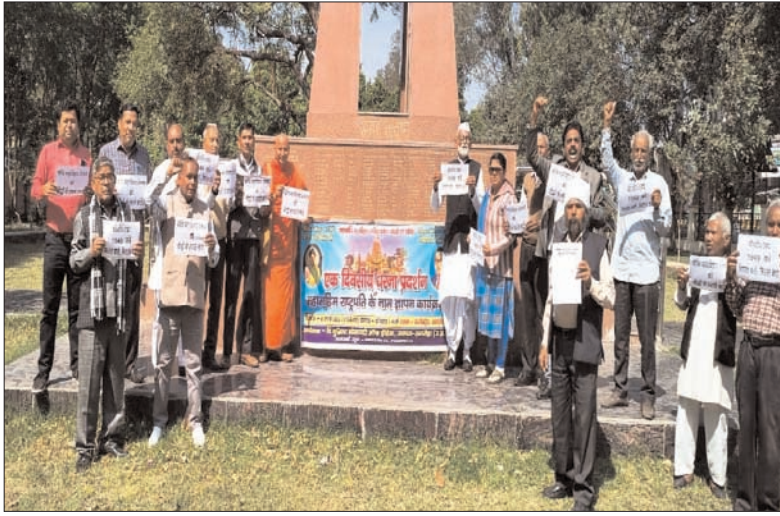
अमरोहा। कलेक्ट्रेट में प्रदर्शन करते बुद्धिस्ट इंटरनेशनल नेटवर्क के कार्यकर्ता।