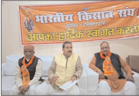
स्थित 3300 बीघा जमीन छोटा गांवश के लिए आरक्षित की जाए एवं भूमिकाओं से मुक्त कराकर छुट्टा गोवश के लिए आरक्षित की जाए। शाहबाद के अंतर्गत ग्राम छतरपुर में राज्य सरकार की भूमि पर अर्थ कच्चा दारो को हटाए। सूची भूमि सरकारी जूनियर विद्यालय को सौंप जाए शाहबाद सहस्राली में ग्राम महावाली दोस सर में ग्राम समाज की भूमि के छूट्टा भूमिकाओं के गतत