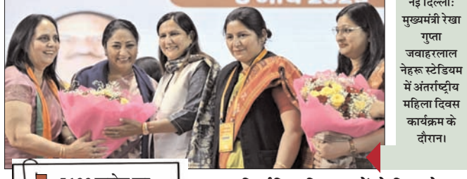
नई दिल्ली: मुख्यमंत्री रेखा गुप्ता जवाहरलाल नेहरू स्टेडियम में अंतर्राष्ट्रीय महिला दिवस कार्यक्रम के दौरान।

शाह टाइम्स ब्यूरो नई दिल्ली। दिल्ली कैबिनेट ने महिला दिवस पर महिला समृद्धि योजना के लिए 5100 करोड़ रुपये का आवंटन मंजूर किया है। जिसके तहत महिलाओं को प्रति माह 2500 रुपये मिलेंगे। इसका ऐलान भारतीय जनता पार्टी के राष्ट्रीय अध्यक्ष जेपी नड्डा ने शनिवार को किया। दिल्ली की मुख्यमंत्री ने कहा की चुनाव के दौरान यहां बहनों से जो वादा किया गया था उसे पूरा करते हुए कैबिनेट ने महिला समृद्धि योजना को मंजूरी दे दी जिससे अब गरीब महिलाओं को 2500 रुपये प्रति माह मिलने लगेगा। श्रीमती रेखा गुप्ता ने आज संवाददाताओं से कहा कि कैबिनेट की शनिवार हुई बैठक में महिला समृद्धि योजना को मंजूरी दी गई। इस योजना के लिए 5100 करोड़ रुपये का बजट में प्रावधान किया गया है। उन्होंने कहा कि महिला दिवस के अवसर का सदुपयोग करते हुए कैबिनेट की बैठक की और दिल्ली चुनाव में संकल्प पत्र में दिल्ली की बहनों से जो वादा किया उस पर मुहर लग गई। इसके लिए 5100 करोड़