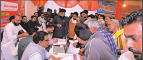
निस्तारण कर 233797405 रुपये की धनराशि का आदेश पारित किया गया।