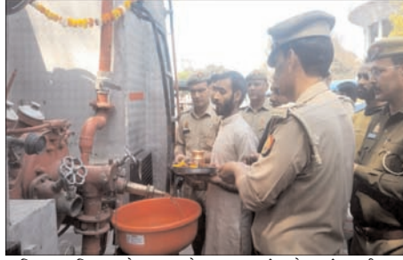
अग्निशमन विभाग के माध्यम से त्रिवेणी के जल को प्रत्येक जनपद में पहुंचाने के निर्णय की मुक्त कंठ से प्रशंसा की। इस मौके पर अग्निशमन विभाग के जवान मौजूद रहे।

लोगों ने आस्था के साथ जल प्राप्त किया वितरण प्रारंभ हुआ। गंगा मैया के जयकारों से वातावरण गुंजित हो गया। जिन्हें भी त्रिवेणी के महा प्रसाद के रूप में गंगा जल वितरण की जानकारी मिली त्यों ही लोग बोलत, केन, बर्तन आदि लेकर पहुंचे और गंगा जल प्राप्त किया। अग्निशमन कर्मचारियों ने बहुत ही सल्कार के साथ लोगों को गंगा जल का महाप साद वितरित किया। लोगों ने उत्तर प्रदेश सरकार के द्वारा