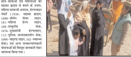
छात्र-छात्राओं एवं महिलाओं को शाहबाद हाऊस से बचाने के उपाय, महिला सम्बन्धी अपराध, हेल्पलाइन नंबर (1910)-साहबर क्रम, 1090-मोमन पीयर लालन, 181-महिला हेल्प लाइन, 108-एयुवैस सेवा, 1076-मुहब्बतुल हेल्लान, 112-पुलिस आपाकालिन सेवा, 1098-नाइड लाइन, 102-व्याख्या सेवा एवं अलग जगज्यायाकारी योजनाओं की विस्तृत जानकारी देकर जागरूक किया गया।

शाह टाइम्स संवाददाता सैफुनी/रामपुर। शांतिभंग शासन के अध्यक्ष के क्रम में पुलिस अधीक्षक, रामपुर एवं अपर पुलिस अधीक्षक, रामपुर के निदेशन में महिलाओं एवं बालिकाओं की सुरक्षा, सम्मान एवं स्वावलम्बन हेतु महिला मिशन थाना अधिभान के अन्तर्गत महिला सुरक्षा दल थाना सैफुनी द्वारा थाना क्षेत्रांतर्गत मीना बाजार सैफुनी, मोहल्ला साई बाली मन्दिब, जनात अउर कालिंज सैफुनी एवं अन्येकर मूर्ति तिराहे में