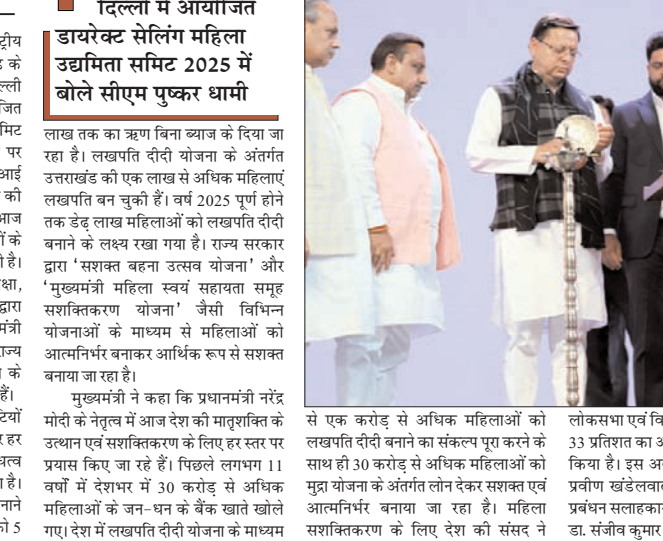
से एक करोड़ से अधिक महिलाओं को लखपति दीदी बनाने का संकल्प पूरा करने के साथ ही 30 करोड़ से अधिक महिलाओं को मुद्रा योजना के अंतर्गत लोन देकर सशक्त एवं आत्मनिर्भर बनाया जा रहा है। महिला सशक्तिकरण के लिए देश की संसद ने लोकसभा एवं विधानसभा में महिलाओं को 33 प्रतिशत का आरक्षण देने का कानून पास किया है। इस अवसर पर दिल्ली से सांसद प्रवीण खंडेलवाल, उपाध्यक्ष राज्य आपदा प्रबंधन सलाहकार समिति विनय रोहिला एवं डा. संजीव कुमार मौजूद थे।

दिल्ली में आयोजित डायरेक्ट सेलिंग महिला उद्यमिता समित 2025 में बोले सीएम पुष्कर धामी लाख तक का ऋण बिना ब्याज के दिया जा रहा है। लखपति दीदी योजना के अंतर्गत उत्तराखंड को एक लाख से अधिक महिलाएं लखपति बन चुकी हैं। वर्ष 2025 पूर्ण होने तक डेढ़ लाख महिलाओं को लखपति दीदी बनाने के लक्ष्य रखा गया है। राज्य सरकार द्वारा 'सशक्त बहना उत्सव योजना' और 'मुख्यमंत्री महिला स्वयं सहायता समूह सशक्तिकरण योजना' जैसी विभिन्न योजनाओं के माध्यम से महिलाओं को आत्मनिर्भर बनाकर आर्थिक रूप से सशक्त बनाया जा रहा है। मुख्यमंत्री ने कहा कि प्रधानमंत्री नरेंद्र मोदी के नेतृत्व में आज देश की मातृशक्ति के उत्थान एवं सशक्तिकरण के लिए हर स्तर पर प्रयास किए जा रहे हैं। पिछले लगभग 11 वर्षों में देशभर में 30 करोड़ से अधिक महिलाओं को जन-घन के बैंक खाते खोले गए। देश में लखपति दीदी योजना के माध्यम