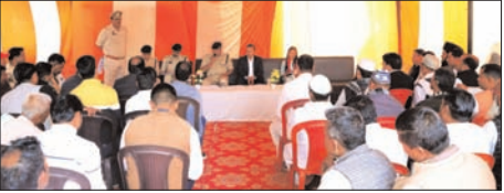
शाह टाइम्स ब्यूरो

त्यौहारों को सकुशल, सौहार्द एवं शांतिपूर्ण ढंग से मनाने को दिए गए आवश्यक निर्देश