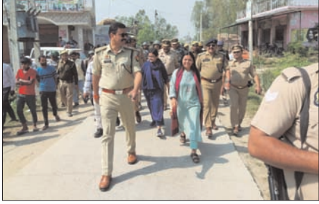
पुलिस फोर्स के साथ फ्लैग मार्च किया।

संवेदनशील गांव धर्मपुर में पुलिस-प्रशासनिक अफसरों ने किया फ्लैग मार्च रमजान माह में जुमे के दिन होली को लेकर टेंशन बढ़ी