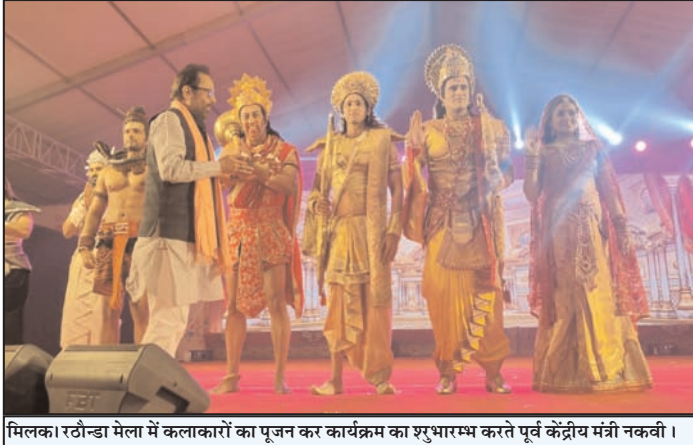
मिलक। रठौड़ा मेला में कलाकारों का पूजन कार्यक्रम का शुभारंभ करते पूर्व केंद्रीय मंत्री नकवी।

शाह टाइम्स संवाददाता मिलक / रामपुर। किसान मेला रठौड़ा में जय श्री राम रामायण श्रीराम की लीलाओं का मंचन फिल्मी कलाकारों द्वारा किया गया। इस दौरान बॉलीवुड से आए काल, कारों ने भगवान श्री राम के चौदह वर्ष वनवास, सीता माता से विवाह व रावण के द्वारा भोलेनाथ की तपस्या और रावण वध को फिल्मी परदे की तरह दर्शाया गया। शनिवार को महाशिवरात्रि से चल रहे किसान मेला रठौड़ा में जय श्री रामायण कार्यक्रम का आयोजन किया गया। जिसमें फिल्मी सीरियल कलाकारों ने श्री राम की कथा का सुंदर वर्णन करते हुए अद्भुत प्रस्तुतियाँ दीं। कार्यक्रम में सर्वप्रथम पूर्व केंद्रीय मंत्री मुख्तार अब्बास नकवी ने दीप प्रज्वलित कर कार्यक्रम का शुभारंभ किया। कार्यक्रम में रावण द्वारा भगवान भोलेनाथ की भक्ती का दृश्य दर्शाया गया। जिससे प्रसन होकर भोलेनाथ से रावण ने विश्व में सर्वशक्तिमान बनने का वरदान मांगा। भक्ती से प्रसन होकर रावण को वरदान देने के बाद असुरों की संज्ञा देते हुए शंकर जी ने भगवान के रूप में पृथ्वीलोक पर श्रीराम के अवतरण की घोषणा की। जिसके बाद कार्यक्रम में राजा जनक ने अपनी पुत्री सीता के विवाह का प्रसंग का आयोजन हुआ। जहाँ श्री राम ने धनुष तोड़ कर सीता के साथ विवाह किया। विवाह उपरान्त राजा दशरथ की पत्नी ने अपने पुत्र भरत के लिए राज सिंहासन और पुत्र राम को 14 वर्ष के वनवास का वचन मांगा। जिस पर राजा दशरथ ने पूर्व में दी गये वचन के अनुसार पुत्र राम से