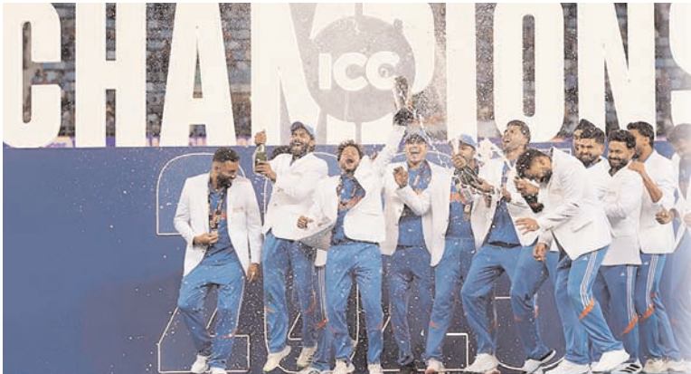
ICC CHAMPIONS TROPHY PAKISTAN 2025