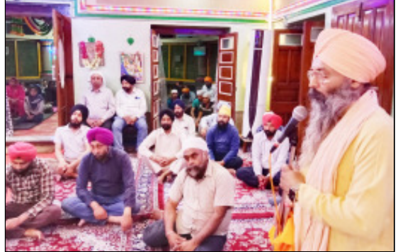
महीना मीठा महीना होता है। प्रकृति आनंदमय हो जाती है। संत, महापुरुषों की सेवा करते हुए और प्रभु सिम्पन से अपना जीवन व्यतीत करें। हर जीव में परमात्मा है। अपने दुखों को मिटाने के लिए प्रभु का नाम लेना जरूरी है। मन में विचार होना

सिम्पन नहीं करो। हर महीने के अनुसार गुरु महाराज ने जीवन यापन के बारे में बताया है। चैत्र का