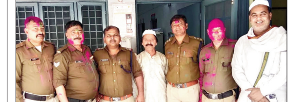
शाह टाइम्स संवाददाता

विकासनगर। होली पर्व और रमजान के महीने का जुमा एक साथ पड़ने पर विकासनगर पुलिस ने बड़े शांति पूर्वक जुमे की नमाज अदा करवाई। पुलिस ने सुबह से ही सभी धर्म के लोगों से शांतिपूर्वक त्योहार मनाने की अपील की। जुमे की नमाज शांतिपूर्वक अदा करने के लिए भारी पुलिस बल मस्जिद के बाहर मौजूद रहा। ताकि कोई भी शरारती तत्वों का मौहल को खराब न