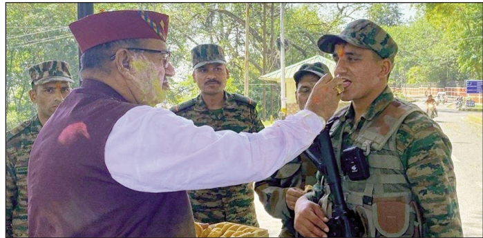
शाह टाइम्स संवाददाता

देहरादून। रंगों के पर्व होली के शुभ अवसर पर प्रदेश के सैनिक