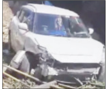
महिला गंभीर रूप से घायल हुई। उसे उपचार के लिए स्थानीय अस्पताल में भर्ती कराया है। घटना को अंजाम देने के बाद ट्रक चालक मौके से फरार हो गया। पुलिस ट्रक ड्राइवर को तलाश कर रही है।

योंगपीठ के पास फ्लाई ओवर पर एक कार को पीछे से टक्कर देकर टक्कर मार दी। अलियॉन होकर कार रेलिंग तोड़कर पुल के नीचे जा गिरी। कार में सवार दम्पति में