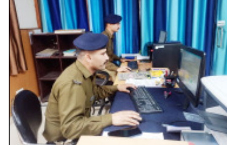
शाह टाइम्स संवाददाता

हरिद्वार। साइबर ठगी के मामले लगातार बढ़ रहे हैं। तमाम जागरूकता अभियानों के बावजूद लोग साइबर अपराधियों के जाल में फंस रहे हैं। ऐसे ही दो मामलों में कार्रवाई करते हुए हरिद्वार पुलिस के साइबर सैल ने दो पीड़ितों को उनकी रकम वापस दिलाने में कामयाब रही।