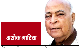
अशोक माटिया लोकन पार्टी का खाता तक नहीं खुला।

उत्तर प्रदेश की नगीना सीट से सांसद चंद्रशेखर आजाद दलित युवाओं में खासे लोकप्रिय हैं। साथ ही वह पार्टी के नाम के साथ ही इस बात पर दावा पेश करते नजर आ रहे हैं कि वह ही काशीराम की राजनीतिक विरासत के उत्तराधिकारी हैं। अब कहा जा रहा है कि आनंद को पद से हटाए जाने के जरिए मायावती यह दिखाने की कोशिश में भी हैं कि वह काशीराम की विरासत की असली उत्तराधिकारी हैं। बताया तो यह भी जा रहा है कि बहुजन समाज पार्टी का किला लगातार ढहता जा रहा है। लोकसभा चुनाव 2024 में बहुजन समाज पार्टी 10 सीटों से शून्य पर आ गई। इसके बाद उत्तर प्रदेश की नौ विधानसभा सीटों पर उपचुनाव हुआ, इसमें भी पार्टी का खाता तक नहीं खुला। हरियाणा, झारखंड, महाराष्ट्र, जम्मू-कश्मीर विधानसभा चुनाव में भी बसपा की हालत खराब ही रही। दिल्ली विधानसभा चुनाव में पार्टी कुछ खास नहीं कर पाई। पार्टी के खराब प्रदर्शन के पीछे राजनीतिक विरलेषक सबसे बड़ा कारण पार्टी से नेताओं की विदाई मान रहे हैं। उनका मानना है कि अब पार्टी के पास पहले जैसे कद्दावर नेता बचे नहीं हैं। यही वजह है कि पार्टी को इसका लगातार नुकसान उठाना पड़ रहा है। साथ ही बसपा के खराब प्रदर्शन से पार्टी के अस्तित्व पर संकट खड़ा हो गया है।