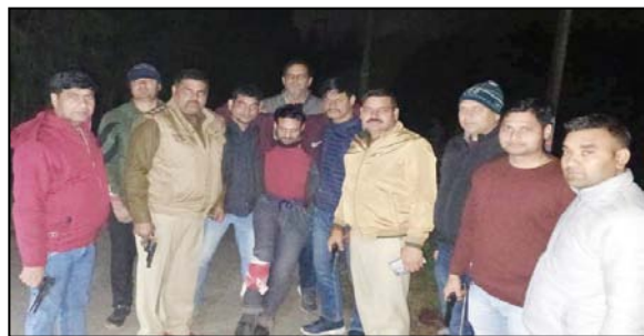
साइकिल सवार दोनो गौवंश चोरों ने अपनी मोटर साइकिल पीछे की ओर मोड़कर वापस भागने का प्रयास करने लगे। पुलिस की युवाओं पर संदेह होने पर जैसे ही उनके पीछे भागने लगी तो बदमाशों की बाइक हड़बड़ाहट में फिसलकर गिर गयी। जैसे ही दोनों बदमाशों ने पुलिस टीम को नजदीक आते देखा। उन्होंने पुलिस टीम से मारने की नीयत से फायरिंग शुरू कर दी। जिस पर पुलिस टीम ने भी जवाबी कार्रवाई एवं आत्मरक्षा हेतु फायरिंग की तो एक बदमाश फौजन पुलिस की गोली लगने से घायल हो गया। बदमाश को पकड़ना पुलिस टीम को नजदीक आते देखा। उन्होंने पुलिस टीम से मारने की नीयत से फायरिंग शुरू कर दी। जिस पर पुलिस टीम ने भी जवाबी कार्रवाई एवं आत्मरक्षा हेतु फायरिंग की तो एक बदमाश फौजन पुलिस की गोली लगने से घायल हो गया। बदमाश को

शाह टाइम्स संवाददाता सरसावा। पशु चोरी की घटनाओं पर रोक लगाने हेतु चलाए जा रहे अभियान के तहत थाना सरसावा एवं थाना चिलकाना पुलिस की संयुक्त टीम की रात के समय गौवंश चोरों के साथ अलीपुरा के जंगल में मुठभेड़ हुई। जिसमें एक बदमाश गोली लगने से घायल हो गया और दूसरा अंधेरे का फायदा उठा फरार होने में कामयाब रहा। पकड़े गए बदमाश पर चोरी सहित अलग अलग धाराओं में 21 मुकदमें दर्ज।