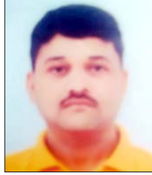
मृतक का फाइल फोटो। को ओवरलेट किया तो ओवरलोड ट्रक अनियंत्रित होकर पलट गया। जहाँ पर ट्रक पलटा वहीं से शगर मिल में काम करने वाले दो कर्मचारी

शाह टाइम्स संवाददाता मंसूरपुर। गन्ने से भरने ओवरलोड ट्रक के अनियंत्रित होकर पलट जाने से उसके नीचे दबकर दो युवकों की मौत हो गई। लोडर तथा जेसीबी के द्वारा दोनों युवकों को बाहर निकाल कर बेगमजपुर में भर्ती कराया गया। जहाँ पर डॉक्टरों ने दोनों को मृत घोषित कर दिया पुलिस ने शवों को मोर्चरी भिजवा दिया था।