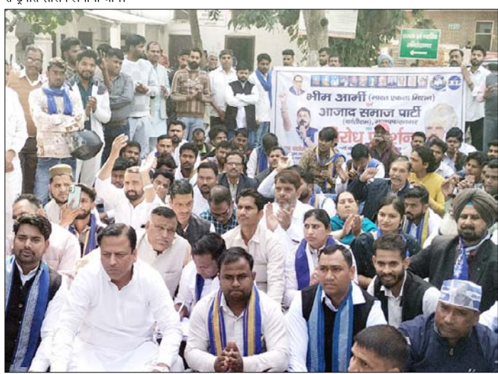
मुजफ्फरनगर: कलेक्ट्रेट पर धरना देते आजाद समाज पार्टी के कार्यकर्ता।