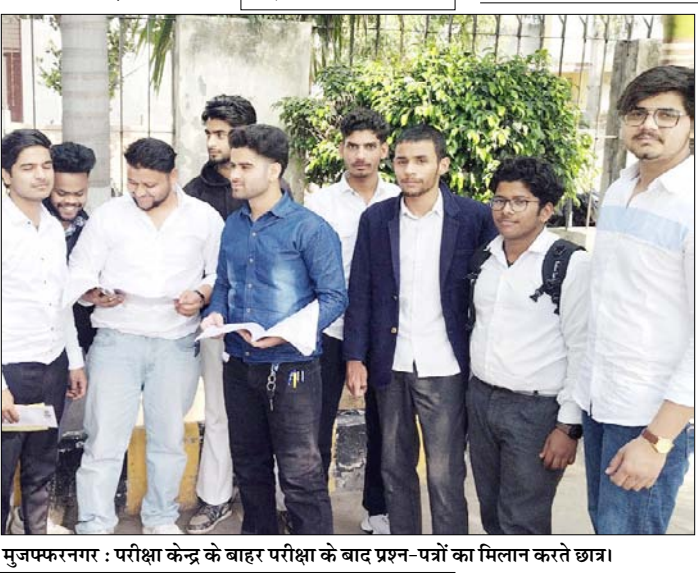
मुजफ्फरनगर : परीक्षा केन्द्र के बाहर परीक्षा के बाद प्रश्न-पत्रों का मिलान करते छात्र।