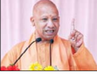
बेईमानी व भ्रष्टाचार पर कर रही है कठोर प्रहार

मुख्यमंत्री योगी आदित्यनाथ ने कहा कि प्रत्यक्ष लाभ अंतरण (डीबीटी) बजरंग बली की गदा है, जो बेईमानी व भ्रष्टाचार पर कठोर प्रहार कर रही है। विधानसभा में बजट पर चर्चा के दौरान उन्होंने कहा कि डीबीटी ने भ्रष्टाचार को कम कर प्र सबसे कठोर प्रहार किया है।