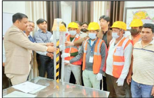
नगरायुक्त संजय चौहान ने नमस्ते योजना के तहत सरकार से प्राप्त उपकरणों के सम्वन्ध में बांकी को से जानकारी ली और उनका निरीक्षण किया। उन्होंने कहा कि भारत सरकार सीवर कार्य में लगे सफाई कर्मचारियों की सुरक्षा के प्रति काफी गंभीर है और उनके लिए अनेक योजनाएं चला रही हैं। उन्होंने कर्मचारियों को सुरक्षा उपकरणों के साथ ही कार्य करने के

शाह टाइम्स ब्यूरो सहारनपुर। भारत सरकार के सामाजिक न्याय एवं अधिकारिता मंत्रालय ने 'नमस्ते योजना' के अंतर्गत सीवर सफाई में लगे कर्मचारियों की सुरक्षा के लिए सुरक्षा उपकरण नगर निगम को भेजे हैं। नगर निगम की ओर से आज नगरायुक्त संजय चौहान ने ये सुरक्षा उपकरण निगम क्षेत्र में सीवर के अनुरक्षण एवं संचालन के लिए नियुक्त कार्यदायी संस्था वी ए टेक वावेज चेंनई के प्रतिनिधि और सफाई कर्मियों को सौंपे।