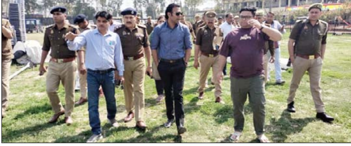
शाहली। तैयारियों का निरीक्षण करते डीएम-एसपी।

शाहली। जिलाधिकारी शामली अरविन्द कुमार चौहान व पुलिस अधीक्षक राम सेवक गौतम ने आज जनपद में दिनांक 7 मार्च से 10 मार्च 2025 तक होने वाले शामली महोत्सव की तैयारियों को लेकर पुलिस एवं प्रशासनिक अधिकारियों के साथ शामली महोत्सव आयोजन स्थल चौबी। डिग्री कॉलेज का निरीक्षण कर व्यवस्थाओं का जायजा लेते हुए मौके पर अधिकारियों को आवश्यक दिशा-निर्देश दिए। निरीक्षण के समय जिलाधिकारी व पुलिस अधीक्षक द्वारा महोत्सव में लोगों के आने-जाने की व्यवस्था के साथ-साथ सुरक्षा व्यवस्था आदि को भी देखा और संबंधित अधिकारियों को निर्देशित किया। निरीक्षण के समय जिलाधिकारी ने साफ सफाई व्यवस्था हेतु अधिशासी अधिकारी शामली को निर्देशित किया। इसके उपरान्त जिलाधिकारी व पुलिस अधीक्षक द्वारा वहां पर कंट्रोल रूम आदि सभी व्यवस्थाओं को देखा और अधिकारियों को निर्देशित किया कि जनपद में भव्य शामली महोत्सव होने जा रहा है