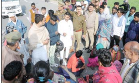
शामली। जाम लगाते मृतक के परिजन।

शाह टाइम्स संवाददाता शामली। देर रात्रि मजदूरी कर अपने घर लौट रहे एक श्रमिक को अज्ञात वाहन ने टक्कर मारकर बुरी तरह घायल कर दिया। श्रमिक को चीख पुकार सुनकर आसपास मौजूद लोगों ने पुलिस की मदद से घायल को निजी अस्पताल में भर्ती कराया, जहां उसकी दशा गंभीर होने के चलते मेरठ रेफर कर दिया गया, लेकिन श्रमिक को उपचार के दौरान मौत हो गई। गुस्साएँ परिजनों ने मुजफ्फरनगर हाईवे पर श्रमिक का शव रखकर जाम लगा दिया और आरोपी की गिरफ्तारी तथा आर्थिक सहायता की मांग की।