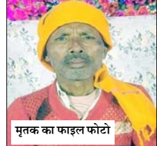
मृतक का फाइल फोटो

चालक की गिरफ्तारी और पीडित को आर्थिक सहायता प्रदान कराने की मांग अर्द्ध रहे। उन्होंने हाईवे पर लाइटों की व्यवस्था और पुलिस ड्यूटी की भी मांग की। बाद में नायाव तहसीलवार भी मौके पर पहुंचे और पीडितों को श्रमिक बीमा और आर्थिक सहायता प्रदान कराए जाने का आश्वासन दिया। साथ ही हाईवे पर लाइटे