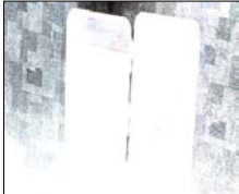
शानुसार चलाए जा रहे वांछित/हत्या में लिप्त अपराधियों की गिरफ्तारी से सम्बन्धित अभियान के अनुपालन में अपर पुलिस अधीक्षक शामली के निदेशन तथा क्षेत्राधिकारी कैरना के निकट पर्यवेक्षण में थाना कांथला पुलिस द्वारा त्वरित कार्यवाही करते हुए ग्राम गढ़ीश्याम के जंगल के रास्ते में हुई युवक की हत्या में वांछित 3 हत्याभियुक्तों को जिडाना रजवाहा पटरी ईट पट्टे के पास गिरफ्तार करने में महत्वपूर्ण सफलता प्राप्त हुई है।

शाह टाइम्स संवाददाता शामली। थाना कांथला पुलिस द्वारा ग्राम गढ़ीश्याम के जंगल के रास्ते में हुई युवक की हत्या में वांछित 3 हत्याभियुक्त गिरफ्तार, घटना में प्रयुक्त आलाकल अवैध हथियार, कारतूस व मोटर साईकिल बरामद किए हैं।