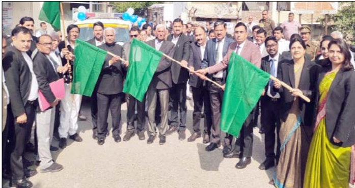
कि आगामी 8 मार्च को न्यायालय परिसर में राष्ट्रीय लोक अदालत का आयोजन किया जाना है, जिसके सफल आयोजन हेतु जागरूकता रैली निकाली गई है। जिससे राष्ट्रीय लोक अदालत में सम्मिलित होकर वादकारी

शाह टाइम्स संवाददाता कैरना। आगामी 8 मार्च को आयोजित होने वाली राष्ट्रीय लोक अदालत के प्रचार-प्रसार वाहनों व जागरूकता रैली को जनपद न्यायाधीश ने हरी झंडी दिखाकर रवाना किया। यह जागरूकता रैली पूरे जनपद में जाकर लोगों को लोक अदालत के आयोजन के प्रति जागरूक करेगी, जिससे ज्यादा से ज्यादा मामलों का निपटारा किया जा सके।