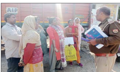
शामली। पुलिस से कार्रवाई की मांग करते परिजन।

शाह टाइम्स संवाददाता शामली। क्षेत्र के गांव खेडीकरमू निवासी परिजनों ने कोतवाली पुलिस के उपनिरीक्षक पर अपने भाई की संदिग्ध परिस्थितियों में हुई मौत के मामले में कार्यवाही न किए जाने का आरोप लगाते हुए हंगामा किया। पुलिस का कहना है कि मौत की सत्यता जानने के लिए लिया गया बिसरा जांच के लिए भेज दिया गया।