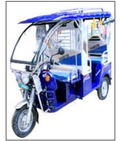
के दौरान चैकिंग अभियान में अवैध ई रिक्षाओं को पकड़कर कार्यवाही की गई थी। इसी को देखते हुए अब जनपद भर में ई रिक्षाओं का अवैध संचलन रोकने और बाइक वाले रेहडे तथा टेलों पर कार्यवाही करने के लिए पुलिस अधीक्षक यातायात अतुल कुमार चौबे ने नई एडवाइजरी कर दी है। उन्होंने बताया कि सुडक सुरक्षा के दृष्टिकोण जनपद में यातायात को सुगम बनाने के लिए ई रिक्षा और अनाधिकृत रूप से निर्मित किये गये रेहडे व टेलों के संचलन के लिए निर्देश जारी कर दिये गये हैं। इसके बाद विभाग इन निर्देशों का अनुपालन सुनिश्चित करने के लिए पूरे जिले में बड़ा चैकिंग अभियान भी शुरू करेगा। एसपी ट्रैफिक अतुल चौबे ने बताया कि जनपद में मोटरसाइकिल इत्यादि को जोड़कर बनाये गये जुगाड़ वाहन जैसे रेहडे और टेले पूर्णतया प्रतिबंधित किये गये हैं। इनके खिलाफ चैकिंग अभियान चलेगा और पकड़े जाने पर ऐसे जुगाड़ वाहनों को तत्काल ही सीज संचलन के लिए लगाये गये प्रतिबंध का खूद-खूद किया जायेगा।

मुजफ्फरनगर। शहर में बढ़ते यातायात को कंट्रोल करने के लिए यातायात पुलिस ने ई रिक्षा पर लिफाफे कर नई एडवाइजरी जारी की है। दरअसल अवैध ई रिक्षाओं यातायात व्यवस्था के लिए सबसे बड़ी बाधा बनी ई रिक्षाओं के शहर के साथ ही जनपद भर में अवैध संचलन के साथ साथ बाइक की जुगाड़ वाले रेहडे और टेलों पर भी अब प्रतिबंध लगाने का प्रशासन ने तैयारी शुरू कर दी है इसके लिए यातायात विभाग की ओर से एक नई एडवाइजरी जारी करते हुए अवैध ई रिक्षाओं को सड़कों पर उतारने पर सीज की कार्यवाही करने और बाइक वाले रेहडे व टेलों को पकड़कर उनको तत्काल ही खूद-खूद करने की कारंबाई शुरू होगी। ई-रिक्षाओं का अवैध संचलन शहर में जाम का मुख्य कारण माना जाता रहा है, इसके लिए समय समय पर अनेक वाद मुद्दा भी उठाया गया और चैकिंग अभियान भी चलाये गये, लेकिन वावजूद इस कार्यवाही के अवैध संचलन नहीं रोका जा सका है। फाल्गुन मास की कांवेड यात्रा के दौरान भी यातायात पुलिस द्वारा कांवेड मार्ग पर ई रिक्षाओं के संचलन के लिए लगाये गये प्रतिबंध