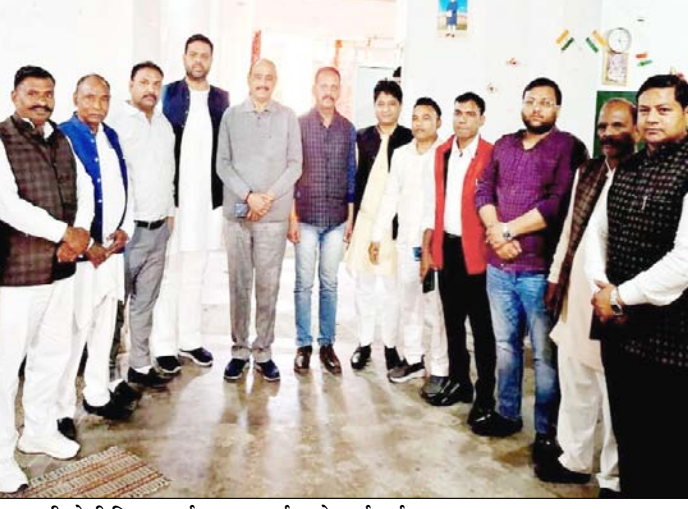
पुरकाजी: होली मिलन कार्यक्रम पर चर्चा करते कार्यकर्ता।