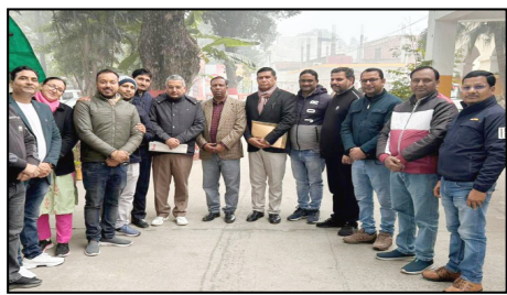
संगोष्ठी के माध्यम से जन जागरूकता कार्यक्रम हेतु कार्यालय संपर्क एवं जनप्रतिनिधियों के माध्यम से माननीय प्रधानमंत्री एवं माननीय मुख्यमंत्री उत्तर प्रदेश सरकार को ज्ञापन देकर उपरोक्त सभी मांगों के समर्थन में कार्यक्रम किया जाएगा। कार्यालय में संपर्क भोजन अवकाश के समय में तथा बैठकों एवं ज्ञापन कार्यक्रम साप्ताहिक अवकाश के दिनों में संपन्न किए जाएंगे जिसको संपर्क, सहयोग, सदस्यता के कार्यक्रम के नाम से पश्चिमी उत्तर प्रदेश में संपन्न होंगे। पश्चिमी उत्तर प्रदेश में प्रत्येक जिलों में कर्मचारियों की बैठक और कर्मचारी सम्मेलन एवं अधिवेशन करके पुरानी पेंशन बहाली के लिए केंद्र सरकार के समक्ष