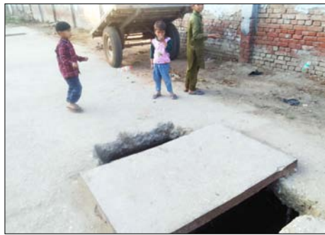
नाले की पट्टी पर लोगों के घर हैं और मासूम बच्चे खुले मैनहोल के पास खेलते रहते हैं। ऐसे में इन अधूरे खुले मैनहोल में गिरकर कभी भी कोई बच्चे हादसे का शिकार हो सकता है।

जिससे यहां हर समय हादसों के होने के खतरा मंडरा रहा है। क्योंकि