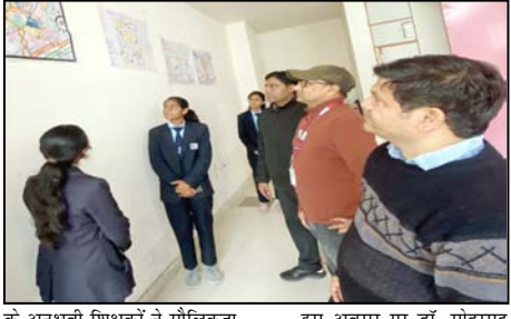
के अनुभवों शिक्षकों ने मौलिकता, स्पष्टता और विषय की प्रासंगिकता के आधार पर पोस्टर का मूल्यांकन किया। इसके अतिरिक्त इंटरएक्टिव सत्र और चर्चाओं का भी आयोजन हुआ।