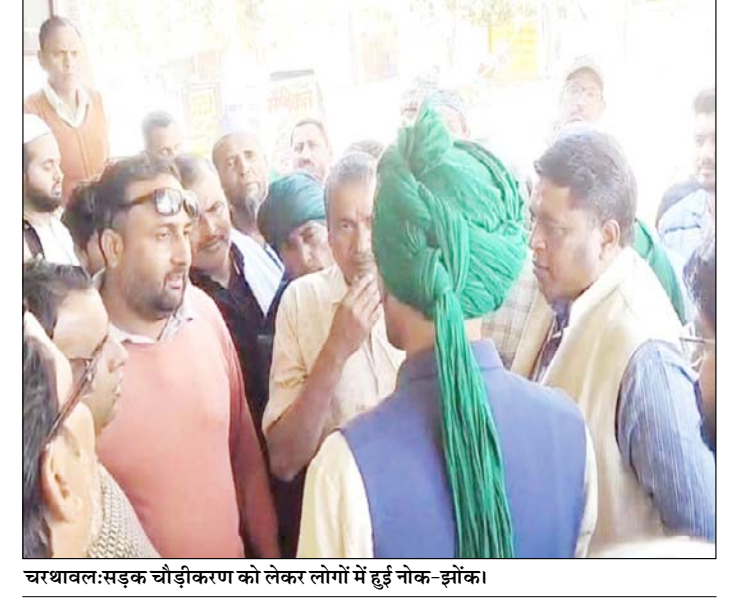
चरथावल: सड़क चौड़ीकरण को लेकर लोगों में हुई नोक-झोंक।

छपारा। ब्यूटी पालर में मेकअप कराने आई दुल्हन का कार सवार चार युवकों ने जबरन कार में बैठाने का प्रयास किया। दुल्हन के साथ आई महिलाओं ने विरोध किया तो छीना-झपटी में ब्यूटी पालर की दुकान के शीशे टूट गये। आरोपी कार छोड़कर फरार हो गये। क्षेत्र एक गांव में दुल्हन की बारात आई हुई थी दुल्हन छपार एक ब्यूटी पालर में मेकअप कराने आई थी उसी वक्त वहां कार सवार चार युवक आये और दुल्हन को जबरन कार में बैठाने लगे। दुल्हन की साथी महिलाओं ने विरोध किया तो उनके साथ भी हाथापाई की जिससे दुकान के शीशे भी टूट गये। खुद को घिरा देखकर आरोपी कार छोड़कर फरार हो गये। परिजन भी मौके पर पहुंचे और दुल्हन को घर ले जाकर शादी की रस्म पूरी की सूचना पर पहुंची पुलिस ने कार को कब्जे में कर आरोपियों की तलाश शुरू कर दी। पुलिस का कहना है कि तहरीर आने पर उचित कार्रवाई की जायेगी। आरोपियों की तलाश की जा रही है।