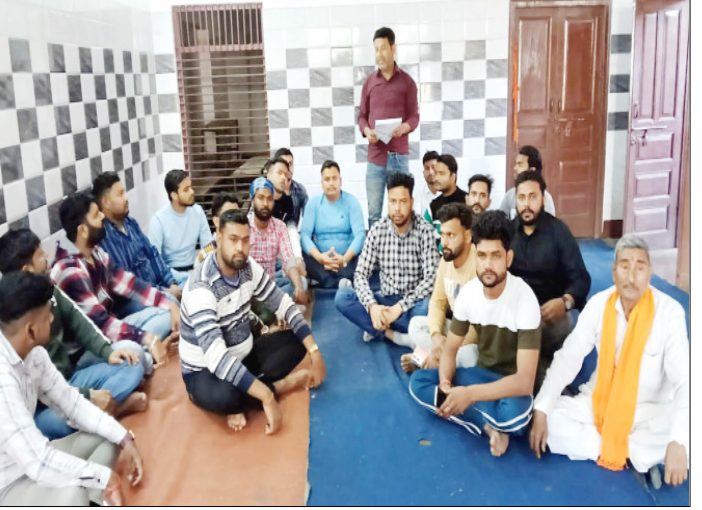
मुजफ्फरनगर: नगर पालिका में प्रदर्शन करते गौ सेवक।