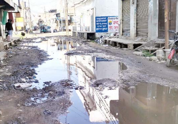
मुजफ्फरनगर: यह नजारा किसी गांव के तालाब का नहीं, बल्कि शहरी क्षेत्र से खालापार होकर सुजड़ को जाने वाले मुख्य मार्ग का है, इसे नगर पालिका व प्रशासन की अनदेखी नहीं तो और क्या करें? सड़क ने तालाब का रूप ले लिया है।