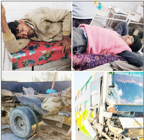
भर्ती कराया। प्राथमिक उपचार के बाद सभी को छुट्टी दे दी गई।