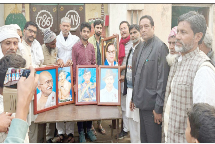
बुढ़ाना: जौला में पीडीए यात्रा का स्वागत करते सपाईं।