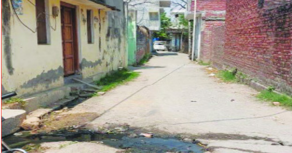
गांव में पसरा सन्नाटा

कोतवाली देहात। एक तरफा प्रेम में बदमाश मानसिकता के युवक ने अपने पिता व बहन के साथ बाइक से जा रही युवती को गोली मार कर उसका कत्ल कर दिया। शांति बदमाश की तरह आरोपी ने हथियार के साथ थाने पहुंच कर सरेंडर कर दिया। इस सनसनीखेज वारदात से गांव में सन्नाटा पसरा हुआ है। खास बात यह है कि बदमाश मानसिकता के युवक द्वारा पूर्व से ही युवती को परेशान किया जाता था और उसकी शिकायत पर भी कोई कार्यवाही नहीं की गई, उल्टा दबंगों व आरोपी के परिजनों ने उसकी हिमायत की। जिससे उसका दुस्साहस बढ़ गया।