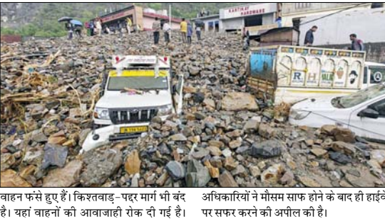
बाहन फंसे हुए हैं। किरतबाड़-पहर मार्ग भी बंद है। यहां बाहनों की आवाजाही रोक दी गई है। अधिकारियों ने मौसम साफ होने के बाद ही हाईवे पर सफर करने की अपील की है।

पहाड़ का मलबा गांव की तरफ आ गया, जिसकी चपेट में कई लोग और घर आ गए। फिलहाल रेस्क्यू ऑपरेशन जारी है। उधर, रामबन जिले के बनिहाल इलाके में कई जगह लैंडस्लाइड हुई हैं। इसकी वजह से जम्मू-श्रीनगर नेशनल हाईवे बंद कर दिया गया है। सैकड़ों