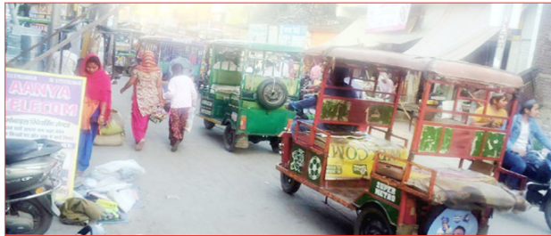
कहना बहुत चाहती है। शहर के संप्रति नागरिक चाह रहे हैं कि पालिका और तहसील प्रशासन मिलकर एक बड़ा अतिक्रमण हटाओ अभियान चलाये ताकि इस पानी की चिपकने वाली जोख जैसी समस्या से कुछ निजात मिल सके और शहर की रौनक और सुंदरता को देखने का मौका मिल सके। फिलहाल धनीरा रोड, स्याऊ दतियाना रोड, चांदपुर रोडवेज से ग्राम पीपलसाना रोड, धनीरा बाईपास डिग्री कॉलेज द्वितीय गेट वाला रोड आदि अतिक्रमण की चपेट में हैं जहाँ देखें वहाँ अतिक्रमण का पर्याय बने अवैध रूप से रखे खोखे,

शाह टाइम्स संवाददाता चांदपुर। नगर पालिका द्वारा कराये जा रहे विकास कार्यों को आजकल नगर के अंदर और नगर के बाहरी मार्गों पर अतिक्रमण का पर्याय बने अतिक्रमणकारी लगातार पलीता लगाने का काम कर रहे हैं। पालिका बोर्ड द्वारा नगर के अवागम को बेहतर सुविधा प्रदान करने और नगर के चहुमुखी विकास और सौंदर्यकरण कराने का कार्य कर रहा है, मगर नगर में बढ़ता अतिक्रमण नगर की सौंदर्यता को पलीता लगाने में कोई कसर नहीं छोड़ रहा है। शहर के अंदर हो या बाहर सभी जगह फड़, टेल, खोखे, अवैध कब्जे हुए देखने को मिल जायेंगे। शहर की बात करे तो सड़कों पर दुकानदारों का अतिक्रमण काफी बड़ी समस्या बनता जा रहा है। अतिक्रमणकारियों ने अपनी-अपनी दुकानों के सामान को सड़कों पर लगाकर सड़कें संकरी करने में कोई कसर नहीं छोड़ रखी। अगर सच कहा जाये तो नगर की जनता भले ही चुप्पी साधे हुए हो, मगर