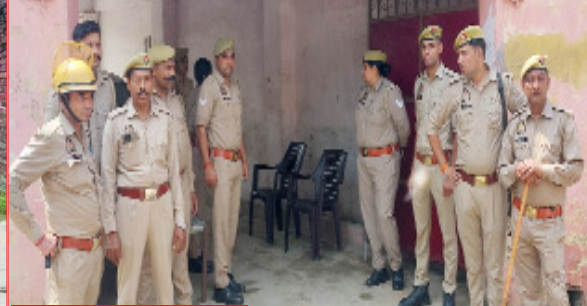
भारी संख्या में तैनात पुलिस