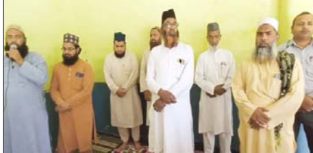
तत्काल रकवाने, बिना किसी शर्त के दोनों देशों के बीच सौज फायर कराने, इज्राइल और अमरिका, फ्रांस, ब्रिटेन को कोई माली इमदाद न करना इज्राइल, अमरिका, फ्रांस और ब्रिटेन के सभी प्रोडक्टों पर रोक लगाने हिन्दुस्तान में रहने वाले मुसलमान नौजवानों को फिलिस्तीन गाजा के मजलूनानों के साथ उनकी इमदाद करने की इजाजत की मांग प्रमुख है प्रबंधक ने भारत सरकार

शाह टाइम्स संवाददाता मुरादाबाद। इजराइल और फिलिस्तीन के बीच चल रही जंग को रकवाने की मदरसा जामिया अरबिया गुलशान मुस्लाफा दौलरा प्रबंधक ने पत्र लिखकर मांग की है।