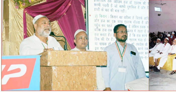
हाजियों को प्रशिक्षण। बिजनौर के एक प्रतिष्ठान में आज हाजियों को प्रशिक्षण दिया गया। उन्हें हज यात्रा के दौरान आने वाली समस्याओं एवं उनसे निपटने के तरीकों के बारे में बताया गया। साथ ही हज के अरकां भी समझाए गए।

समय-समय पर रक्तदान करते रहना चाहिए। रक्तदान करने से शरीर पर कोई कुप्रभाव नहीं पड़ता बल्कि स्वस्थ व्यक्ति द्वारा किए गए इस महादान से किसी जरूरतमंद वीमार इंसान को जान बचाई जा सकती है।