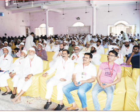
हाजियों को प्रशिक्षण। बिजनौर के एक प्रतिष्ठान में आज हाजियों को प्रशिक्षण दिया गया। उन्हें हज यात्रा के दौरान आने वाली समस्याओं एवं उनसे निपटने के तरीकों के बारे में बताया गया। साथ ही हज के अरकां भी समझाए गए।