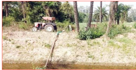
समस्या को शाह टाइम्स ने प्रमुखता से प्रकाशित किया था, जिसके तहत रिवार को नहर में पानी आने से किसानों के चेहरे खिल उठे। किसान

शाह टाइम्स संवाददाता नहरी। गांग नहर में पानी छोड़े जाने से किसानों के चेहरे खिल उठे हैं। किसानों ने अपनी फसलों की सिंचाई करना शुरू कर दिया है। तीन दिन पूर्व शाह टाइम्स ने गांग नहर में पानी न होने से किसानों की फसलें सूखने की कगार पर शीर्षक से किसानों की समस्या को प्रमुखता से प्रकाशित किया था।