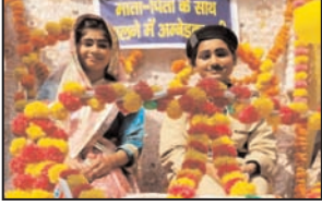
डा. अम्बेडकर के बताए रास्ते पर चलने का आह्वान

शाह टाइम्स ब्यूरो अमरोहा। बाबा साहेब डा. भीमराव अम्बेडकर की जयंती पर नगर में भव्य शोभायात्रा निकाली गई। जिसमें सजी झांकियों ने सभी को मंत्रमुग्ध कर दिया। कई स्थानों पर शोभायात्रा का जोरदार स्वागत किया गया।