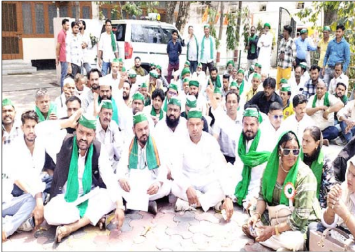
मुजफ्फरनगर: कलेक्ट्रेट पर धरना देते भाकियू मजदूर संयुक्त मोर्चा के कार्यकर्ता।