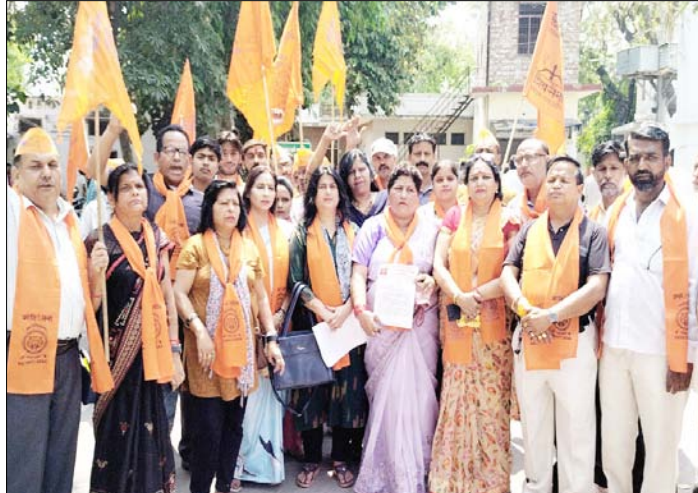
मुजफ्फरनगर: प्राइवेट स्कूलों के विरोध में कलेक्ट्रेट पर प्रदर्शन करते क्रांति सेना के कार्यकर्ता।

मुजफ्फरनगर। जिला पंचायत वार्ड 16 जनपद मुजफ्फरनगर के गांव जागाहडी में संविधान निर्माता भारत रत्न बाबासाहेब डॉक्टर भीमराव अंबेडकर के जन्मदिवस पर केक काटा गया और ग्राम वासियों द्वारा भंडारे के आयोजन में रहने का शुभ अवसर प्राप्त हुआ। इस अवसर पर संगठन में नए पदाधिकारी को शामिल किया गया और ग्राम वासियों ने डोल नगाडों के साथ स्वागत किया। उसके लिए उनका तहे दिल से हार्दिक आभार।