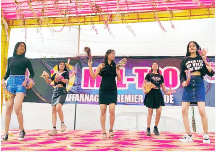
मुजफ्फरनगर: चौबर गर्ल्स फाइनल मुक़ाबले में आकर्षण का केन्द्र रहीं।

यातायात व्यवस्था सुदृढ़ रखने एवं दुर्घटनाओं की रोकथाम के लिए वरिष्ठ पुलिस अधीक्षक अभिषेक सिंह के निर्देशन में तथा एसपी टैफिक अतुल कुमार चौबे के नेतृत्व में यातायात पुलिस द्वारा लगातार कार्यवाही की जा रही है। इसी क्रम में मंगलवार को यातायात पुलिस द्वारा स्कूली ई-रिक्शा से अतिरिक्त सीट को हटवाया गया तथा कार्यवाही की गयी। साथ ही स्कूलों की वैन आदि वाहनों की फिटनेस को चौक किया गया जिससे किसी वाहन आदि से कोई आकस्मिक दुर्घटना होने से रोका जा सके। इस कार्यवाही में आज 25 स्कूली ई-रिक्शा से अतिरिक्त सीट को हटवाकर जविकरण की कार्यवाही की गयी है। दिनभर चले अभियान से अवैध रिक्शा चालकों में हडकंप मचा रहा और वह संकोर गलियों से गुजरे।