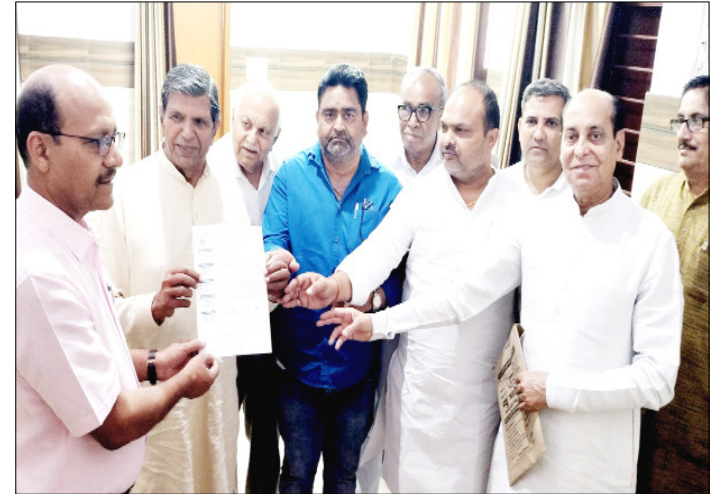
मुजफ्फरनगर: डीएम को जापन सौंपते कल्याण देव युवा समिति के सदस्य।