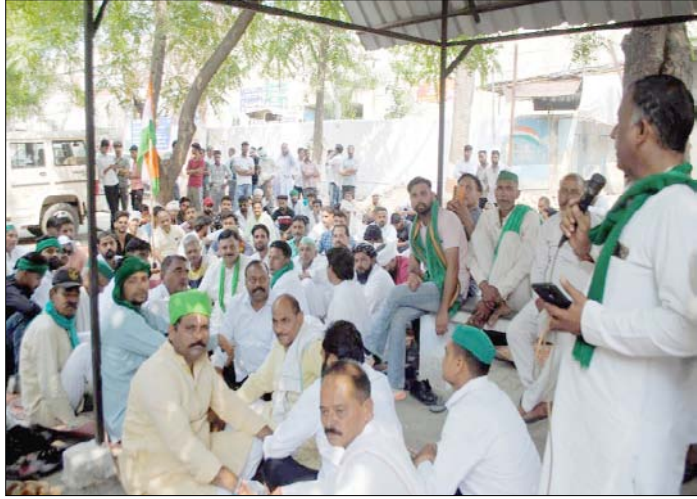
देवबन्द। एसडीएम कार्यालय पर प्रदर्शन के दौरान विचार व्यक्त करते वक्ता