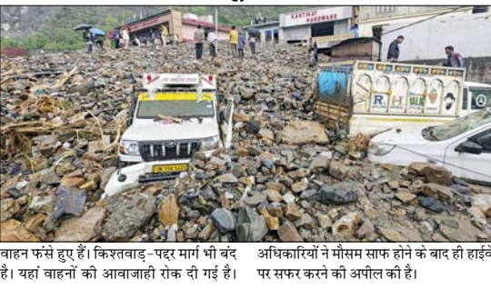
बाहन फंसे हुए हैं। किश्तबाड़-पहर मार्ग भी बंद है। यहां बाहनों की आवाजाही रोक दी गई है। अधिकारियों ने मौसम साफ होने के बाद ही हाईवे पर सफर करने की अपील की है।

रामबन में 100 लोगों का रेस्क्यू श्रीनगर। जम्मू-कश्मीर में पिछले कई दिनों से बारिश हो रही है। रामबन जिले के सेरी बागना इलाके में रविवार सुबह बारिश के बाद बादल फटने से 3 लोगों की मौत हो गई। पुलिस ने करीब 100 लोगों को रेस्क्यू किया। सूत्रों ने बताया कि बादल फटने से अचानक बाढ़ आ गई। पहाड़ का मलबा गांव की तरफ आ गया, जिसकी चपेट में कई लोग और घर आ गए। फिलहाल रेस्क्यू ऑपरेशन जारी है। उधर, रामबन जिले के बनिहाल इलाके में कई जगह लैंडस्लाइड हुई हैं। इसकी वजह से जम्मू-श्रीनगर नेशनल हाईवे बंद कर दिया गया है। सैकड़ों