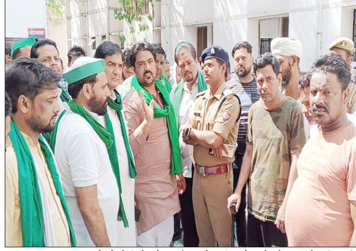
मुजफ्फरनगर : चबूतरा तोड़ने के विरोध में प्रदर्शन करते भाकियू नेताओं को समझाते अधिकारी

इत्यादि मार्केट बना रहे हैं। उनके घर के सामने पुराने चबूतरों को लेकर विवाद कर रहे हैं। चबूतरा के साथ एक शौचालय भी है। जिसे अवैध रूप से तुड़वा दिया गया। इस मामले की शिकायत नगर पालिका में भी की गई है। इस संबंध में चबूतरा और शौचालय संबंधित कागजात भी दिखाए हैं। अब कुछ लोग इस मामले में पीड़ित को धमकी दे रहे हैं। इस पर भाकियू कार्यकर्ताओं ने धरना दिया। कार्यकर्ताओं ने मामले में आरोपित पक्ष के विरुद्ध जांच कर कार्रवाई की मांग की। पुलिस ने जांच के बाद आरोपित पक्ष के विरुद्ध कड़ी कार्रवाई का आवासन दिया। उसके बाद कार्यकर्ताओं ने धरना समाप्त किया।