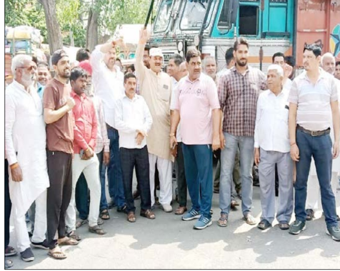
मुजफ्फरनगर : भोपा रोड पर पेपर मिल की राख के विरोध में प्रदर्शन करते लोग

इस राख से आंखों में जलन और अन्य स्वास्थ्य संबंधी समस्याएं हो रही हैं। साथ ही, राख घरों में जाकर वातावरण को भी प्रदूषित कर रही है। स्थानीय निवासियों ने प्रशासन से मांग की कि पेपर मिल की प्रदूषणकारी गतिविधियों पर तत्काल प्रभाष से अंकुश लगाया जाए। प्रदर्शन की सूचना मिलते ही मंडी कोतवाली पुलिस मौके पर पहुंची और लोगों को समझाकर जाम खुलवाया। लोगों ने चेतावनी दी कि गिरि जल्द समाधान नहीं हुआ, तो उग्र आंदोलन किया जाएगा।