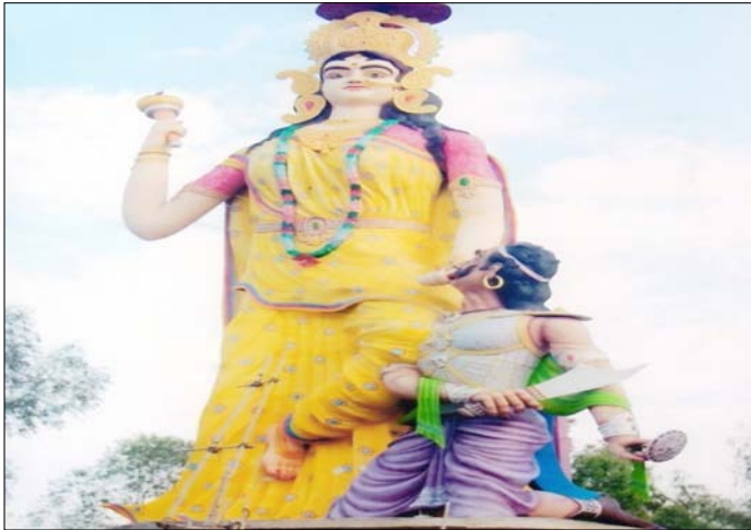
मोरना : शुक्रतीर्थ पांडव कालीन माता पार्वती मंदिर में मां बगलामुखी पीतांबरा की प्रतिमा