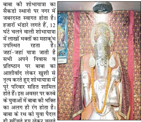
डीजे, हलवाई बुक कर दिए गए हैं। श्री बालाजी धाम मंदिर सेवा समिति की कमेटी की बहुत सुंदर व्यवस्था के साथ सभी तैयारी पूर्ण कर ली गई है। इस अवसर पर पुलिस प्रशासन की व्यवस्था भी प्रशंसनीय रहती है।

शाहपुर। नगर में करोड़ों रूपये की लागत से निर्मित सिद्धपीठ बालाजी धाम के वार्षिकोत्सव पर नगर में हर वर्ष निकलने वाली ऐतिहासिक एवं भव्य शोभायात्रा में लाखों भक्तों का महाकुंभ उपस्थित रहता है। जहाँ-जहाँ यात्रा जाती है सभी अपने निवास व प्रतिष्ठान पर बाबा का आशीर्वाद लेकर खुशी से नृत्य करते हुए शोभायात्रा में पूरे परिवार सहित शामिल होते हैं। इस अवसर पर कस्बे के युवाओं में बाबा की भक्ति का अलग ही रंग होता है। बाबा के रथ को युवा पैदल ही खींचते हुए लेकर चलते हैं, इससे पहले युवाओं को टोलियां रथ के आगे जबरदस्त सफाई पानी का छिड़काव करती हुई चलती हैं, पूरे नगर को अद्भुत लाइटों से सजाया गया है जगह जगह तोरण द्वार व झंडे लगाए जाते हैं, सभी