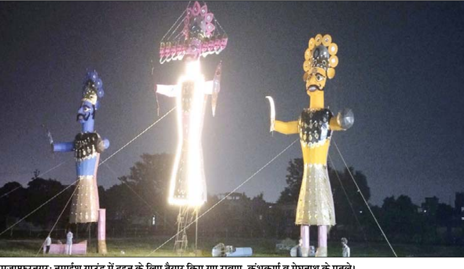
मुजफ्फरनगर: नुमाईश ग्राउंड में दहन के लिए तैयार किए गए रावण, कुंभकर्ण व मेघनाथ के पुतले।