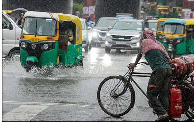
नई दिल्ली: दिल्ली-एनसीआर में बादल और बारिश ने नौसम का मिजाज पूरी तरह बदल दिया, तापमान में गिरावट और प्रदूषण स्तर में सुधार से लोगों को गर्मी और उमस से राहत मिली है। बारिश के बीच से गुजरते वाहन।