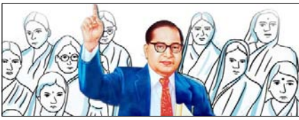
भाजपा का महिला सशक्तिकरण: वास्तविकता और दिखावा समादकीय