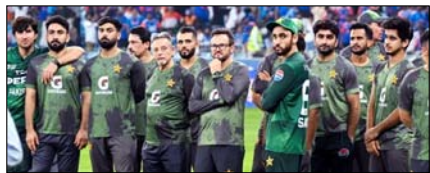
पाकिस्तानी खिलाड़ी अब विदेशी टी-20 लीग नहीं खेल सकेंगे खेल टाइम्स