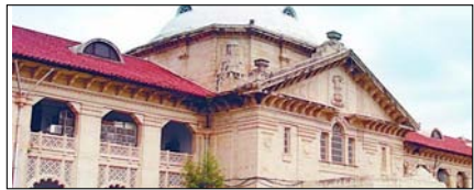
विवाह जब तक रद्द नहीं हो जाता, पत्नी भरण पोषण की हकदार: हाईकोर्ट पेज 2

नई दिल्ली, मुजफ्फरनगर, देहरादून, हल्द्वानी, गुरदासपुर, बरेली, मेरठ व लखनऊ से प्रकाशित