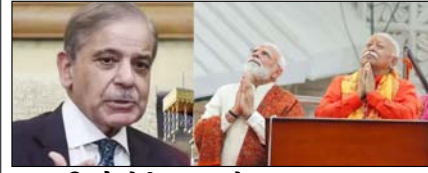
राम मंदिर में मोदी का ध्वजारोहण नाजायज: पाक