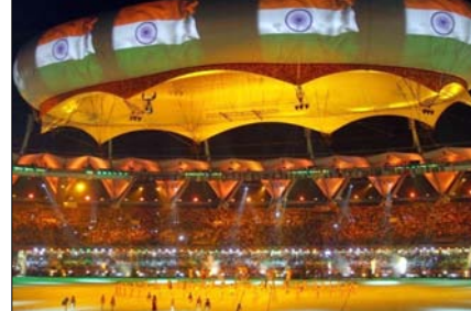
2030 में अहमदाबाद में होंगे गेम्स, ओलिंपिक 2036 की दावेदारी मजबूत होगी

भारत 15 साल के बाद कॉमनवेल्थ गेम्स की मेजबानी कर रहा है। इससे पहले 2010 में नई दिल्ली में इन गेम्स का आयोजन किया गया था। तब भारतीय खिलाड़ियों ने 38 गोल्ड समेत 101 मेडल जीते थे। ग्लासगो में कॉमनवेल्थ स्पोर्ट्स एजेंसिटी बोर्ड की बैठक के बाद अहमदाबाद को अधिकृत तौर पर होस्ट सिटी घोषित किया गया। भारत में पहली बार दिल्ली के बाहर मल्टी स्पोर्ट्स इवेंट होगा अगर अहमदाबाद को 2030 की मेजबानी मिलती है, तो यह पहली बार होगा जब कोई बड़ा इंटरनेशनल मल्टी-स्पोर्ट्स इवेंट दिल्ली के बाहर आयोजित होगा। भारत 2010 के कॉमनवेल्थ गेम्स, 1951 और 1982 एशियन गेम्स की मेजबानी भी कर चुका है। 3 बड़े मल्टी-स्पोर्ट्स इवेंट दिल्ली में हुए थे। अहमदाबाद में कॉमनवेल्थ गेम्स 2030 के