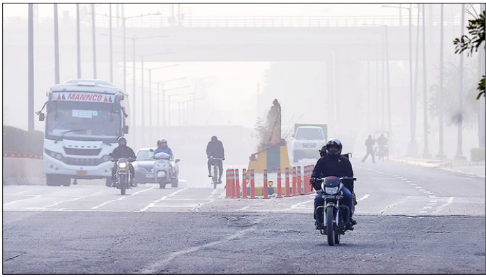
नोएडा। शहर की वायु गुणवत्ता लगातार खराब होने के कारण कम दृश्यता के बीच जाते यात्री।