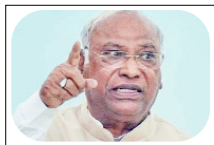
कांग्रेस अध्यक्ष ने कहा: आरएसएस ने संविधान को बताया था 'पारचात्य मूल्यों' पर आधारित

कांग्रेस अध्यक्ष मल्लिकार्जुन खड़गे ने बुधवार को संविधान दिवस पर राष्ट्रीय स्वयंसेवक संघ (आरएसएस) पर निशाना साधते हुए कहा कि उसने संविधान को पारचात्य मूल्यों को आधारित बताया था और संविधान निर्माता डा. भीमराव आंबेडकर का पुतला फूँका था।