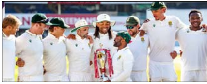
दक्षिण अफ्रीका का क्वीन स्वीप, भारत में 25 साल बाद जीती टेस्ट सीरीज