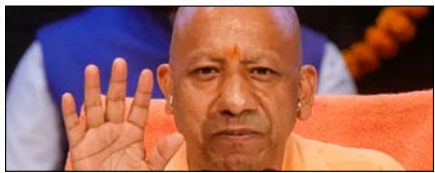
कर्तव्य के बिना अधिकार नहीं हो सकता: योगी

नई दिल्ली, मुजफ्फरनगर, देहरादून, हल्द्वानी, मुरादाबाद, बरेली, मेरठ व लखनऊ से प्रकाशित