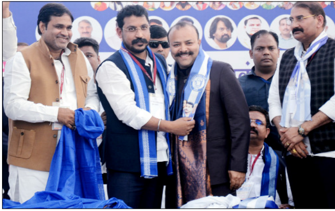
शाह टाइम्स ब्यूरो

मुजफ्फरनगर। आजाद समाज पार्टी (आसपा) अध्यक्ष एवं नगीना सांसद चंद्रशेखर ने एसआईआर के जरिये वोट चोरी रोकने का संकल्प दिलाने के साथ एक जनवरी से बरोजगारी व ईवीएम से वोटिंग बंद कराने के लिए राज्यव्यापी आंदोलन की घोषणा की। उन्होंने कहा कि किसानों के लिए गन्ना मूल्य 500 रुपये प्रति कुंतल करने और वेस्ट यूपी में हाईकोर्ट बंच बनाने का वादा भी किया। चंद्रशेखर आजाद ने कहा कि सत्ता के लिए मनुवादी और अंबेडकर वादी विचारधारा में