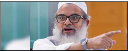
जिहाद जैसे शब्दों पर मौलाना महमूद मदनी ने जताई आपत्ति पेज 2

नई दिल्ली, मुजफ्फरनगर, देहरादून, हल्द्वानी, मुरादाबाद, बरेली, मेरठ व लखनऊ से प्रकाशित