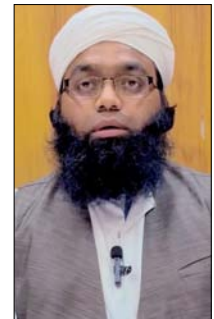
एसटीएफ और लोकल पुलिस के साथ भोर में दिया कार्रवाई को अंजाम