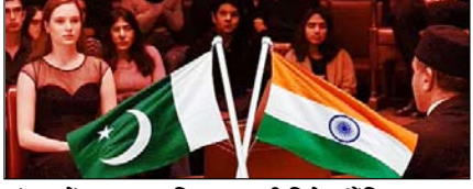
लंदन में भारत-पाकिस्तान की डिबेट कैंसिल, पाक ने भारत पर लगाया पीछे हटने का आरोप पेज 11