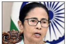
ममता बोली थीं- गोली मार दो, लेकिन धर्म के आधार पर बंटवारा नहीं होगा

कोलकाता। पश्चिम बंगाल में ममता सरकार 8 महीने के विरोध के बाद नए वक्फ संशोधन कानून को लागू करने पर राजी हो गई है। राज्य सरकार ने सभी जिलाधिकारियों को निर्देश दिया है कि राज्य की 8063 वक्फ संपत्तियों की जानकारी 6 दिसम्बर 2025 तक केंद्र सरकार को यूएमआईडी वेबसाइट पर अपलोड करें। वक्फ संशोधन कानून इस साल 4 अप्रैल को संसद के दोनों सदन में पास हुआ था। तब पश्चिम बंगाल ने इसे अपने राज्य में लागू करने से मना कर दिया था। पश्चिम बंगाल में ममता देवी है, मुस्लिम समुदाय की संपत्ति की रक्षा करेगी। चाहे कोई गोली मार दे, मुझे एकता से अलग नहीं किया जा सकता। बंगाल में धर्म के नाम पर बंटवारा नहीं होगा। कानून को अदालत में चुनौती दी गई है, लेकिन सुप्रीम कोर्ट ने नए प्रावधानों के लागू होने पर कोई रोक नहीं लगाई। इसलिए कानूनी रूप से राज्य सरकार पर इसे लागू करने की बाध्यता है। केंद्र सरकार का साफ निर्देश है कि सभी अविवादित वक्फ संपत्तियों का रिकॉर्ड डेडलाइन -शेष पृष्ठ दो पर