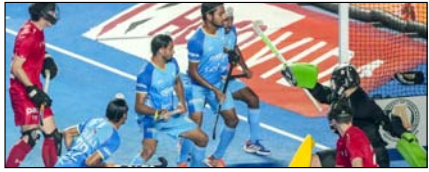
सुल्तान अजलान शाह कप: कनाडा को 14-3 से रौंदकर भारत फाइनल में खेल टाइम्स