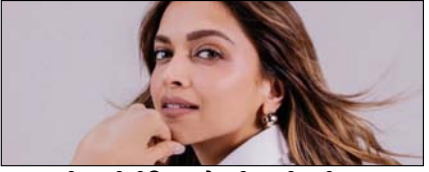
रणवीर नहीं दीपिका को पड़ी रणवीर की जरूरत बैलीबुड