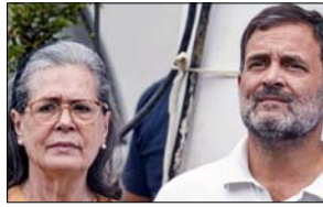
आरोपियों में सोनिया गांधी और राहुल गांधी के नाम शामिल