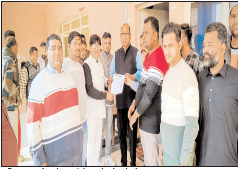
हसनपुर। एसडीएम को ज्ञापन सौंपते एमआईएम के कार्यकर्ता।