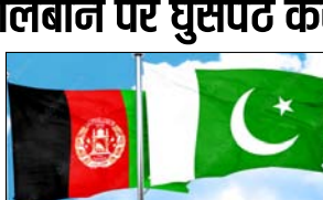
फायरिंग का मकसद आतंकियों को पार कराना और तस्करों की गाड़ियों को आगे बढ़ाना होता है

इस्लामाबाद। पाकिस्तान और अफगानिस्तान के बीच तनाव एक बार फिर बढ़ गया है। पाकिस्तान सेना ने आरोप लगाया है कि अफगान तालिबान देश में आतंकियों को घुसपैठ में मदद कर रहा है। सेना का दावा है कि अफगान सीमा चौकियां न सिर्फ पाकिस्तानी पोस्टों पर फायरिंग कर रही हैं बल्कि इस दौरान आतंकियों और तस्करों को सीमा पार कराने के लिए कवच भी दे रही हैं। आईएसपीआर प्रमुख लेफ्टिनेंट जनरल अहमद शरीफ चौधरी ने पत्रकारों से बातचीत में यह गंभीर आरोप लगाए। उनके अनुसार, अफगान तालिबान की तरफ से सीमा पर तेनात पाकिस्तानी पोस्टों पर फायरिंग की जाती है और उसी समय आतंकियों व तस्करों को खाली जगहों से पाकिस्तान में प्रवेश कराया जाता है। उन्होंने कहा कि दोनों देशों की सीमा चौकियां आमतौर पर परस्पर सुरक्षा सुनिश्चित करती हैं, लेकिन मौजूदा हालात