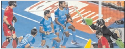
सुल्तान अजलान शाह कप: कनाडा को 14-3 से रौंदकर भारत फाइनल में खेल टाइम्स