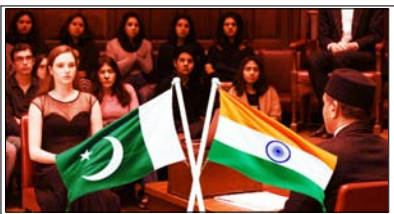
1823 में स्थापित ओयू को ऑक्सफोर्ड यूनिवर्सिटी के छात्र चलाते हैं। यह यूनिवर्सिटी का आधिकारिक हिस्सा नहीं है यह एक आजाद छात्र संगठन है