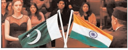
लंदन में भारत-पाकिस्तान की डिबेट कैंसिल, पाक ने भारत पर लगाया पीछे हटने का आरोप पेज 11