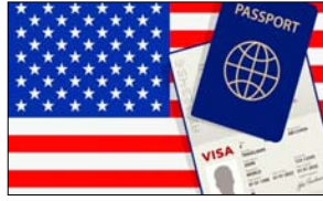
अमेरिका के लिए अब अपने देश और अपने लोगों की सुरक्षा से बड़ी कोई प्राथमिकता नहीं है

वॉशिंगटन। अमेरिका की ट्रम्प सरकार ने वॉशिंगटन डीसी में गोलीबारी की घटना के बाद शुरुआत से अफगानियों के वीजा पर रोक लगा दी है। साथ ही अमेरिकी विदेश विभाग ने अफगान नागरिकों के लिए वीजा जारी करने पर भी रोक लगा दी है। अमेरिका के विदेश मंत्री मार्को रूबियो ने सोशल मीडिया पर जारी पोस्ट में लिखा कि राष्ट्रपति ट्रम्प के विदेश विभाग ने अफगानिस्तान के सभी लोगों को वीजा जारी करने पर रोक लगा दी है। अमेरिका के लिए अब अपने देश और अपने लोगों की सुरक्षा से बड़ी कोई प्राथमिकता नहीं है। विदेश विभाग के फैसले के बाद अमेरिकी सरकार ने देशभर में सभी शरण संबंधी फैसलों को भी तुरंत प्रभाव से रोक दिया है। वीते बुधवार को अमेरिका की राजधानी वॉशिंगटन डीसी में बेहद सुरक्षित माने जाने वाले इलाके में हुई गोलीबारी के बाद ट्रम्प प्रशासन ने यह सख्त कदम उठाया है। इस गोलीबारी में नेशनल गार्ड्स