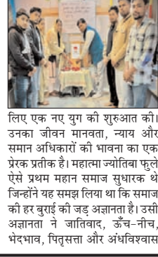
विद्यार्थियों को शिक्षा के प्रति प्रेरक प्रतीक है। महात्मा ज्योतिबा फुले ऐसे प्रथम महान समाज सुधारक थे जिन्होंने यह समझ लिया था कि समाज की हर बुराई को जड़ अज्ञानता है। उसी अज्ञानता ने जातिवाद, कँच-नीच, भेदभाव, पितृसत्ता और अंधविश्वास