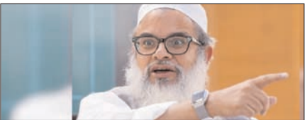
जिहाद जैसे शब्दों पर मौलाना महमूद मदनी ने जताई आपत्ति पेज 2

नई दिल्ली, मुजफ्फरनगर, देहरादून, हल्द्वानी, मुरादाबाद, बरेली, मेरठ व लखनऊ से प्रकाशित