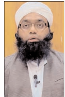
एसटीएफ और लोकल पुलिस के साथ भोर में दिया कार्रवाई का अंजाम