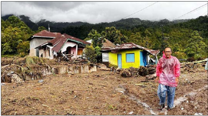
इंडोनेशिया। पश्चिमी सुमात्रा के मलालाक में बाढ़ से प्रभावित गांव में क्षतिग्रस्त घरों के पास से गुजरते लोग।

ए-320 परिवार के विमानों में अनिवार्य मॉडिफिकेशन का निर्देश नई दिल्ली। भारत सहित दुनिया भर में एयरबस के ए-320 परिवार के विमानों के लिए अनिवार्य हार्डवेयर और सॉफ्टवेयर अपडेट के आदेश जारी किए गए जिससे उड़ानें प्रभावित हो रही हैं। एयर इंडिया के बेड़े में ए-320 परिवार के 104 विमान हैं। इंडिगो के पास 318 और एयर इंडिया एक्सप्रेस के पास 40 विमान ए-320 परिवार के हैं। इस प्रकार देश में इस समय ए-320 परिवार के कुल 462 विमान परिचालन में हैं। सूत्रों ने बताया कि करीब 300 विमानों पर मॉडिफिकेशन की जरूरत होगी।