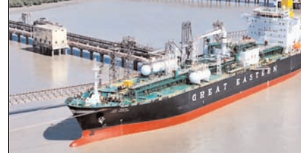
टैंकर 11 अप्रैल को स्ट्रेट ऑफ होर्मुज पार कर आगे बढ़ा था। यह हाल के दिनों में क्षेत्र में घोषित दो सप्ताह के युद्धविराम के बाद इस मार्ग से गुजरने वाला पहला भारतीय जहाज है। सरकारी अधिकारियों के अनुसार, यह जहाज मार्च की शुरुआत के बाद फारस की खाड़ी से बाहर निकलने वाला नौवां भारतीय जहाज है। हालांकि अभी भी करीब 15 भारतीय ध्वज वाले जहाज क्षेत्र में मौजूद हैं और आगे के मार्ग के लिए इंतजार कर रहे हैं। रूस ने एक बार फिर संकेत दिया है कि वह ईरान के

नई दिल्ली। पश्चिम एशिया में जारी तनाव के बीच भारत के लिए राहत भरी खबर सामने आई है। भारतीय ध्वज वाला जहाज जग विक्रम करीब 20,400 मीट्रिक टन एलपीजी लेकर गुजरात के कांडला स्थित दीनदयाल पोर्ट अथॉरिटी पर पहुंच गया है। पोर्ट अथॉरिटी के अनुसार यह जहाज दीनदयाल बंदरगाह प्राधिकरण कांडला में मंगलवार रात आंख जेटी-1 पर सुरक्षित रूप से लंगर डाल चुका है। अधिकारियों ने बताया कि यह