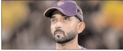
धीमी ओवर गति के लिए अजिंक्य रहाणे पर 12 लाख रुपये का जुर्माना लगा