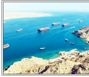
यह डील ऐसे समय हुई है जब यूएस ने इरान पर दबाव बढ़ाने के लिए होर्मुज में नाकाबंदी शुरू कर दी है

वाशिंगटन। होर्मुज स्ट्रेट में इस समय हालात काफी तनाव भरे हैं। अमेरिका वहां इरान से जुड़े जहाजों की गतिविधियों पर सख्ती कर रहा है। इसी बीच अमेरिका और इंडोनेशिया के बीच 13 अप्रैल को एक नया रक्षा समझौता हुआ है। इस समझौते के तहत अब अमेरिकी सैन्य विमानों को इंडोनेशिया के हवाई क्षेत्र में ज्यादा आसानी से आने-जाने की इजाजत मिल गई है। इस आधिकारिक तौर पर दोनों देशों के बीच सहयोग बढ़ाने का कदम बताया जा रहा है, लेकिन इसकी टाइमिंग को लेकर सवाल उठ रहे हैं। यह डील ऐसे समय हुई है जब यूएस ने इरान पर दबाव बढ़ाने के लिए होर्मुज में नाकाबंदी शुरू कर दी है। इसके बाद तेल सप्लाई लगभग ठहर गई और कीमतें 100 डॉलर प्रति बैरल से ऊपर पहुंच गई हैं। ऐसे में माना जा रहा है कि अमेरिका ने मलक्का स्ट्रेट पर नजर रखने के लिए यह करार किया है। मलक्का स्ट्रेट दुनिया के सबसे व्यस्त समुद्री रास्तों में से एक है। यह वही रास्ता है जो हिंद महासागर को पूर्वी एशिया से जोड़ता है और दुनिया के सबसे व्यस्त समुद्री रास्तों में से एक है। यहां से करीब 40 प्रतिशत वैश्विक व्यापार और लगभग 30 प्रतिशत तेल