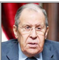
यदि अमेरिकी हमले नहीं होते, तो इरान होर्मुज स्ट्रेट को बंद नहीं करता

बीजिंग। रूस ने बुधवार को इरान के संवर्धित यूरेनियम के भंडार के समाधान में सहायता करने की अपनी पेशकश को दोहराया है। यह पेशकश ऐसे समय में आई है जब अगले कुछ दिनों में अमेरिका और इरान के बीच नए दौर की वार्ता की संभावना जताई जा रही है। रूसी समाचार एजेंसी तास के अनुसार, रूस के विदेश मंत्री सर्गेई लावरोव ने कहा कि रूस इरान के अत्यधिक संवर्धित यूरेनियम को ईंधन-ग्रेड सामग्री में बदलने या उसे इस तरह से संशोधित करने में मदद कर सकता है जिससे इरान के 'शांतिपूर्ण संवर्धन के अधिकार' का उल्लंघन न हो। रूस की यह पेशकश अमेरिकी राष्ट्रपति डोनाल्ड ट्रम्प के उस बयान के बाद आई है जिसमें उन्होंने कहा था कि