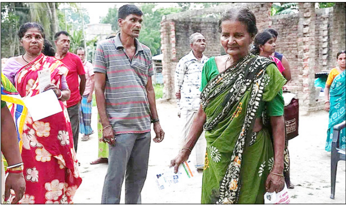
गैथाटा। करला गांव के कई मतदाता जिनका नाम मतदाता सूची से हटा दिया गया है, चुनाव के बाद की स्थिति को लेकर चिंतित होते हुए।

अंडमान सागर में नाव डूबी, 250 रोहिंग्या-बांग्लादेशी लापता, मलेशिया जा रहे थे ढाका। अंडमान सागर में एक नाव डूबने से करीब 250 रोहिंग्या और बांग्लादेशी नागरिक लापता हो गए हैं। रोहिंग्या और बांग्लादेशी नागरिकों के मुताबिक, यह हादसा पिछले हफ्ते खराब मौसम और ओवरलोडिंग के कारण हुआ। यह ट्रालर बांग्लादेश से मलेशिया जा रहा था। बांग्लादेश कोस्ट गार्ड ने 9 अप्रैल को अपने एक जहाज के जरिए 9 लोगों को बचाया, लेकिन बाकी लोगों का अब तक कोई पता नहीं चल पाया है। रोहिंग्या समुदाय 2017 में म्यांमार में हुई हिंसा के बाद बड़ी संख्या में बांग्लादेश में शरण लेने को मजबूर हुआ था। म्यांमार की सरकार उन्हें नागरिकता नहीं देती। वहीं, बांग्लादेश के शरणार्थी कैंपों में खराब हालात के चलते कई लोग मलेशिया जैसे देशों में बेहतर ज़िंदगी की तलाश में खतरनाक समुद्री सफर करते हैं।