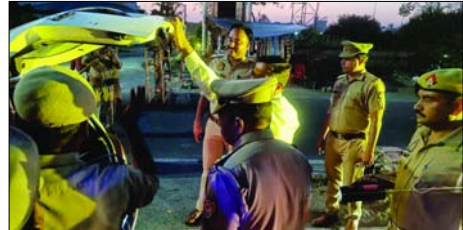
पुलिस ने स्पष्ट किया कि यातायात नियमों का उल्लंघन करने वालों के खिलाफ मोटर वाहन अधिनियम के तहत सख्त कार्रवाई की जा रही है। अभियान के दौरान कई नियम तोड़ने वाले वाहन चालकों पर नियमानुसार विधिक कार्रवाई भी की गई। पुलिस प्रशासन ने आमजन से अपील की है कि वे अपनी और दूसरों की सुरक्षा को ध्यान में रखते हुए यातायात नियमों का पालन करें, जिससे सड़क दुर्घटनाओं पर प्रभावी रोक लगाई जा सके और सुरक्षित यात्रा सुनिश्चित हो।

शाह टाइम्स संवाददाता रामपुर। अपर पुलिस अधीक्षक के नेतृत्व में बुधवार को थाना गंज और कोतवाली क्षेत्र में सघन वाहन चेकिंग अभियान चलाया गया। अभियान के दौरान पुलिस टीम ने विभिन्न स्थानों पर वाहनों की गहन जांच की और यातायात नियमों का पालन सुनिश्चित कराया। चेकिंग के दौरान वाहन चालकों को सड़क सुरक्षा के प्रति जागरूक करते हुए शाव पीकर वाहन न चलाने की सख्त हिदायत दी गई। दोपहरिया वाहन चालकों को अनिवार्य रूप से हेलमेट पहनने तथा वायुप्रदूषण वाहन चालकों को सीट बेल्ट का प्रयोग करने के लिए प्रेरित किया गया।