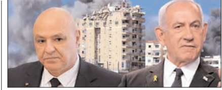
इजरायल-लेबनान ने तीन दशक बाद की सीधी बातचीत