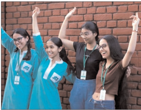
सक्रिय हो गए और एक फ्लैश संदेश के जरिये परिणामों की घोषणा की गई। सीबीएसई की नई ट्रि-बोर्ड प्रणाली के तहत, इस बार कक्षा 10वीं के नतीजे

नई दिल्ली। केंद्रीय माध्यमिक शिक्षा बोर्ड (सीबीएसई) ने इस वर्ष देशभर के 22 रीजन में घोषित किए गए हाईस्कूल परिणामों में कुल 93.70 फीसदी छात्र-छात्राएं सफल हुए हैं। इस बार भी परिणामों में लड़कियों ने बाजी मारी है और बेहतर प्रदर्शन के साथ अपनी बढ़त कायम रखी है। इस साल त्रिवेन्द्रम रीजन ने शानदार प्रदर्शन करते हुए 99.79 फीसदी के साथ देश में पहला स्थान हासिल किया। नोएडा रीजन का प्रदर्शन इस बार गिरा है। यहाँ पास प्रतिशत 87.66 फीसदी रहा, जो पिछले साल के 90.75 फीसदी के मुकाबले 3.09 फीसदी कम है। इसके साथ ही परीक्षा देने वाले 25 लाख से अधिक छात्रों का इंजागर खत्म हो गया। बुधवार शाम 4 बजे उमंग और डिजिटलकर सहित सभी सरकारी पोर्टल