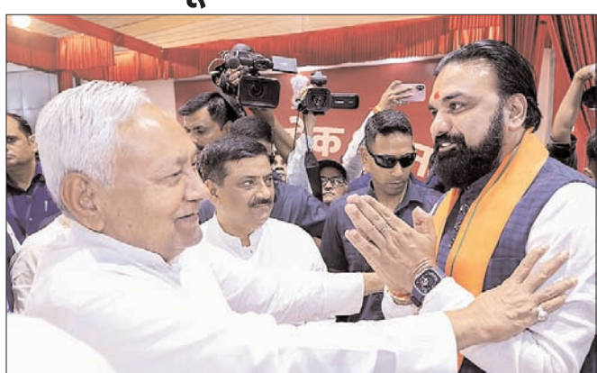
मुख्यमंत्री सम्राट चौधरी ने गृह समेत 29 विभाग रखे

भाजपा नेता सम्राट चौधरी ने बुधवार को मुख्यमंत्री पद की शपथ ली। मुख्यमंत्री बनते ही विभागों के प्रारंभिक बंटवारे की अधिसूचना जारी कर दी है। अधिसूचना के तहत मुख्यमंत्री सम्राट चौधरी ने गृह, सामान्य प्रशासन, नगर विकास, स्वास्थ्य, कृषि, उद्योग, पथ निर्माण समेत कुल 29 विभाग अपने पास रखे, जबकि दोनों उप मुख्यमंत्री को मिलाकर जनता दल यूनाइटेड को मात्र 18 विभाग दिए गए। गृह विभाग सहित मंत्रिमंडल सचिवालय, निगरानी, निर्वाचन, राजस्व एवं भूमि सुधार, खान एवं भू तत्व, नगर विकास एवं आवास, स्वास्थ्य, विधि, उद्योग, पथ निर्माण, कृषि, लघु जल संसाधन, श्रम संसाधन एवं प्रवासी श्रमिक कल्याण, युवा रोजगार एवं कौशल विकास, पर्यटन, कला एवं संस्कृति, डेयरी मत्स्य एवं पशु