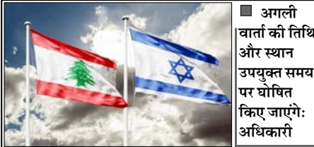
अगली वार्ता की तिथि और स्थान उपयुक्त समय पर घोषित किए जाएंगे: अधिकारी

हिजबुल्लाह के प्रभाव को समाप्त करने को लेकर 'रुख में समानता' देखने को मिली