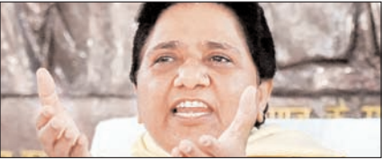
महिला आरक्षण में SC, ST और OBC महिलाओं के लिए कोटा सुनिश्चित हो: मायावती

नई दिल्ली, मुजफ्फरनगर, देहरादून, हल्द्वानी, मुतादाबाद, बरेली, मेरठ व लखनऊ से प्रकाशित