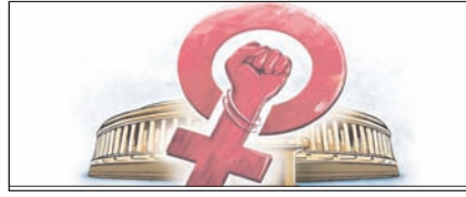
सही समय: महिला आरक्षण से बदलेगी भारतीय लोकतंत्र की तस्वीर