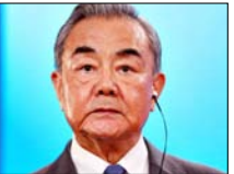
सामान्य आवागमन फिर से बहाल करने के प्रयास अंतर्राष्ट्रीय समुदाय की ओर से एक सर्वसम्मत आह्वान का प्रतिनिधित्व करते हैं। वांग ने कहा कि वर्तमान स्थिति युद्ध और शांति के बीच एक नाजुक मोड़ पर खड़ी है लेकिन इसके साथ उन्होंने यह भी कहा कि कूटनीतिक समाधान के लिए अवसर को धरवाजा भी खुल रहा है। ईरानी

बीजिंग। चीन के विदेश मंत्री वांग इं ने अपने ईरानी समकक्ष अब्बास अराघची से कहा है कि होमज जलडमरूमध्य को खोलना अंतर्राष्ट्रीय समुदाय की सर्वसम्मत मांग है। वांग ने ईरान के विदेश मंत्री अब्बास अराघची से फोन पर बात करते हुए इस बात पर जोर दिया कि एक और जहां ईरान की संप्रभुता, सुरक्षा और एक तटीय राज्य के रूप में उसके वैध अधिकारों के सम्मान की आवश्यकता है, वहीं दूसरी ओर इस जलडमरूमध्य से नौहन की स्वतंत्रता और समुद्री सुरक्षा को गारंटी भी दी जानी चाहिए वांग ने कहा कि इस जलडमरूमध्य से