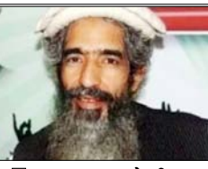
यह एक साल से भी कम समय में दूसरा मौका है, जब हमजा पर हमला हुआ है

लाहौर। पाकिस्तान के लाहौर में आतंकी संगठन लश्कर-ए-तैयबा (एलईटी) के संस्थापक सदस्य आमिर हमजा पर अज्ञात हमलावरों ने गोली चला दी। हमले के बाद उन्हें अस्पताल में भर्ती कराया गया है, जहां उनकी हालत गंभीर बताई जा रही है। मीडिया रिपोर्ट्स के मुताबिक, हमलावरों ने लाहौर में एक न्यूज चैनल के दफ्तर के बाहर उन पर फायरिंग की। हमला किसने और क्यों किया, अब भी साफ नहीं हो पाया है। यह एक साल से भी कम समय में दूसरा मौका है, जब हमजा पर हमला हुआ है। इससे पहले पिछले साल मई में भी उनसे घर के बाहर अज्ञात लोगों ने उन्हें गोली मारी थी। पिछले हमले के बाद उन्हें अस्पताल ले जाया गया था। इसके बाद पाकिस्तानी अधिकारियों ने उनकी सुरक्षा बढ़ा दी