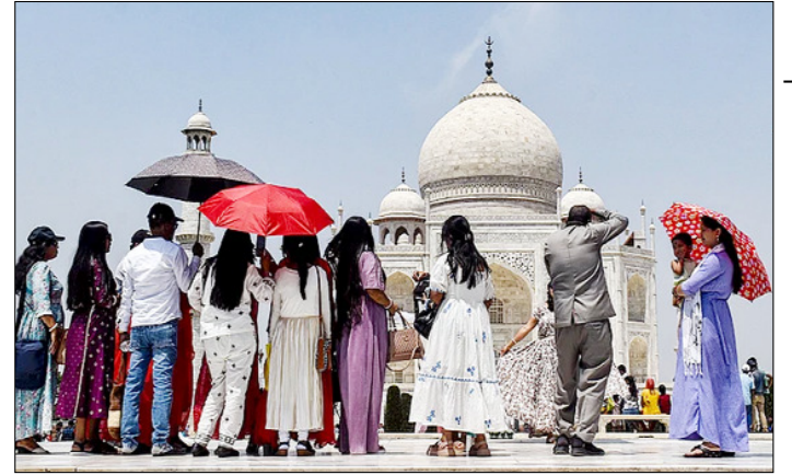
अगरा। गीष्ण गर्मी के बीच ताजमहल का दौरा करते पर्यटक।