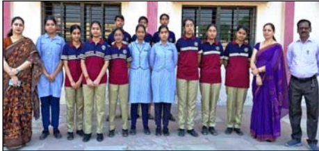
अभिभावकों और शिक्षकों की मेहनत की भी परिणाम है। वहीं अभ्यास और अंतिम चौपरी ने बच्चों को शूकामाएँ देते हुए कहा कि अच्छे अंकों से सफलता की कुंजी है। मेहनत, अनुशासन और निरंतर अध्ययन ही सफलता की कुंजी है।