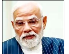
दोनों देश रक्षा, समीकन्डक्टर, क्वांटम और जैव प्रौद्योगिकी के क्षेत्र में भी अपनी साझेदारी को सुदृढ़ करेंगे

नई दिल्ली। प्रधानमंत्री नरेंद्र मोदी ने कहा है कि ऑस्ट्रिया के चांसलर क्रिश्चियन स्टॉकर को भारत यात्रा से दोनों देशों के बीच व्यापार और निवेश के क्षेत्र में नई ऊर्जा आएगी और ऑस्ट्रिया की विभिन्न क्षेत्रों में विशेषज्ञता तथा भारत की गति और पैमाना दुनिया के लिए विश्वसनीय आपूर्ति श्रृंखला सुनिश्चित करेगा। दोनों देश रक्षा, समीकन्डक्टर, क्वांटम और जैव प्रौद्योगिकी के क्षेत्र में भी अपनी साझेदारी को सुदृढ़ करेंगे।