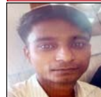
टक्कर मार दी। जिनमें बहू भंगीरू रूप से शायल हो गए। हादसे की सूचना पाकर पुलिस पहुंची। वाहन गिराव में सोएरमसी में लगा था। जांच पर विचारकों में देखते ही उनकी मृत

शाह टाइम्स संवाददाता, गजरीला। होटल पर काम करके घर वापस लौट रहे युवक की अज्ञात वाहन की टक्कर से मौत हो गई। घटना की जानकारी मिलते ही परि