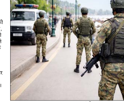
कर दिया था। लगभग 50 ट्रिस्टेड स्पॉट्स बंद कर दिए गए थे। बाद में सिक्कीरिटी ऑडिट के बाद कुछ स्पॉट दोबारा खोले गए। पहलगांम में वैरिफिकेशन के बाद ही ट्रिस्टेड और वेंडरों को एंटी टी जा

पहलगांम आतंकी हमले की पहली बरसी से पहले कश्मीर भर के ट्रिस्टेड स्पॉट्स पर सुरक्षा बढ़ा दी गई है। सभी सुरक्षा एजेंसियों को निर्देश दिया गया है कि वे पहलगांम हमले की बरसी पर ट्रिस्टेड स्पॉट्स के आसपास, किसी भी संभावित आतंकी हमले को लेकर सतर्क रहें। पहलगांम आने वाले ट्रिस्टेडों की सुरक्षा सुनिश्चित करने के लिए कई कदम उठाए गए हैं।