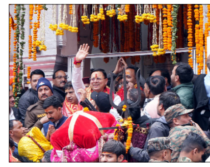
रविवार को मां गंगा की उत्सव डोली भैरव घाटी स्थित भैरव मंदिर से चलकर गंगोत्री धाम पहुंची। गंगोत्री धाम में विशेष पूजा-अभिषेक के साथ 12 बजकर 15 मिनट पर गंगोत्री मंदिर

मुख्यमंत्री पुष्कर सिंह धामी ने गंगोत्री धाम में कपाटोद्घाटन समारोह में संकल्प लेकर प्रधानमंत्री नरेन्द्र मोदी के नाम से पहली पूजा की और चारधाम यात्रा के सफल आयोजन तथा देश-प्रदेश की सुख समृद्धि एवं खुशहाली की मंगल कामना की है। धार्मिक परंपराओं के अनुसार