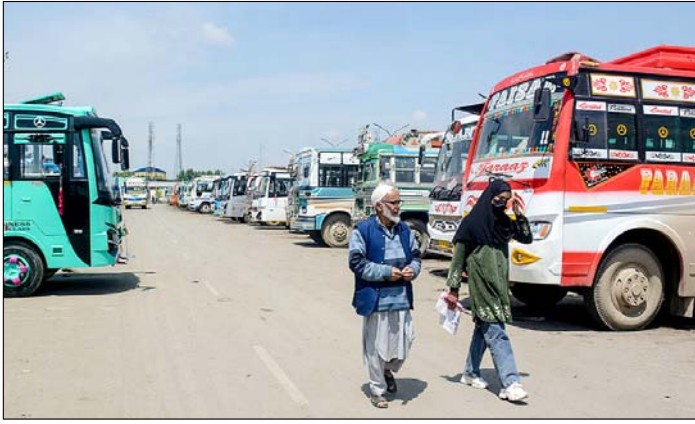
श्रीनगर। मिजी बसों के चालकों और कंडक्टरों द्वारा सरकार के स्टाटो सिटी बस सेवाओं को अन्य जिलों में विस्तारित करने के प्रस्ताव के खिलाफ विरोध प्रदर्शन के बाद बस स्टैंड के पास से गुजरते लोग।

नई दिल्ली। प्रधानमंत्री नरेन्द्र मोदी और दक्षिण कोरिया के राष्ट्रपति ली जे म्युंग ने सोमवार को यहां द्विपक्षीय मुद्रा पर व्यापक वार्ता कर दोनों देशों के संबंधों को 'भविष्योन्मुखी साझेदारी' में बदलने का संकल्प लिया और कहा कि भारत तथा दक्षिण कोरिया के बीच के ये संबंध प्रौद्योगिकी, व्यापार और हिंद-प्रशांत क्षेत्र में साझा रणनीति, तिक हितों पर आधारित होंगे। बैठक के बाद संयुक्त संवाददाता सम्मेलन को संबोधित करते हुए मोदी ने कहा कि आठ वर्ष बाद दक्षिण कोरिया के राष्ट्रपति को यह भारत यात्रा, अत्यंत महत्वपूर्ण है और दोनों देशों के बीच के गहरा तालमेल को दर्शाती है। उन्होंने कहा कि लौकतांत्रिक मूल्य, बाजार अर्थव्यवस्था और कौशल के शासन के प्रति सम्मान दोनों देशों की मूल पहचान का हिस्सा है।