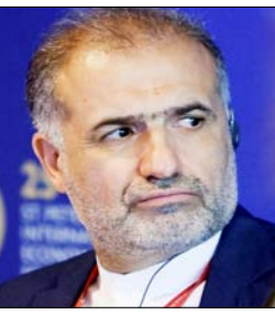
जैसी रणनीतिक चिंताओं तक आ गए हैं। उन्होंने तर्क दिया कि अमेरिका की ए महत्वाकांक्षाएँ भी पूरी नहीं हुईं। उन्होंने कहा कि शुरूआत में वे सत्ता परिवर्तन चाहते थे, लेकिन अब वे उस स्थिति में आ गए हैं, जहां वे केवल हॉर्मुज जलडमरूमध्य को खोलना चाहते हैं।