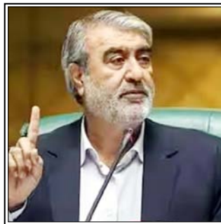
ईरान को अपने शांतिपूर्ण उद्देश्यों के लिए परमाणु उपकरणों के उपयोग का पूरा अधिकार: काजेम जलाली ईरान अपने राष्ट्रीय हितों के आधार पर काम करता है अगर बातचीत से ऐसे नतीजे निकलते हैं जो युद्ध के मैदान की उपलब्धियों को सुरक्षित रखते हैं, तो यह एक अवसर है: अजीजी

तेहरान/मास्को। ईरान के वरिष्ठ सांसद इब्राहिम अजीजी ने सोमवार को अमेरिका के साथ चल रही कूटनीतिक बातचीत को सैन्य संघर्ष का ही एक विस्तार बताया है। उन्होंने जोर देकर कहा कि कोई भी बातचीत तभी होगी जब वह पूरी तरह से ईरान के राष्ट्रीय हितों और सुरक्षा के पक्ष में हो।