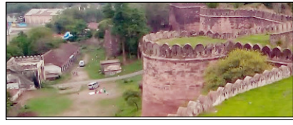
अब बदलाव की प्रयोगशाला बनने को तैयार है मप्र का धार सम्पादकीय