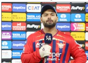
होगा। हर खिलाड़ी को जिम्मेदारी लेनी होगी। यह एक या दो खिलाड़ियों की बात नहीं हो सकती, पूरी टीम की बात है। और बहुत से लोग इसकी जिम्मेदारी लेते, इसमें कोई शक नहीं।

लखनऊ, वाता। लखनऊ सूर्य जायंट्स के कप्तान रिषभ पंत ने इंडियन प्रीमियर लीग (आईपीएल) 2026 में मिली लगातार पांचवां बार के बाद कहा कि हमें ब्रेक की जरूरत है और हर खिलाड़ी को जिम्मेदारी लेनी होगी। कोलकाता नाइट राइडर्स के खिलाफ रिविवाउर के तुर-बदुव भूय में के सुपर ओवर में मिली हार के बाद पंत ने कहा कि देखाए, मुझे लगता है कि हमें निश्चित तौर पर ब्रेक फ्रेज चाहिए। हम मुझे को रोनाया करोगी। देखाव तो हमारा होगा। और यह हमेशा देखाव वाला खेल रहेगा। लेकिन साथ ही हमें जवाब बाहर नहीं, अन्तर भीतर दृढ़ते होंगे। चीजों को सल रखना