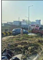
शाह टाइम्स संवाददाता मौर्याज: नंगाल हाईवे पर लभारी ओवरब्रिज पर सोमवार को ट्रैक्टर-ट्रॉली अचानक पलटी, दो गंभीर घायल हुए।

लभारी ओवरब्रिज पर सोमवार को ट्रैक्टर-ट्रॉली अचानक पलटी, दो गंभीर घायल हुए। घटना के बाद मौत और दो गंभीर घायल हुए। घटना के बाद मौत और दो गंभीर घायल हुए। घटना के बाद मौत और दो गंभीर घायल हुए।