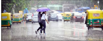
पूर्वोत्तर भारत में अगले पांच दिनों तक भारी बारिश होने की संभावना, असम, मेघालय में अलर्ट जारी

पिछले कुछ दिनों से भीषण गर्मी के कारण देश की जनता का बुरा हाल है, देशभर में हीटवेव का रेड अलर्ट जारी है। दुनियाभर के सबसे गर्म शहरों को लिस्ट में भारत के सबसे अधिक शहर नाम दर्ज हैं। महाराष्ट्र के अकोला शहर में तो पारा 46.9 डिग्री सेल्सियस तक पहुंच गया, जो देश का सबसे अधिक तापमान दर्ज किया गया।