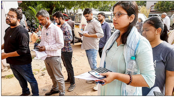
पटना। बिहार लोक सेवा आयोग (बीपीएससी) की 71वीं संयुक्त मुख्य (लिखित) प्रतियोगिता परीक्षा में शामिल होने से पहले कतारों में इंतजार करते उम्मीदवार।