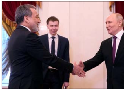
मैं जुटा है। साथ ही पुतिन ने कहा कि हम हर वो काम करेंगे जो ईरान के हित में होगा। दोनों नेताओं की वार्ता के बाद ईरान के विदेश मंत्री अराघची ने रूसी राष्ट्रपति का धन्यवाद किया। इस मीटिंग के बाद से पश्चिमी एशिया में चल रहा युद्ध का माहौल एक बार फिर गर्म हो गया है, क्योंकि सभी जानते हैं कि इस युद्ध में ईरान का समर्थन रूस कर रहा है। साथ ही चीन भी रूस के पीछे-पीछे चल रहा है।

रूसी मीडिया के मुताबिक, पुतिन ने कहा कि ईरानी जनता साहस और वीरता के साथ अपनी आजादी और संप्रभुता के लिए लड़ रही है। उन्होंने यह भी कहा कि उन्हें ईरान के सुप्रीम लीडर मुज्तबा खामनेई का संदेश मिला है। अराघची की यह यात्रा ऐसे समय हुई है, जब अमेरिका और ईरान के बीच हालिया बातचीत किसी नतीजे पर नहीं पहुंच सकी। ऐसे में ईरान रूस का समर्थन मजबूत करने