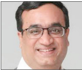
आप 'अरबपतियों की पार्टी': अजय माकन

कांग्रेस पार्टी के राष्ट्रीय कोषाध्यक्ष अजय माकन ने पंजाब के हालात को लेकर गंभीर चिंता जताते हुए कहा है कि पंजाब में अलगाववादी ताकतें एक बार फिर सिर उठाने लगी हैं। माकन ने सोमवार को एक संबोधन में आरोप लगाया कि देश को सरहद की रक्षा करने वाले अहम राज्य पंजाब में गैंगवार, ड्रोन के जरिए ड्रग्स की सप्लाई और बढ़ता अपराध 1980 के दशक जैसे हालात की ओर इशारा कर रहे हैं।