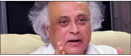
इजरायल पर भारत के रुख को नहीं मिला समर्थन: कांग्रेस

नई दिल्ली, मुजफ्फरनगर, देहरादून, हल्द्वारी, मुतादाबाद, बरेली, मेरठ व लखनऊ से प्रकाशित