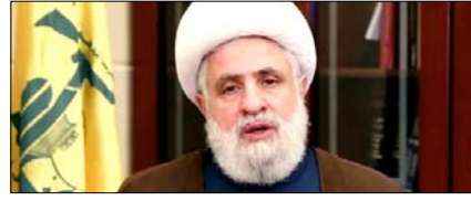
इजरायल के साथ सीधी बातचीत की संभावना नहीं: हिजबुल्लाह