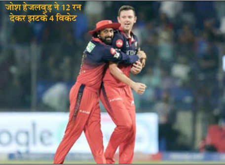
विराट कोहली कोन पर हैं। तीसरे ओवर में जैकब बेथेल ने लगातार दो विकस लगा दिए। उन्होंने शार्ट गेंद पर खतरा तरीके से पिकअप शॉट खेलकर मिडविकेट के ऊपर छक्का मारा। अगली बाल में