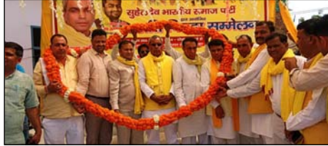
सुहरेदर देव भास्कर विद्यालय पर अति पिछड़े समाज के लोगों का कार्यक्रम।

शाह टाइम्स ब्यूरो अमरोहा। कैबिनेट मंत्री एवं सुहरेदर समाज पार्टी के राष्ट्रीय अध्यक्ष ओमप्रकाश राजभर ने कहा कि अति पिछड़ा समाज लंबे समय तक उपेक्षा का शिकार रहा है, लेकिन अब हालात बदल रहे हैं। सरकार को को. शिखा है कि योजनाओं का लाभ समाज के अतिम वंचित तक पहुंचे।