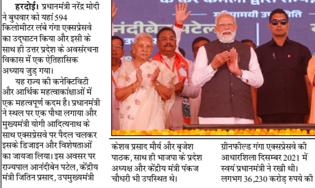
केसरा प्रसाद मौर्य और बुनेश पाठक, साथ ही भाजपा के प्रदेश अध्यक्ष और अंतरिम मंत्री पंकज चौधरी भी उपस्थित थे।

उप के पूर्वी और पश्चिमी हिस्सों को जोड़ने वाली लाइफलाइन साबित होगा एक्सप्रेसवे