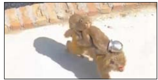
नगर आया। बच्चे की हालत देखकर आसपास के लोगों की निगाहें तो गूढ़ घटना की जानकारी मिलते ही बड़ी संख्या में बंदर आसपास की लोटे पर जमा हो गए। मोहल्ला के लोगों को मुताबिक बंदरों का हूँद काफी दर

शाह टाइम्स संवाददाता अमरोहा। नगर के मोहल्ला गांधी नगर में बुधवार दोपहर एक अजीबो-गरीब घटना से अफरा-तफरी का माहौल बन गया। जहां एक बंदर के बच्चे का सिर लोटे में फंसा गया, जिसके बाद यह इधर-उधर भागता और छटपटाना दिखाई दिया। घटना का सीसीटीवी सारल मोडिफ़र पर नेजी से बचालत हो रहा है।