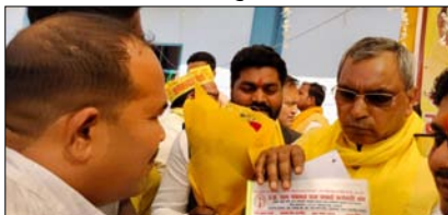
शाह टाइम्स संवाददाता अमरोहा। ग्राम पंचायत राज सफाई कर्मचारियों से अग्रणी विभिन्न लक्ष्यों को लेकर पंचायती राज विभाग के कैबिनेट मंत्री को ज्ञापन सौपा है।