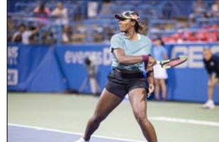
को हारने के बाद - इस दौरान दो बड़े पॉइंट गंवाने के बाद - मैच चार बार की गैंड स्लैम एकल चैंपियन के पक्ष में सीधे नतीजे के लिए तैयार लग रहा था। लेकिन बेंटिटर अभी इस गोलियाथ के सामने हारने के लिए तैयार नहीं हो गया।

मैड्रिड, बार्ता। दुनिया की नंबर 30 रैंकिंग खिलाड़ी आरना सबालेंका को हरा हैली बेंटिटर ने किया मैड्रिड ओपन में महिला एकल टेनिस क्वार्टर-फाइनल मुकाबले में तीसरी सीड आरना सबालेंका को हराकर मैड्रिड ओपन 2026 का बड़ा उलटफेर किया।