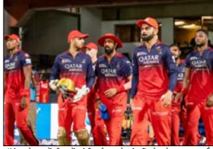
पॉइंट्स टेबल में चीजों में फर्सी हुई है और उसका नेट रन रेट भी नेगेटिव है। बेंगलूर की टीम ने इसी सीजन में पहले गुजरात टाइटन्स

अहमदाबाद, बार्ता। मीडुआ चैंपियन रॉयल चैलेंजर्स बेंगलूर आईपीएल 2026 प्लेऑफ की दौड़ में अपनी पकड़ और मजबूत करने की कोशिश करेगी, जब गुरुवार को यहाँ नरेंद्र मोदी स्टेडियम में सीजन के 42वें मैच में उसका सामना गुजरात टाइटन्स से होगा। आरसीबी में मुकाबले में जबरदस्त फॉर्म में उतर रही है, उसने अपने आठ में से छह मैच जीते हैं और 1-919 के शानदार नेट रन के साथ पॉइंट्स टेबल पर दूसरे स्थान पर हैं। वहीं, गुजरात टाइटन्स का प्रदर्शन इस सीजन में उतार-चढ़ाव भरा रहा है, जिसमें उसे चार जीत और चार हार मिली हैं, जिससे वह