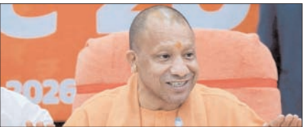
विपक्ष का आचरण लोकतांत्रिक मर्यादा के खिलाफ: योगी

नई दिल्ली, मुजफ्फरनगर, देहरादून, हल्द्वारी, मुतादाबाद, बरेली, मेरठ व लखनऊ से प्रकाशित