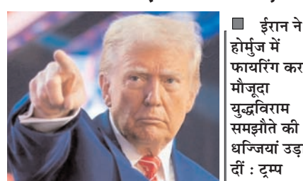
होर्मुज स्ट्रेट किसी बेवकूफ के ट्वीट पर नहीं खुलेगा

ट्रम्प ने दावा किया कि ईरान ने होर्मुज स्ट्रेट में गोलीबारी कर मौजूदा युद्धविराम समझौते की धमकियां उड़ा दी हैं। उन्होंने बताया कि ईरानी हमलों का निशाना फ्रांस और ब्रिटेन के जहाज बने हैं। ट्रम्प के मुताबिक, ईरान का यह कदम उसकी हताशा को दर्शाता है। इस तनाव के बीच ट्रम्प ने कूटनीतिक रास्ते का आखिरी विकल्प भी खुला रखा है। अमेरिकी प्रतिनिधियों का एक दल सोमवार शाम पाकिस्तान की राजधानी इस्लामाबाद पहुंच रहा है। वहां ईरान के साथ निर्णायक बातचीत होनी है। ट्रम्प ने कहा कि यह ईरान के पास आखिरी मौका है। ईरान की ओर से होर्मुज स्ट्रेट को बंद करने की घोषणा पर तंज कसते हुए ट्रम्प ने कहा कि अमेरिकी नाकबंदी ने