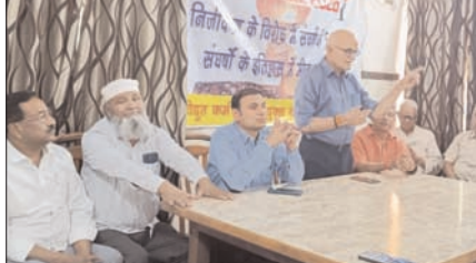
करता है कि निजी कंपनियों उपभोक्ता सेवा के बजाय केवल मुनाफा वसूली को केंद्रित हैं, जबकि बिजली आपूर्ति की गुणवत्ता पूरी तरह उपेक्षित है। संघर्ष समिति ने कहा कि मीटरिंग व्यवस्था में व्यापक अव्यवस्था के कारण उपभोक्ताओं को भारी परेशानियों का सामना करना पड़ रहा है। दुर्भाग्यवश, निजी कंपनियों की विफलताओं का खामियाजा

शाह टाइम्स ब्यूरो लखनऊ। विद्युत कर्मचारी संयुक्त संघर्ष समिति, उत्तर प्रदेश के केंद्रीय पदाधिकारियों ने कहा है कि प्रदेश में स्मार्ट प्रीपेड मीटर व्यवस्था को लेकर उपभोक्ताओं की समस्याएं लगातार बढ़ती जा रही हैं और उनका समाधान नहीं हो पा रहा है। इस गंभीर स्थिति का संज्ञान लेते हुए प्रदेश के ऊर्जा मंत्री अरविंद कुमार शर्मा द्वारा पावर कॉर्पोरेशन के अध्यक्ष को निर्देश दिए गए हैं कि प्रीपेड स्मार्ट मीटर का कार्य देख रही निजी कंपनियों पर सख्त कार्रवाई की जाए। संघर्ष समिति ने इस कदम का स्वागत करते हुए कहा कि यह स्पष्ट