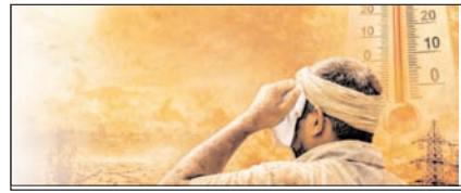
इस साल लोगों को झुलसाएगी गर्मी सम्पादकीय