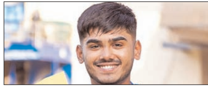
आयुष मन्त्रों की हैमस्ट्रिंग फटी, अब उन्हें बाहर बैठना पड़ेगा